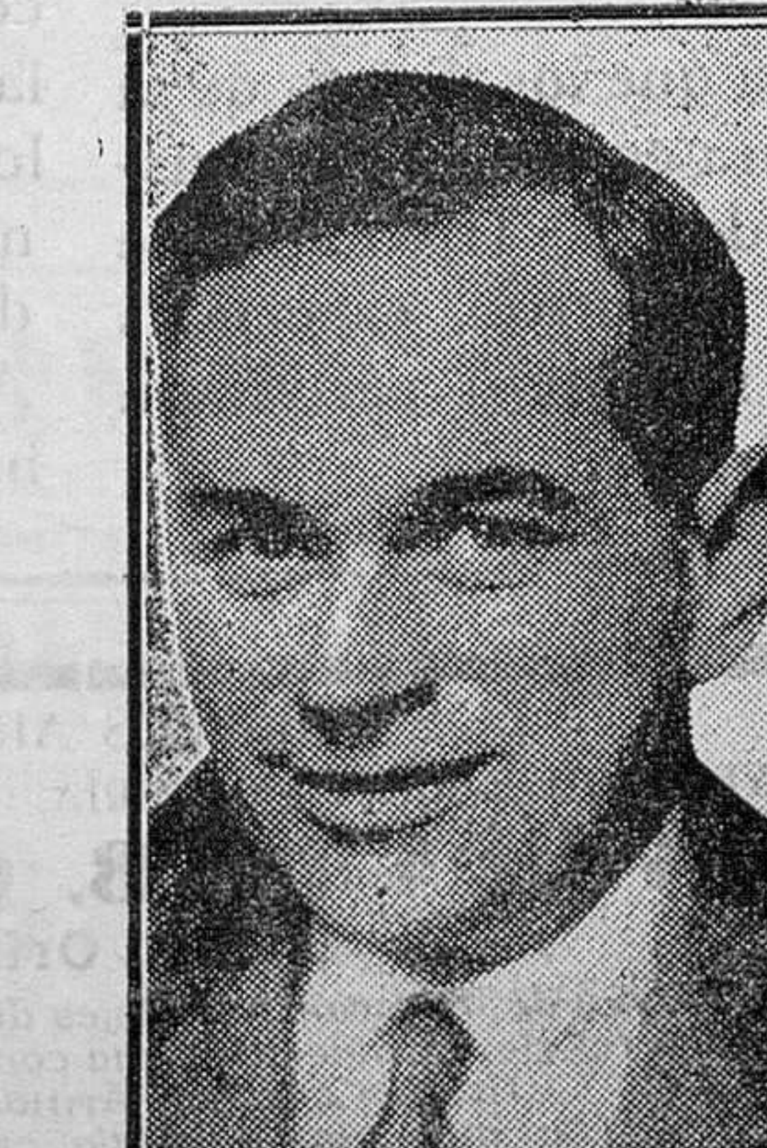
EXTRANJERO. — Parker Cramer, aviador norteamericano que salió de Groenlandia para efectuar un vuelo trasatlántico, y del cual no se tienen noticias desde el domingo

Pero eso no. Ya que un proyecto existe, que se discuta sin pérdida de tiempo. La Cámara ya no debe preocuparse de otra cosa si es que se quiere sacar al país de la inquietud en que vive. Buena o mala, a nuestro juicio — esa es la base, y suponemos que los señores diputados se esforzarán en modificar y perfilar, si saben, el proyecto que comentamos. Preferible será tener un Estatuto imperfecto, a no tener, como sucede ahora, ninguno. Porque ya habría, tendiéndolo, y no es poco, unas garantías definidas y unos derechos establecidos.