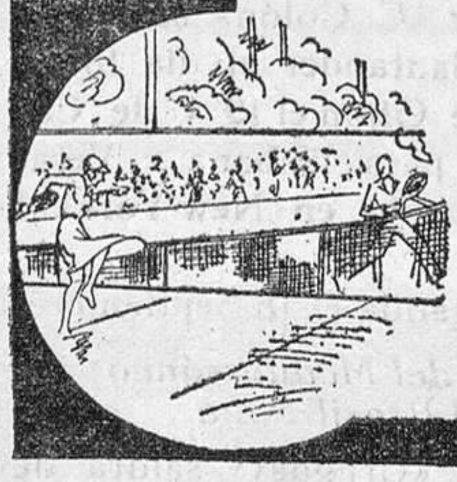
VALDAI DE MALAVELLA (Gerona)

Administración: Rambla de las Flores, 18, entlf. - Barcelona