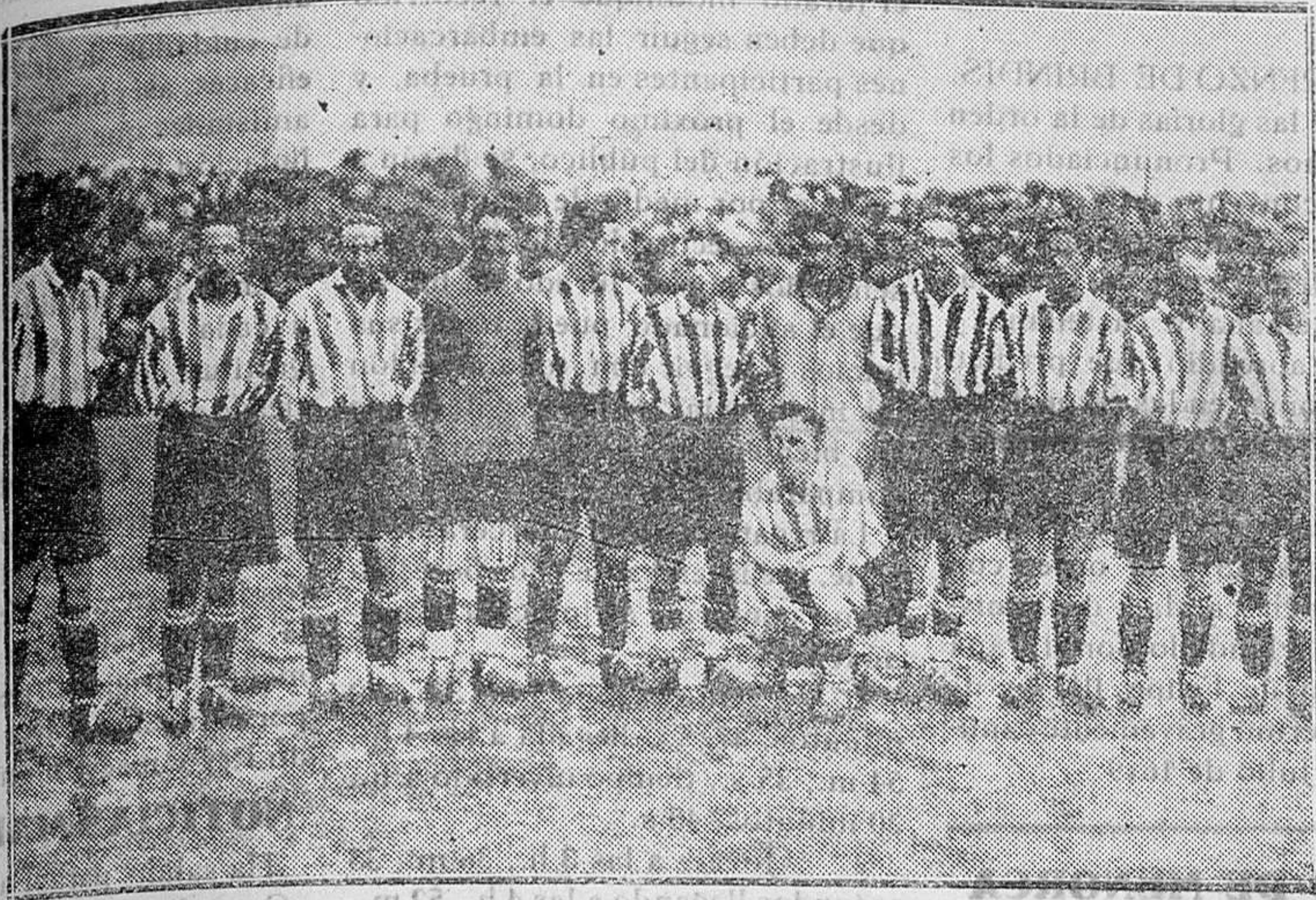
MADRID.—El equipo del «Athletic Club» de Bilbao que venció al «Betis» de Sevilla por 3 a 1, quedando campeón de España