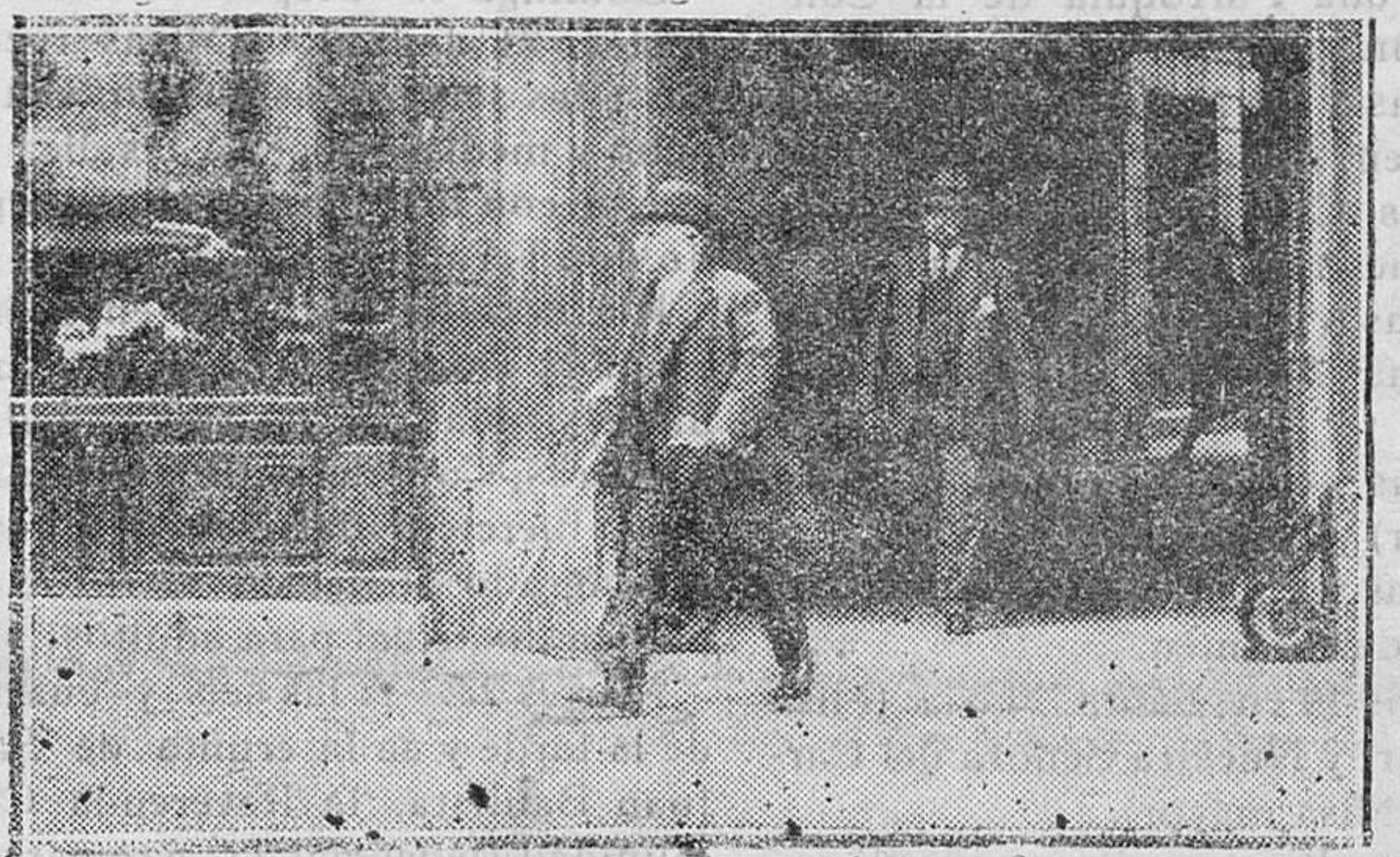
EXTRANJERO. — El Presidente Gaston Doumergue, saliendo de la casa donde tenía su residencia privada, en la Avenida Wagram, después de haber vigilado las operacio- nes de mudanza de su biblioteca, pues el Presidente que cesa, por haberse casado, se trasladó el día 13 a Tournefeuille para reunirse con su esposa

Véndense en la LIBRERÍA SIN- TES, Plaza del Príncipe, 17, Ma- hón.