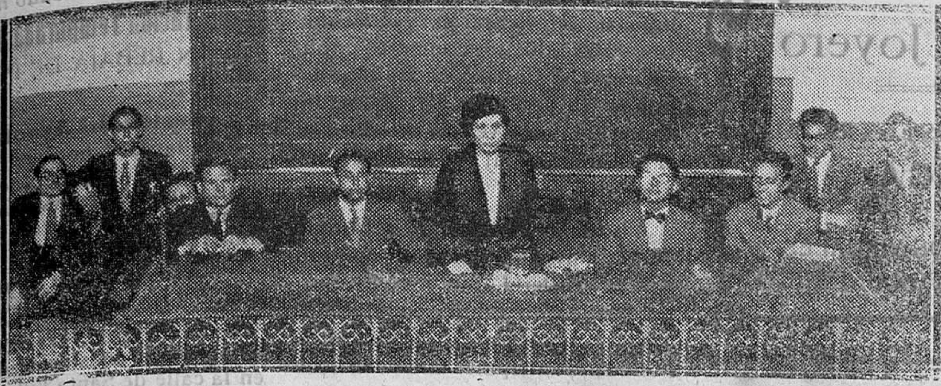
MADRID.—La señorita Victoria Kent, directora de Prisiones, durante su conferencia en la Universidad sobre los problemas de la vida penitenciaria

PRECIOS DE SUSCRIPCIÓN En la Isla al mes..... 2,00 ptas. En el resto de España al mes 2,50 Extranjero al año..... 60,00 Número suelto..... 10 céntimos Número atrasado..... 20 Anuncios: PAGO ANTICIPADO