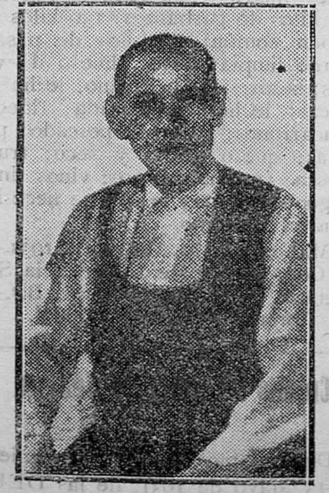
MADRID.—El zapatero de la calle de Isabel la Católica, en poder de quien quedaron en depósito los valores y objetos valiosos salvados durante el incendio del convento de las monjas Bernardas

En Marruecos hay muchos obreros españoles parados. Sin ir más lejos, en este pueblo en que vivo, el Consulado de España reparte diariamente de setecientos a mil pesetas a obreros españoles sin