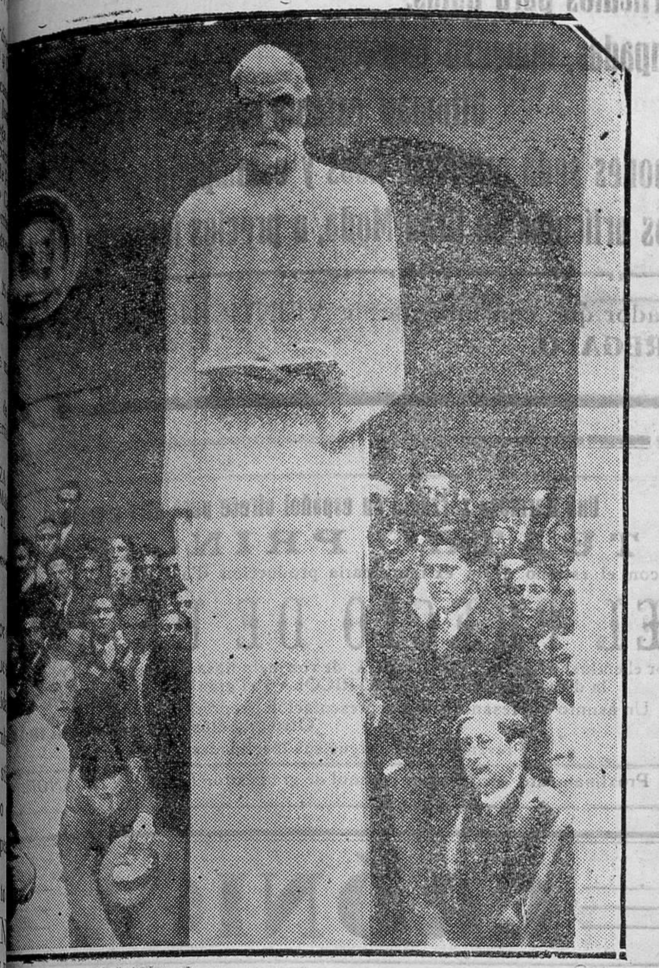
El ministro de Instrucción Pública descubriendo la estatua de Ramón y Cajal en la Facultad de Medicina

Guarda civil de la causa monárquica que defienden propagando entre la juventud francesa doctrinas abiertamente opuestas al Catolicismo.