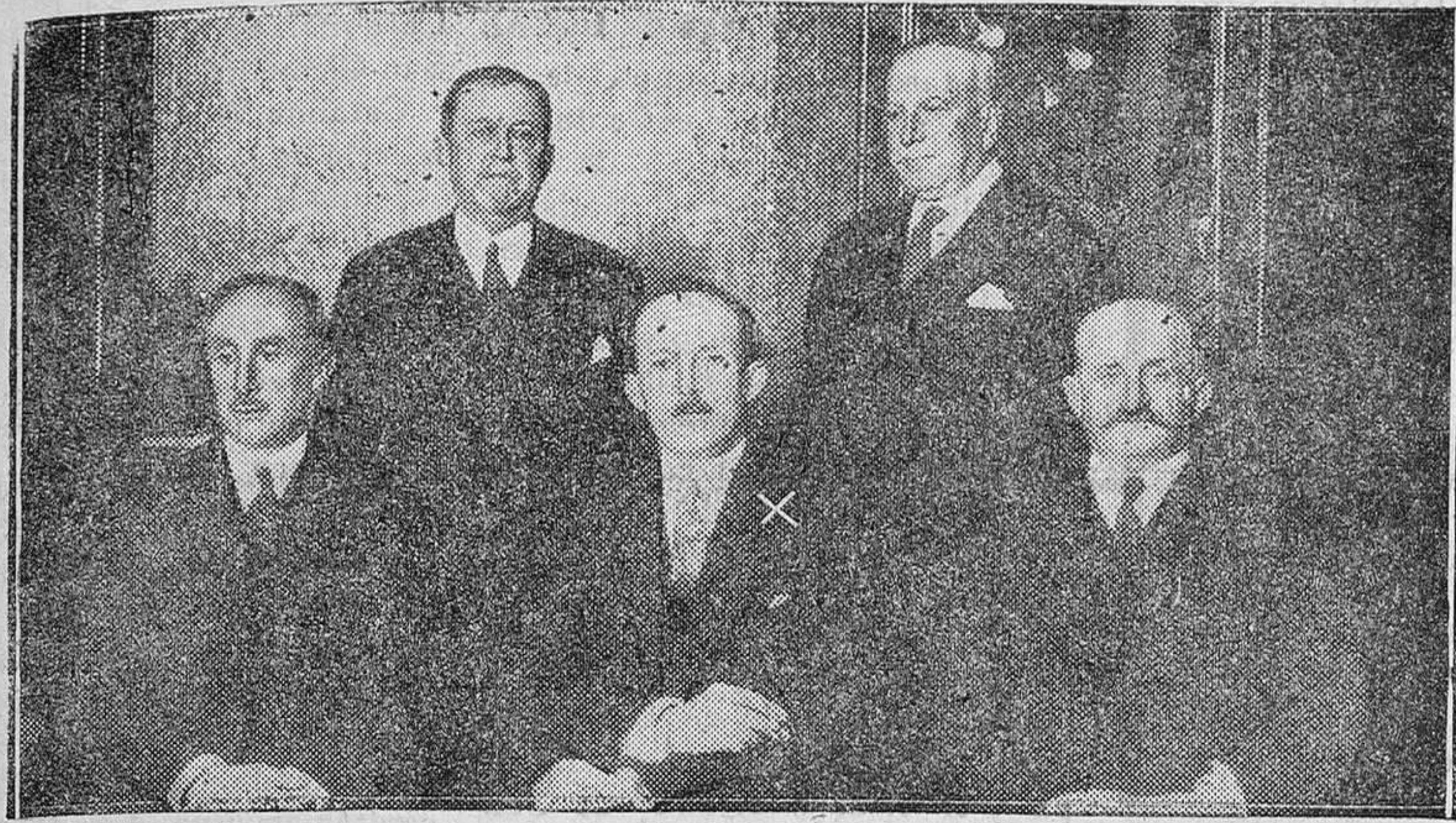
DRID. — El director del Banco Internacional de Pagos, M. Quesnay, con los ministros de Hacienda y Estado señores Ventosa y conde de Romanones, el ministro de Economía conde de Bugallal y el Gobernador del Banco de España señor Bas