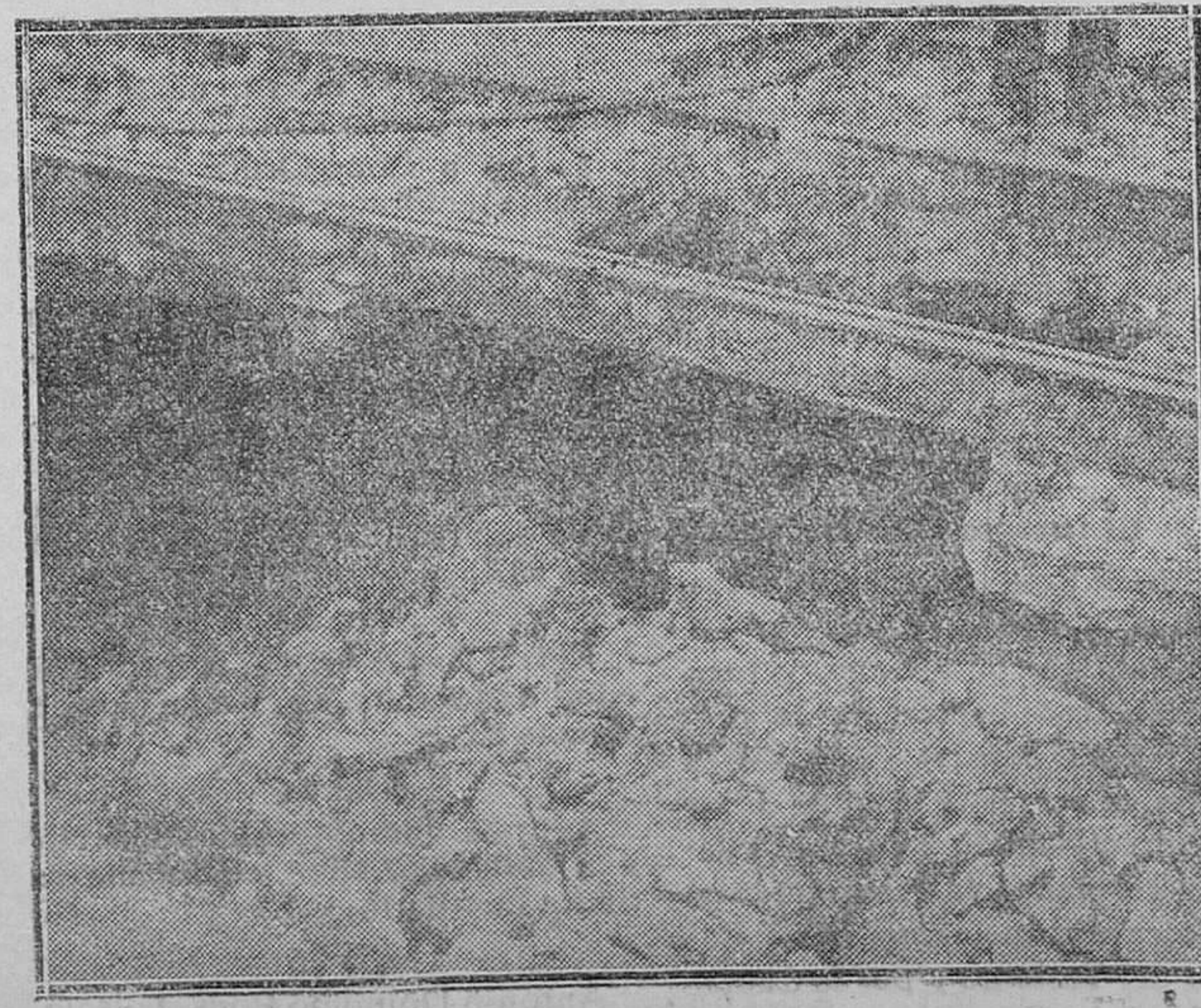
MADRID.—Una vista del hundimiento en la calle de Fernando VI