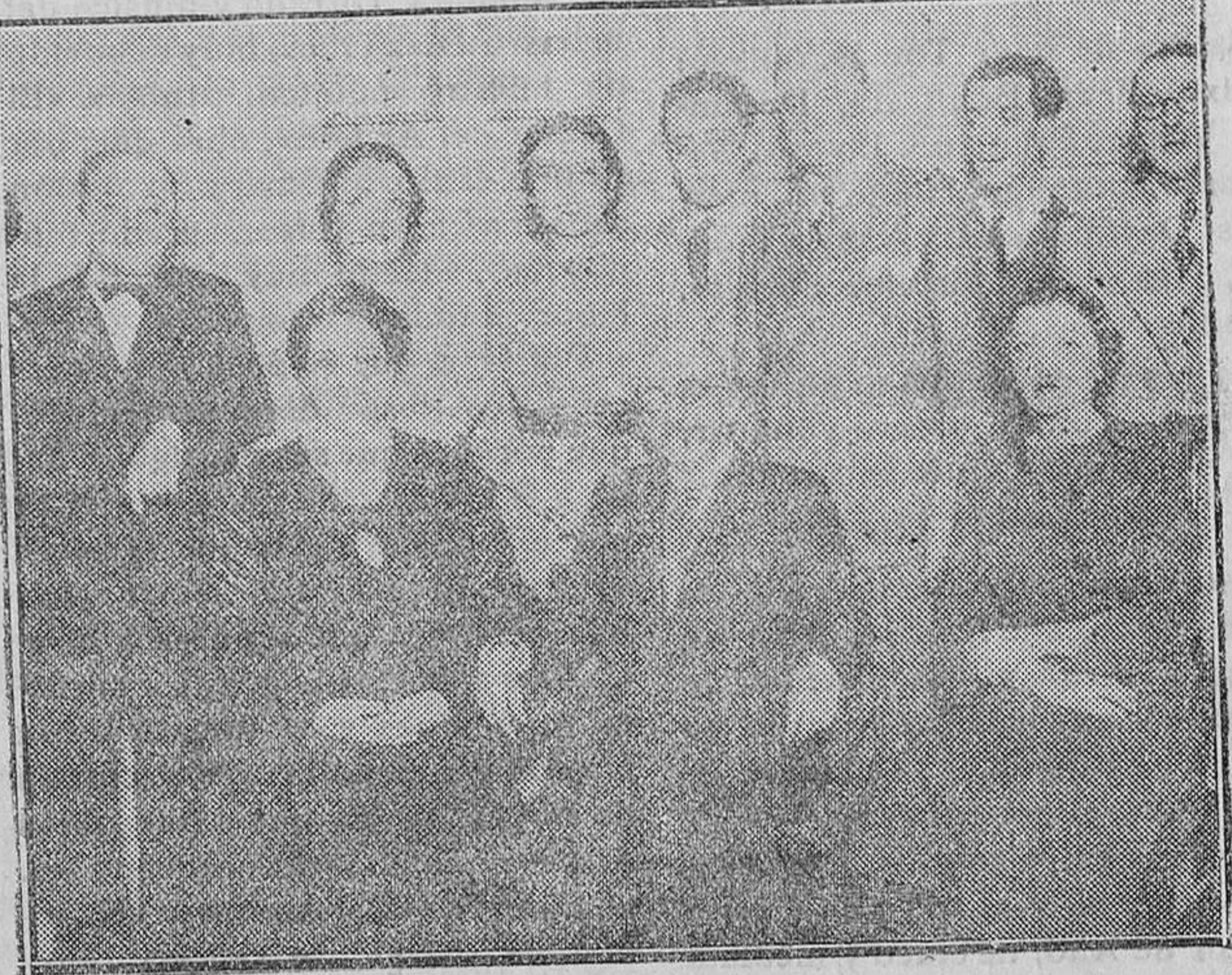
MADRID.—Don Jacinto Benavente, autor de «La verdad inventada», rodeado de los artistas del Teatro Lara, con motivo del homenaje que se le tributó