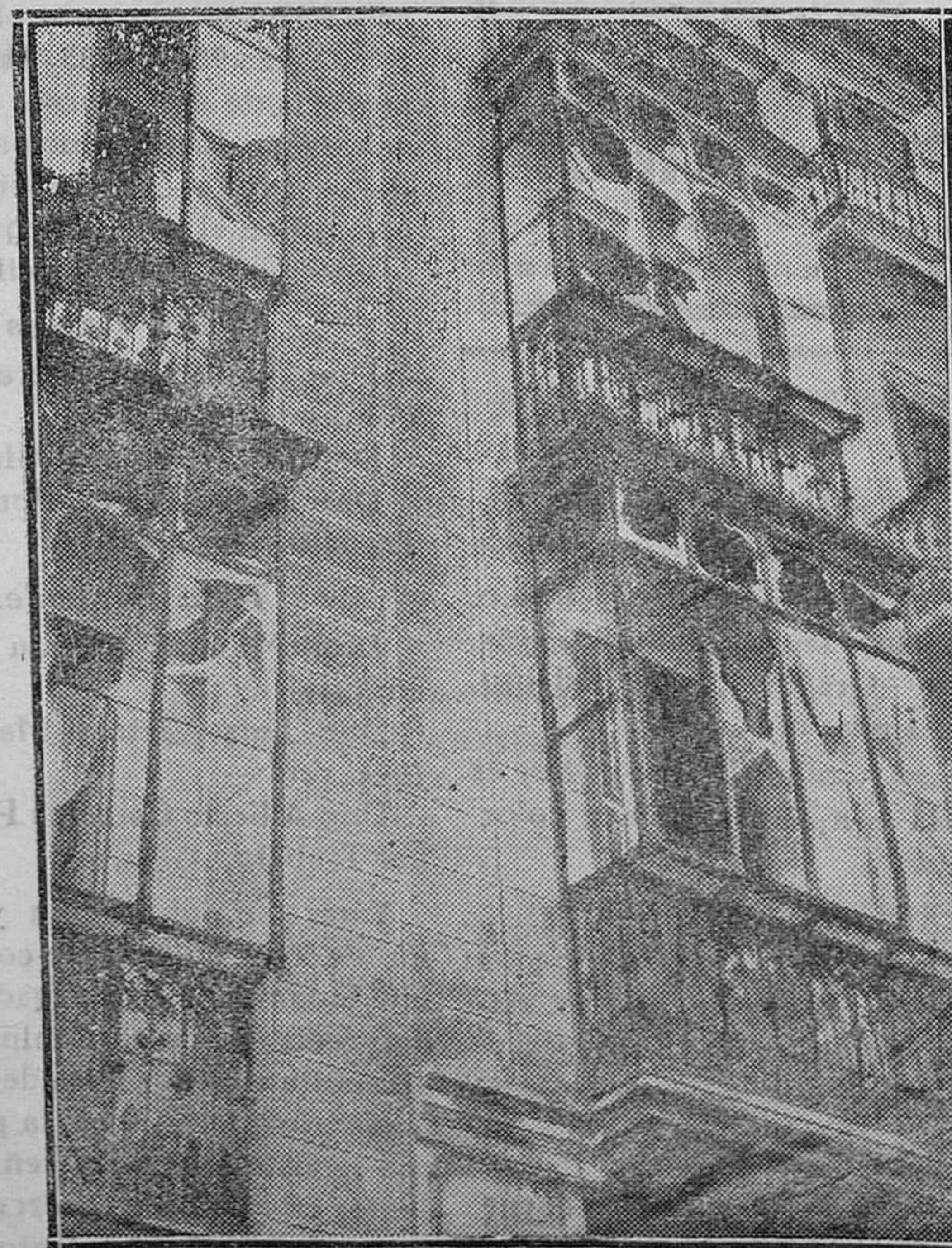
MADRID.—Las únicas consecuencias de la explosión de un petardo en la calle de las Fuentes

Al entrar en aquel tren, mi esposo conoció a un pasajero que baluceaba el italiano y que luego resultó un capitán de la marina mercante holandesa. El buen señor era un hablador de primera fuerza y por él comenzamos a saber qué