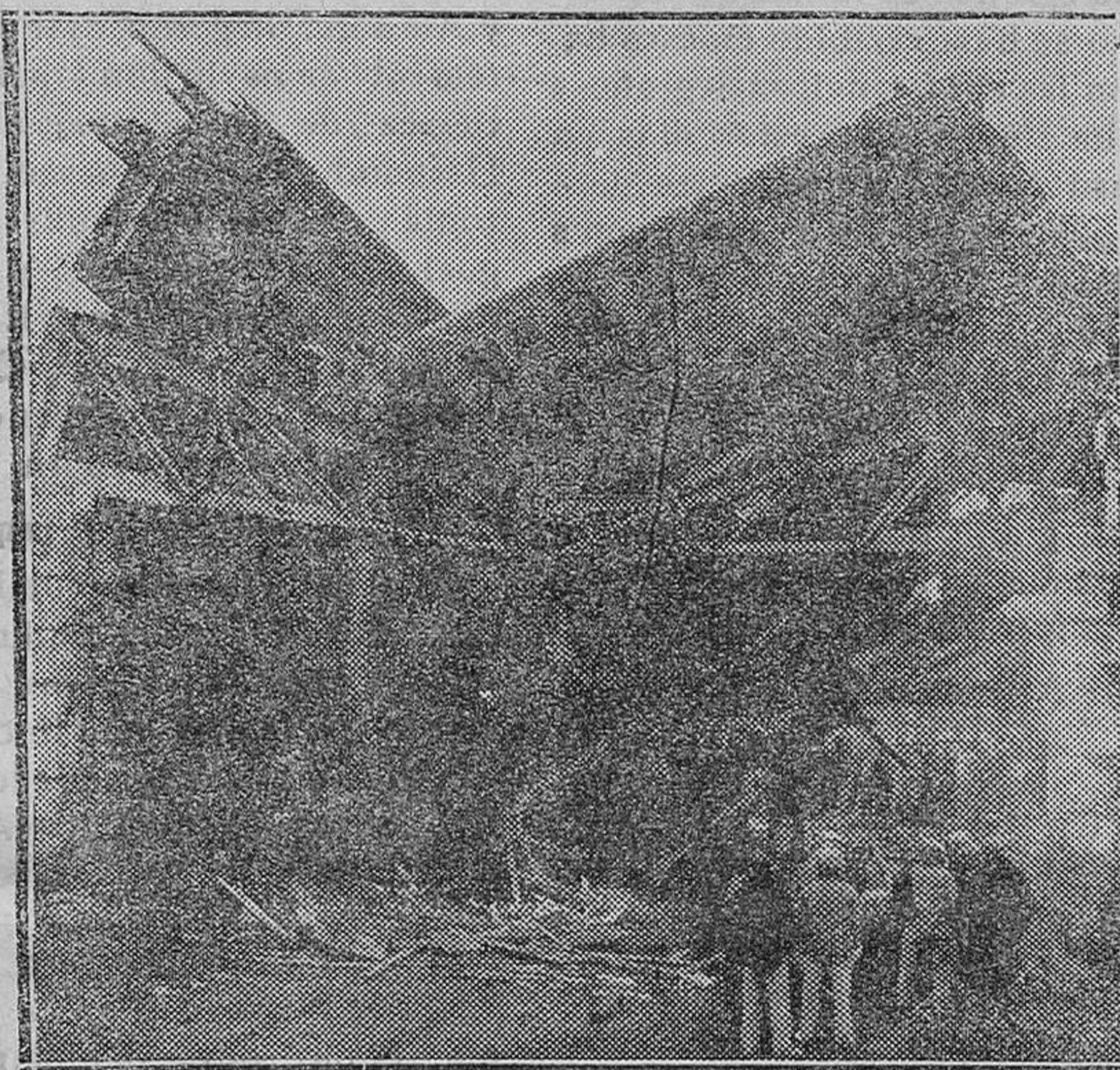
VALENCIA.—La catástrofe de Puzol.—El expreso Valencia-Barcelona cayó a consecuencia de la salvaje destrucción del puente