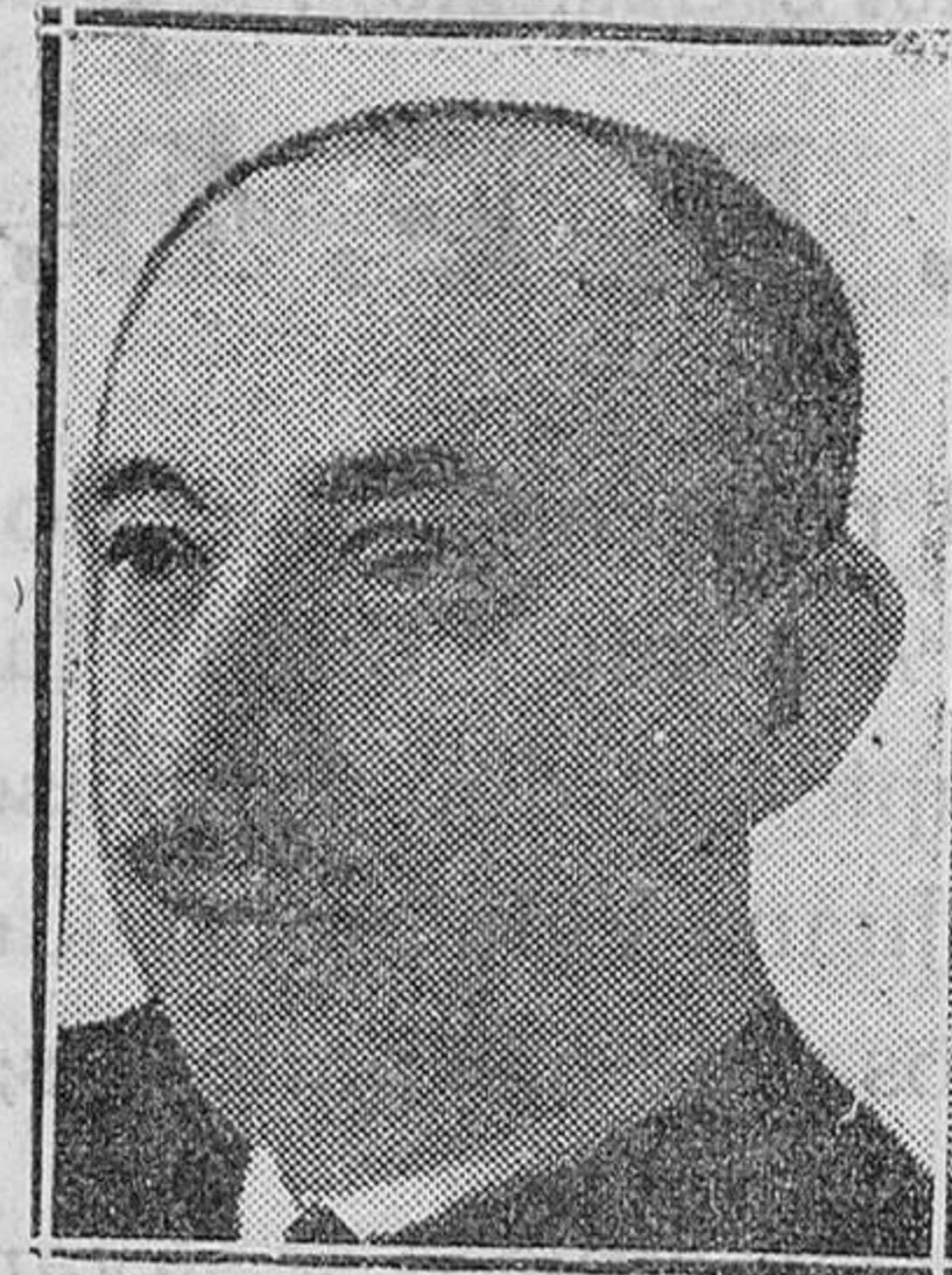
Don Adolfo La Calle, en quien ha recaído el nombramiento de Comisario General de Policía

met, la negación rotunda de los poderes creativos del hombre. Y en su defensa contra el moro había forjado España su fe en la libertad humana frente a las circunstancias.