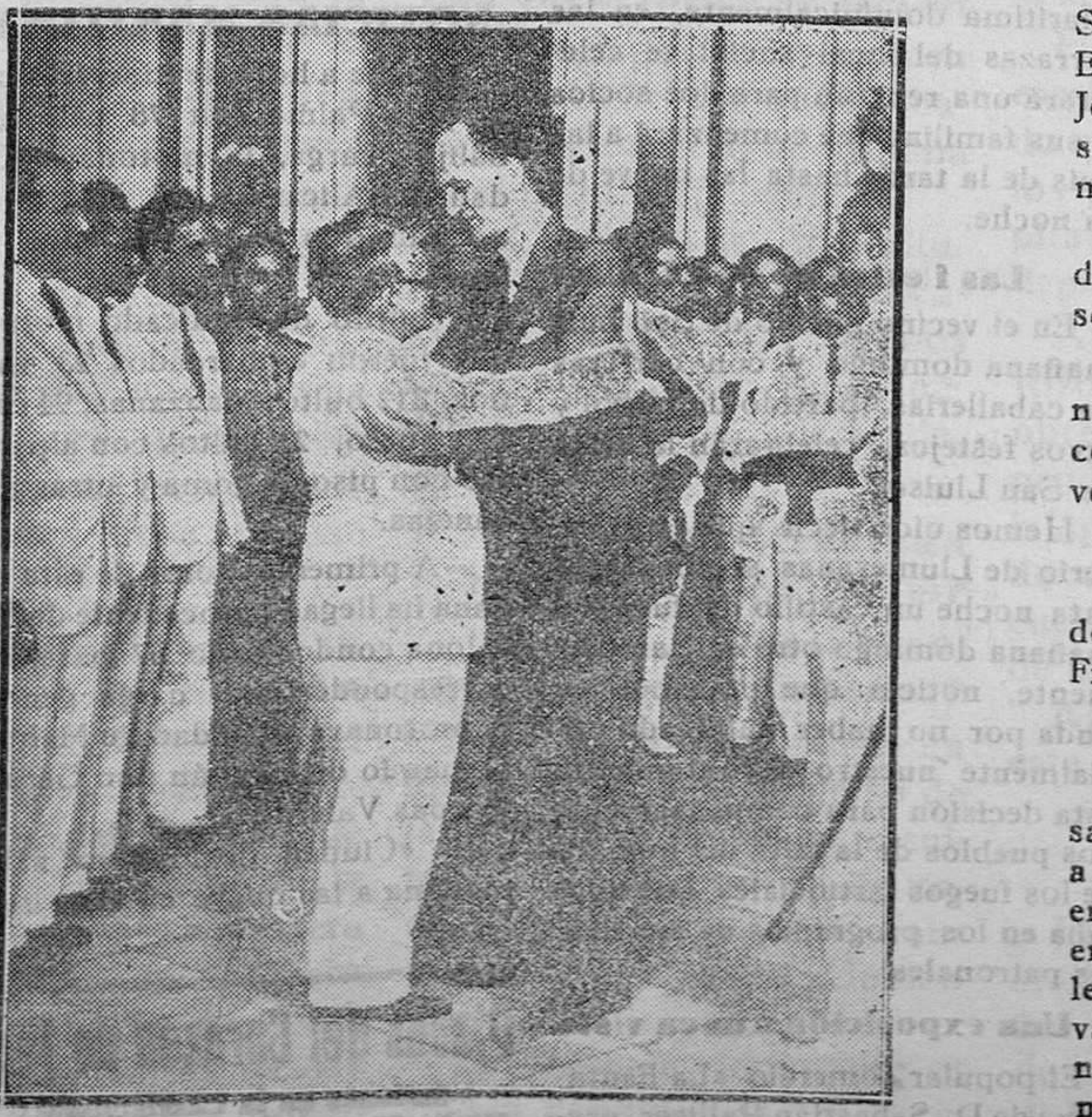
El nuevo Presidente de Cuba don Manuel de Cespedes, abrazando al Embajador de los Estados Unidos, Mr. Welles, después de la formación del actual Gobierno

Parroquia de Santa María Domingo 13.º después de Pentecostés 3 de septiembre—Misas rezadas a las seis menos cuarto, siete, ocho y media y doce. La de siete será de Comunión general para los cofrades del Santísimo Rosario y Juventudes Católicas. A las diez la Misa mayor con homilía por el reverendo señor Economo. A las once y cuarto: Enseñanza de Catecismo para niños y niñas. Por la tarde, a las tres y media, Vísperas, Completas, Exposición de S. D. M., Estación, Rosario, Tantum ergo y Bendición eucarística. Plática doctrinal para adultos. Lunes 4.—A las siete Misa rezada en el altar del Santo Cristo con devoto ejercicio en sufragio de las benditas almas del Purgatorio. Jueves 7.—A las seis y cuarto de la tarde en este templo parroquial y por la Reverenda Comunidad de Beneficidos se cantarán solemnemente Completas en preparación a la Fiesta del siguiente día.