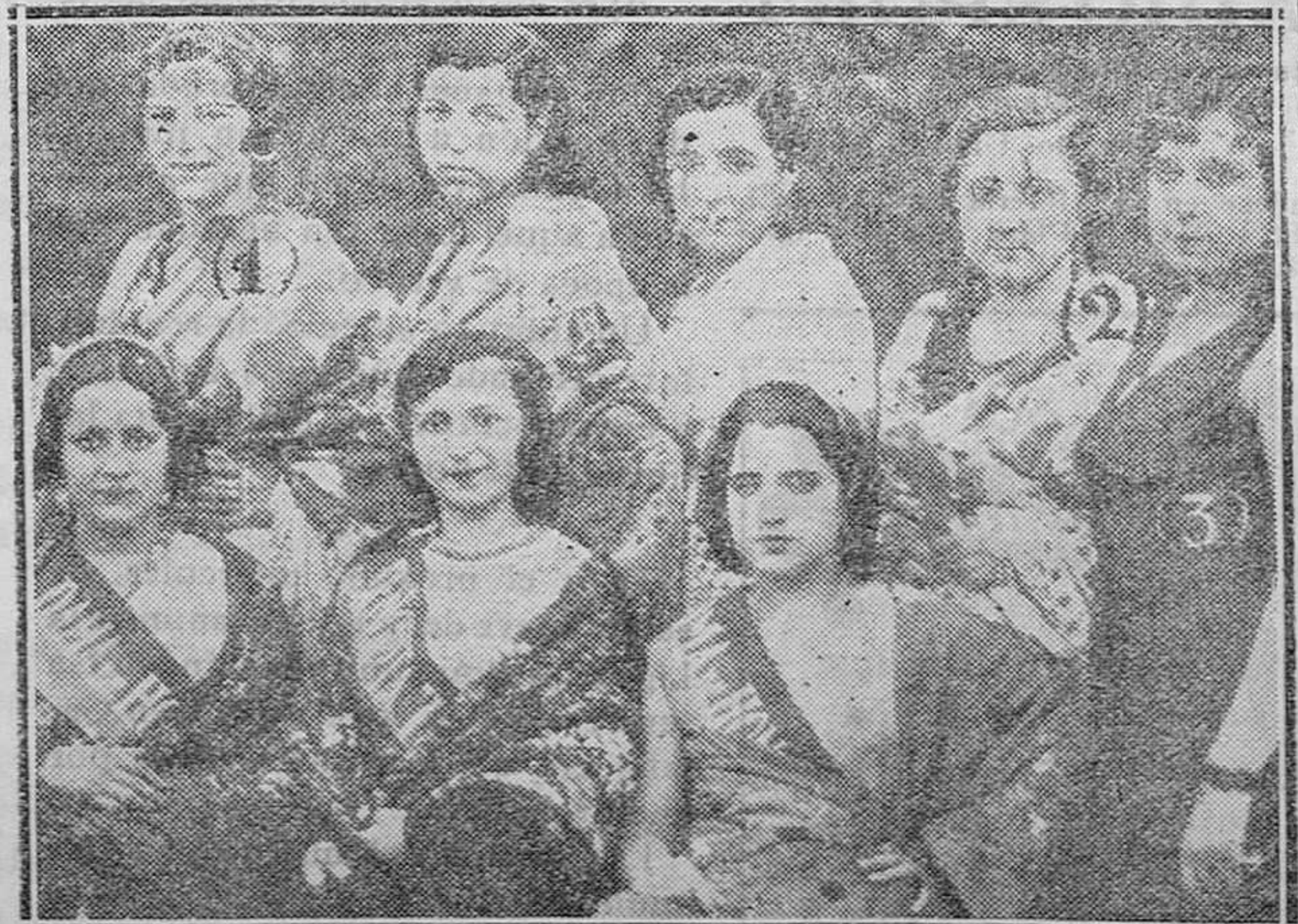
EN LA COLONIA DE LOS PINARES DE CHAMARTÍN Grupo de señoritas que se presentaron al concurso de peñados que se celebró en un festival

Excelente tributo en pro de la cultura, principalmente la rural, supone la publicación de esta biblioteca. Juntando a su modernidad de investigación la sencillez informativa, como elemento de enseñanza y utilización inmediata para los cultivos, cuidado y mejora del ganado, explotación de industrias derivadas, etc., tiende al aprovechamiento de la tierra en forma intensiva, que se apoya en el conocimiento científico del medio natural y social, conocimiento que toda persona, aun sin previa preparación para ello, y por limitada que sea su ilustración, puede em-