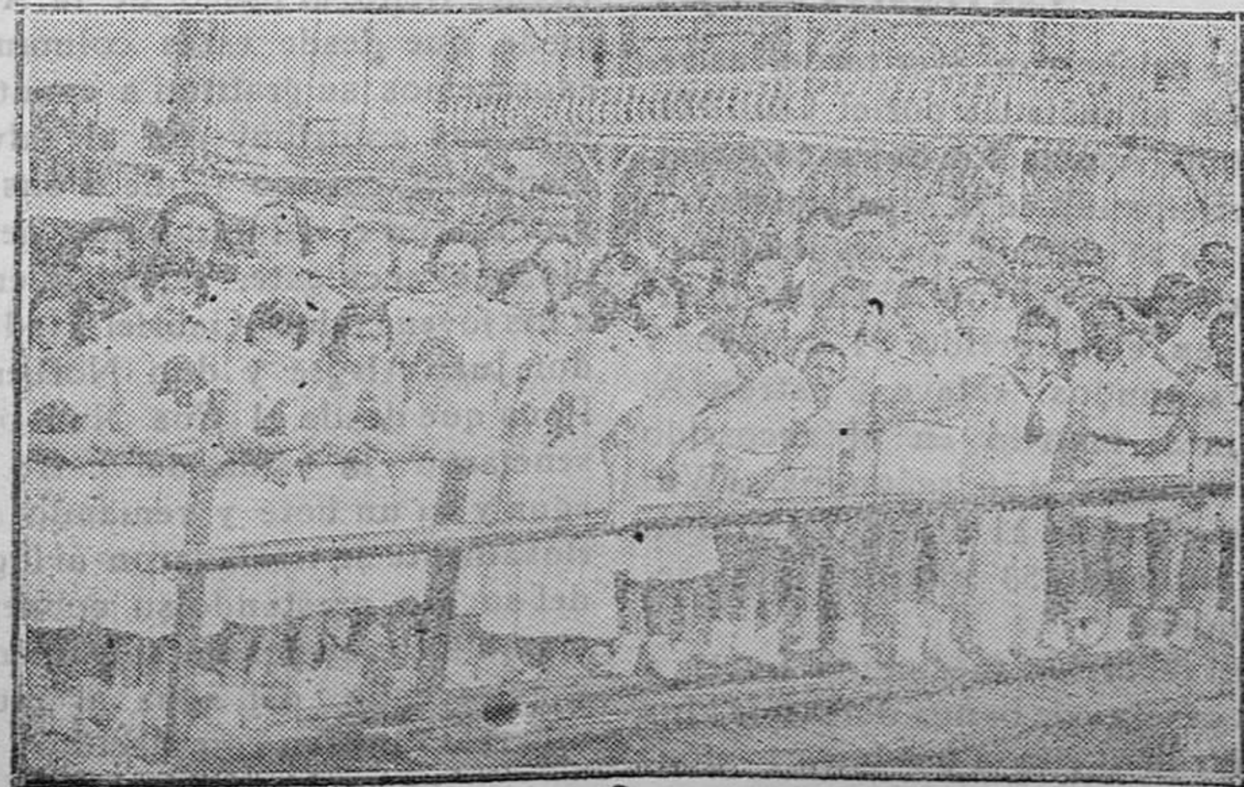
Las niñas y los niños de la Colonia Escolar del Hogar Escuela de Huérfanos de Correos de Madrid, que invita los por el Club Náutico dieron un paseo en canoas automáticas por el puerto de Barcelona

No. Los campos están bien delimitados. El país ya sabe, ya está enterado, de quienes han sido, son o serán, amigos o enemigos de unos y de otros. Los comerciantes deben de pensar seriamente si la táctica de aparecer neutrales en una contienda de esta índole puede favorecerles a la larga. De sobra sé yo cómo piensan individualmente la gran mayoría y cual será su actuación particular en esta materia. Pero yo creo que es locura desperdiciar en estas circuns-