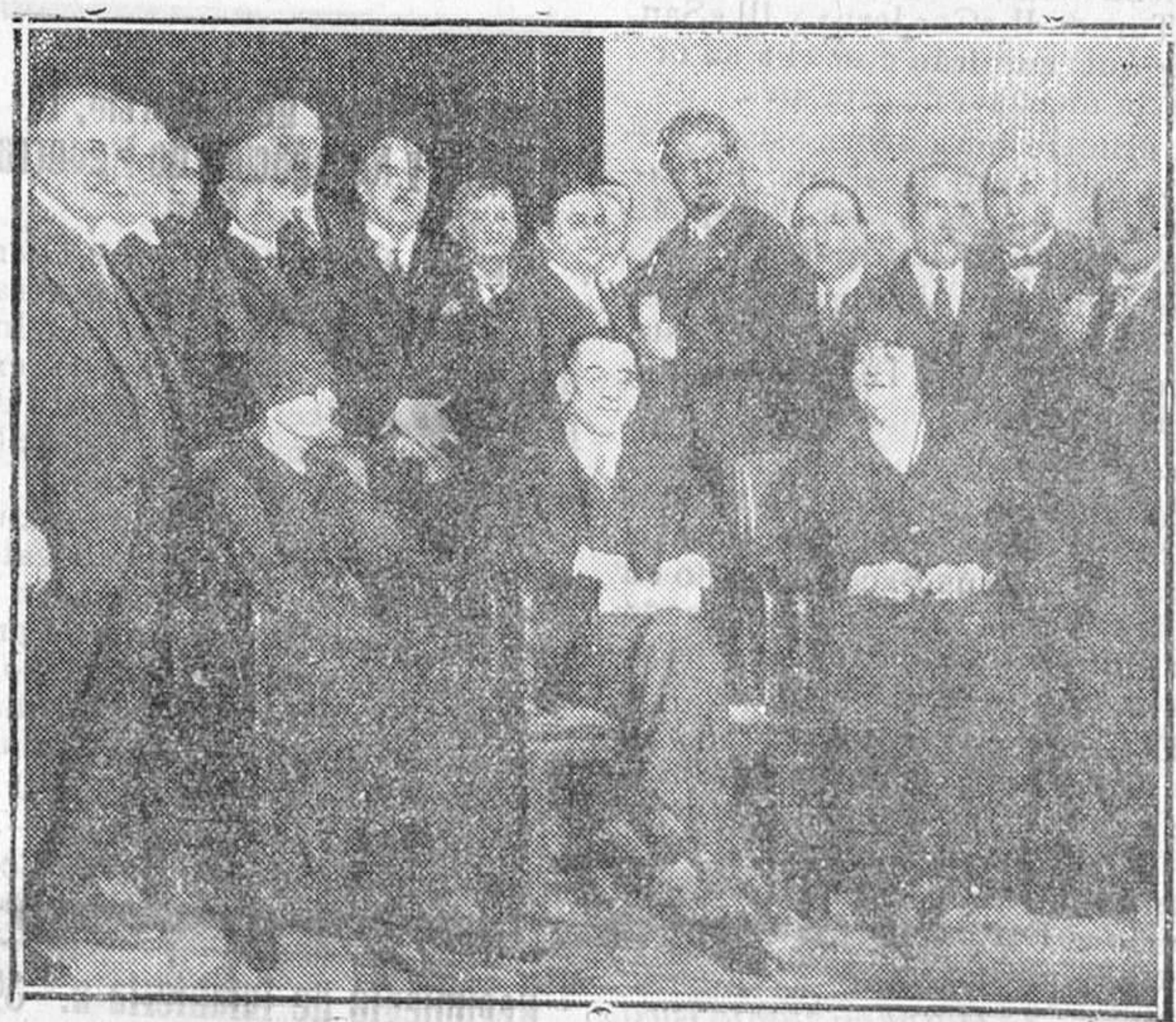
MADRID.—En la Residencia de Estudiantes.—Reunión del Comité Permanente de Letras y Arte de la Sociedad de Naciones.