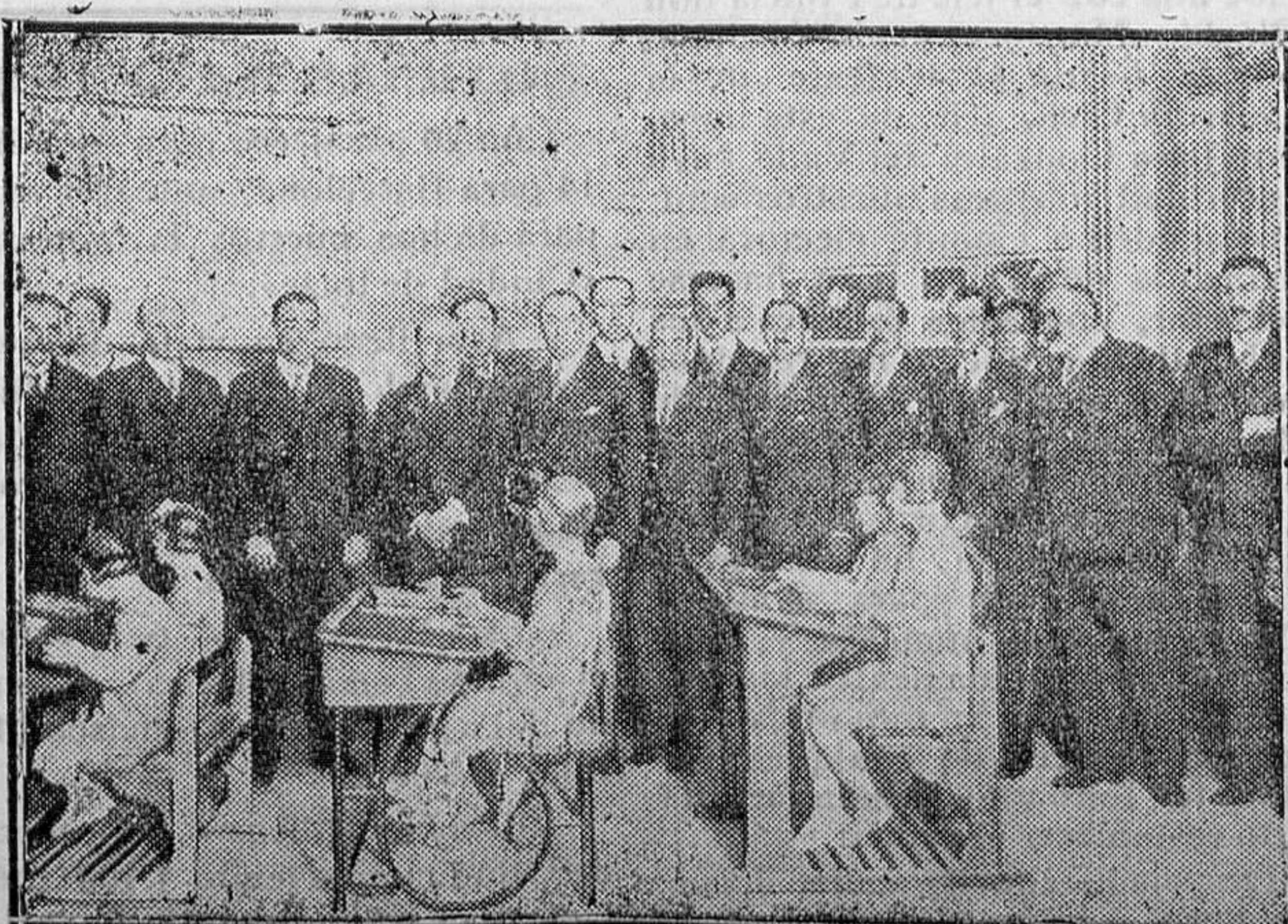
Acto Inaugural de la Exposición francesa del Libro y material de Enseñanza

Esta gran creación viene a proclamar la necesidad que se advierte en toda tarea divulgadora moderna de agrupar un conjunto de autores para el trazado de obras de envergadura, en las que la armonía del plan, la unidad de método y el previo sentido consciente de su finalidad, aseguren el logro feliz de lo propuesto, siendo todo ello resultado, en el caso concreto que nos ocupa, de la cooperación de casi una veintena de especialistas, destacados historiadores, profesores, bibliotecarios, etc., de España e Hispanoamérica, a cargo de cada uno de los cuales corrió la redacción de aquella parte más en armonía con su dedicación de por vida. Directores de la obra son el doctor don Pedro Bosch Gimpera,