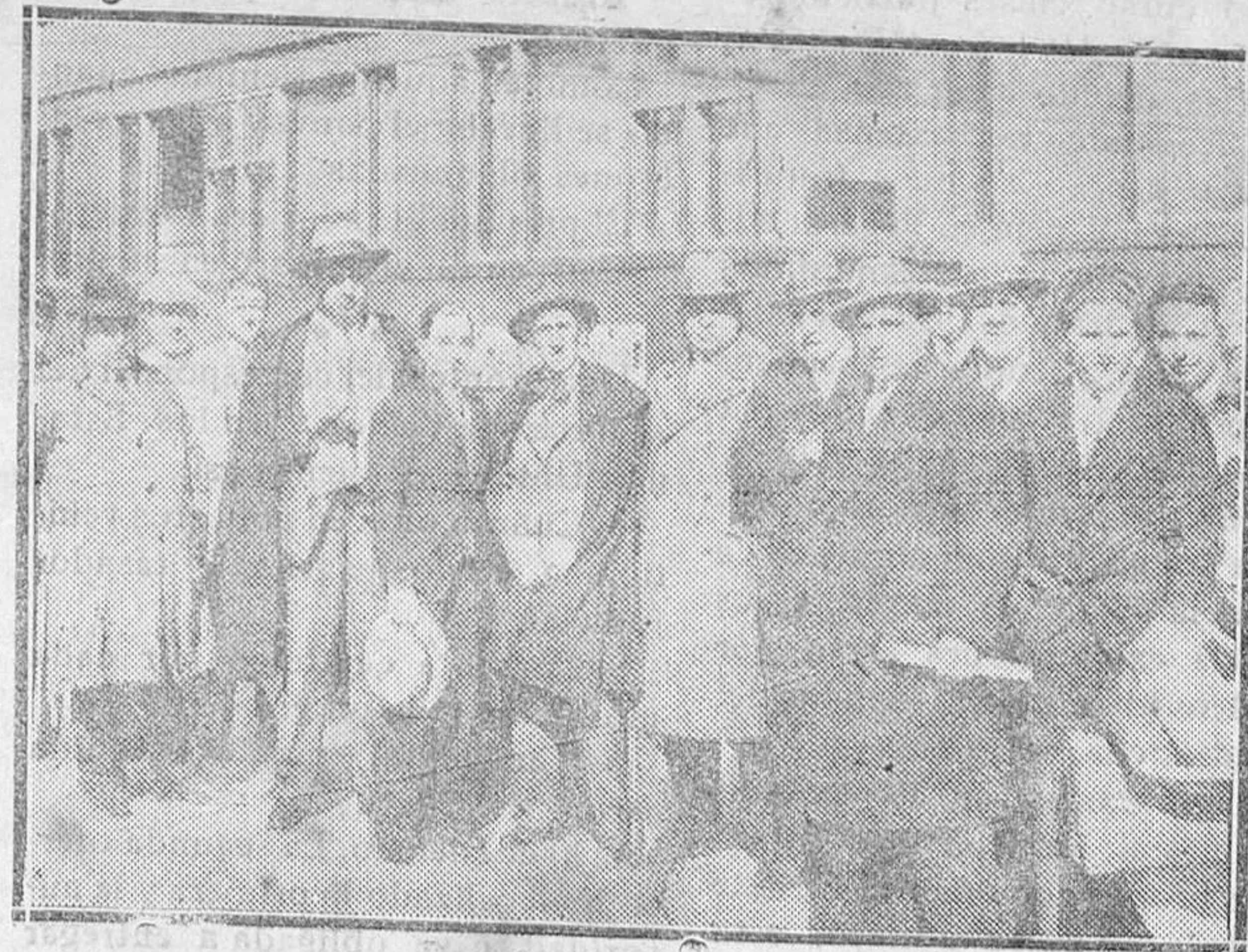
Llegada a Cádiz de una comisión de diputados y periodistas para esclarecer detalles de los pasados sucesos de Casas Viejas.