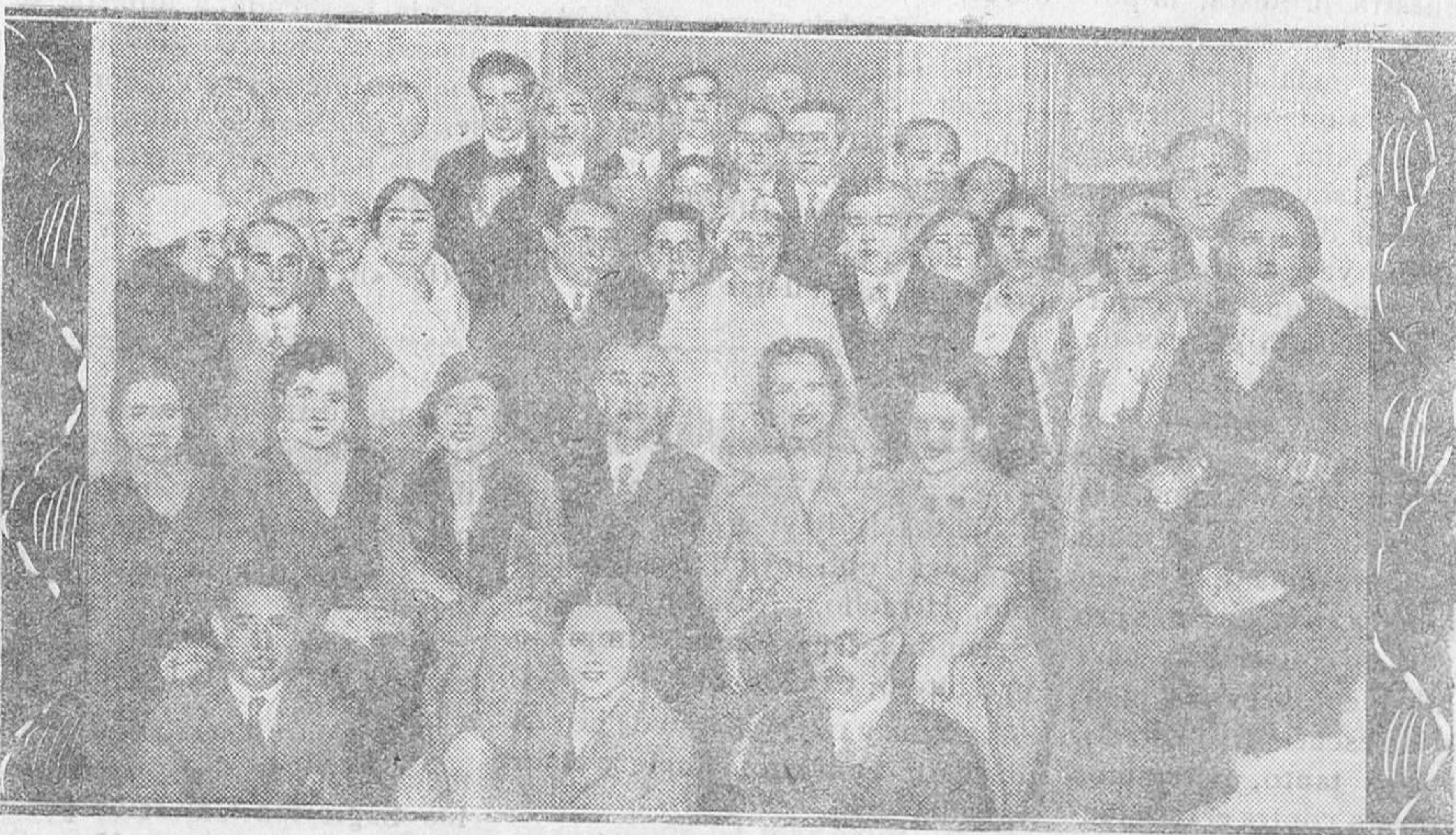
TOLEDO. — Durante la estancia de las bellezas regionales en Toledo, el Club Rosario de esta ciudad las obsequió con un té en el Hotel Castilla. He aquí a las «misses» después del acto.