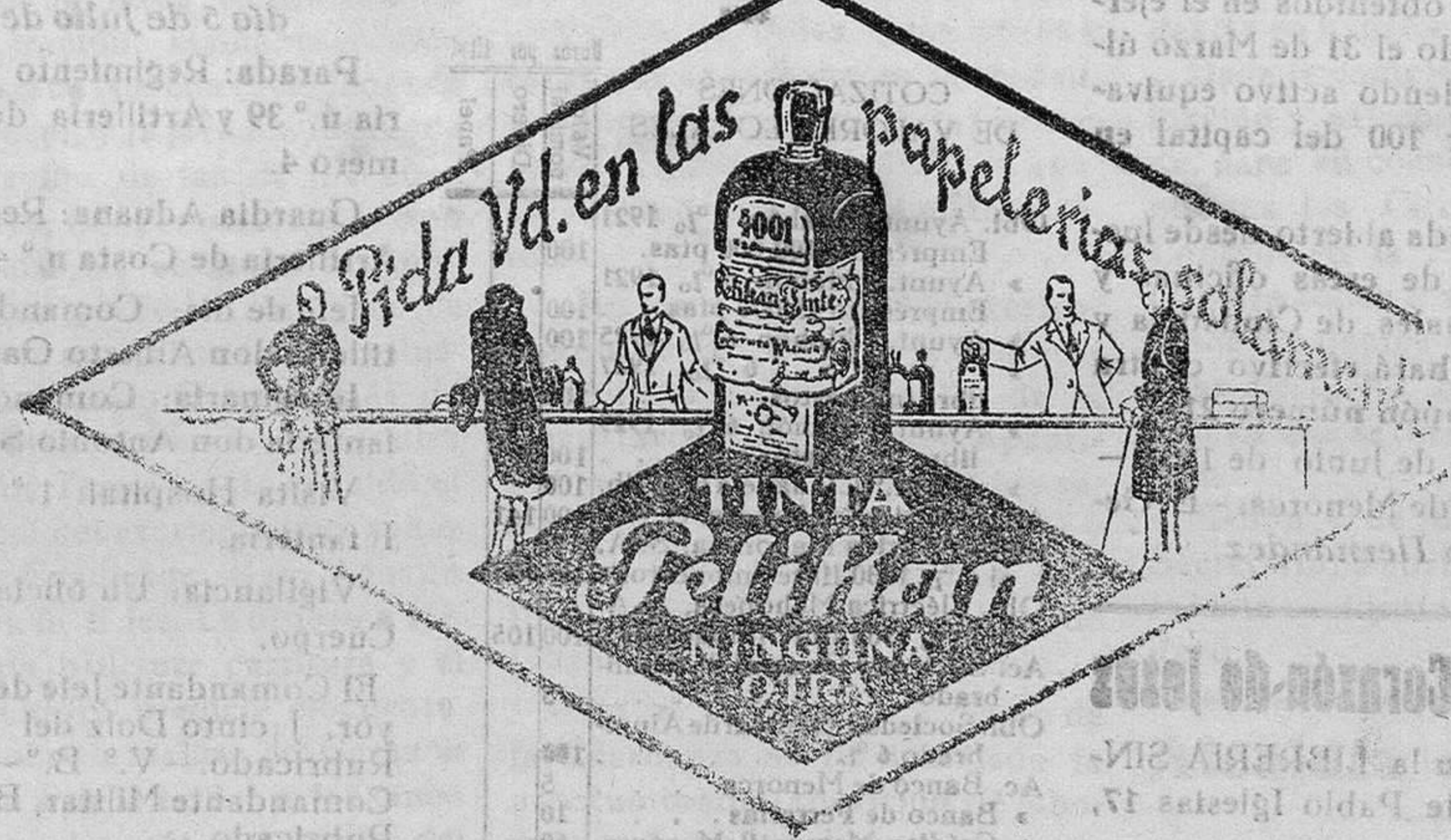
De venta en la Librería de Manuel Sintes Rotger, Plaza de Pablo Iglesias 17, Mahón

para la Inspección del Trabajo Cuadro de horario y fiestas del personal De venta en la Librería de Manuel Sintes Rotger, Plaza de Pablo Iglesias, número 17, Mahón