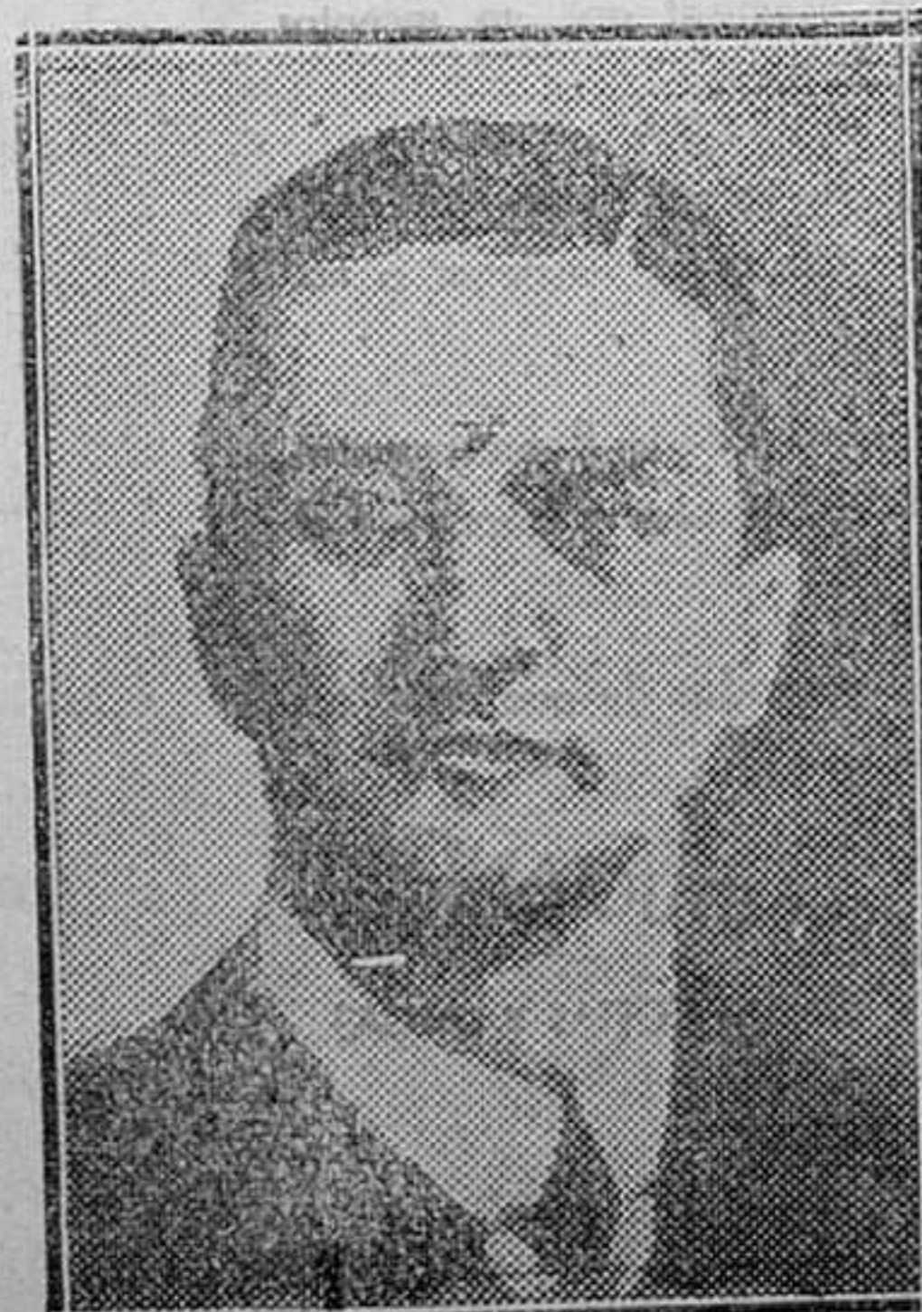
El almirante Nicolás Horthy, regente de Hungría