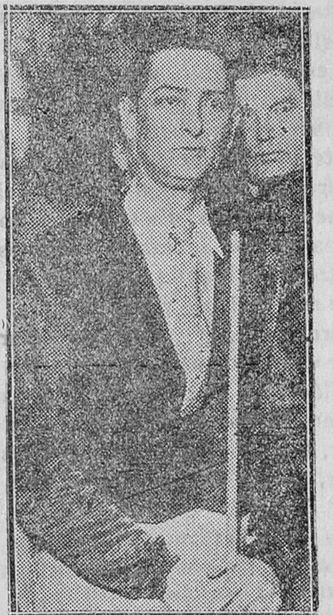
El español Claudio Pulgert, que ha quedado campeón del mundo de billar a tres bandas