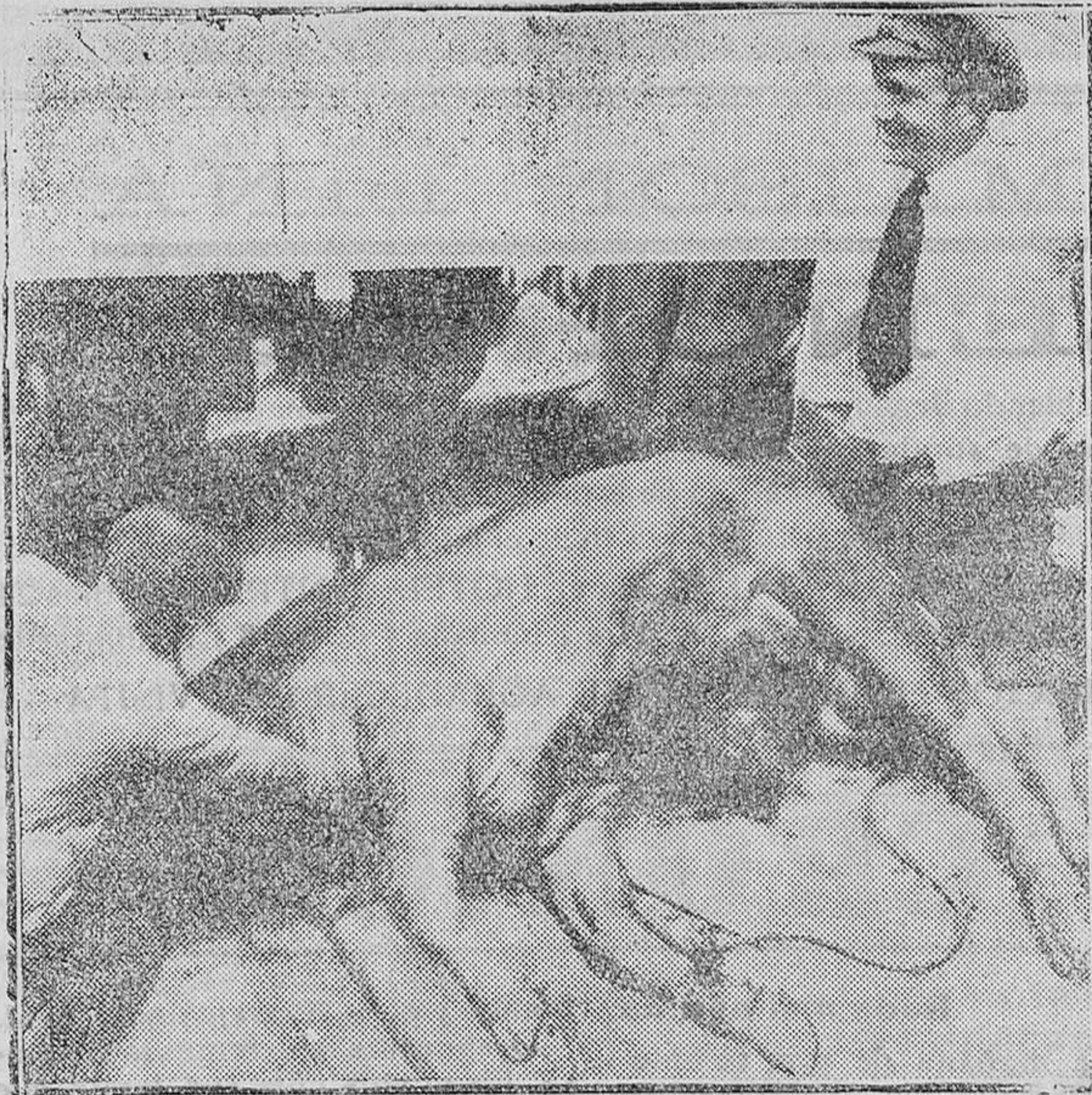
El toro que se desmandó en la calle Constantino Rodríguez, de Madrid, y fué muerto por el Guardia de Asalto que aparece en la fotografía