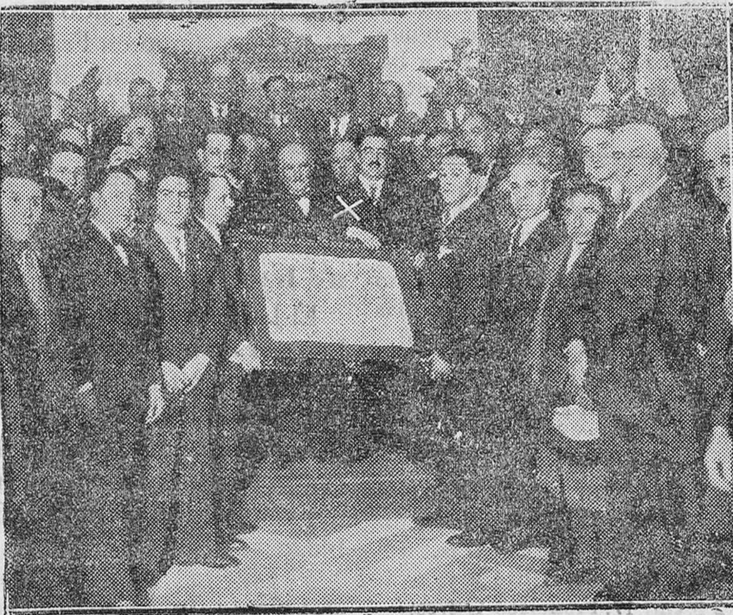
MADRID.—En la Facultad de Farmacia se ha verificado un homenaje al ministro de la Gobernación señor Salazar Alonso. Momento de hacerle entrega de un artístico pergamino