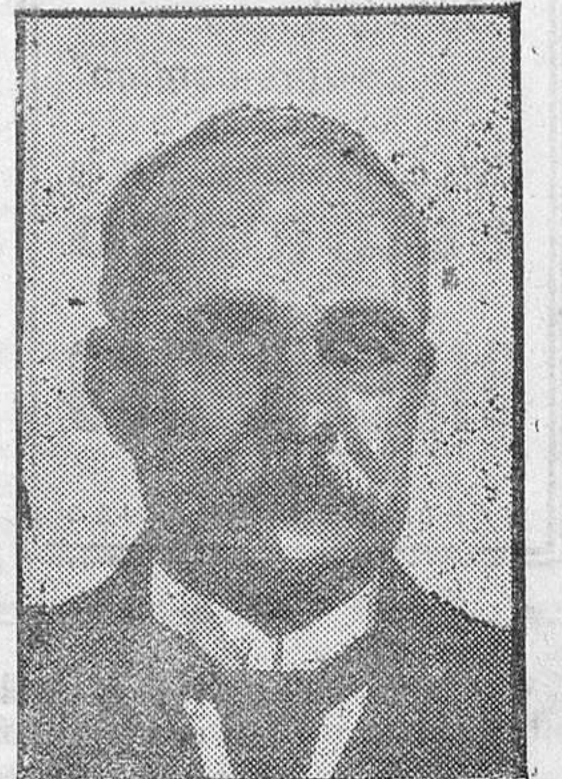
El conde de Caserta, que según las últimas noticias, ha sufrido una recaída en la enfermedad que pone en grave peligro su vida