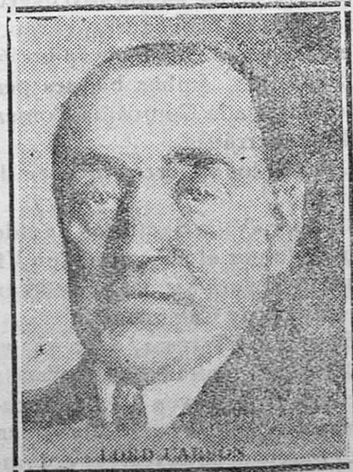
Lord Carson, célebre abogado y hombre político del Ulster, que se halla gravemente enfermo