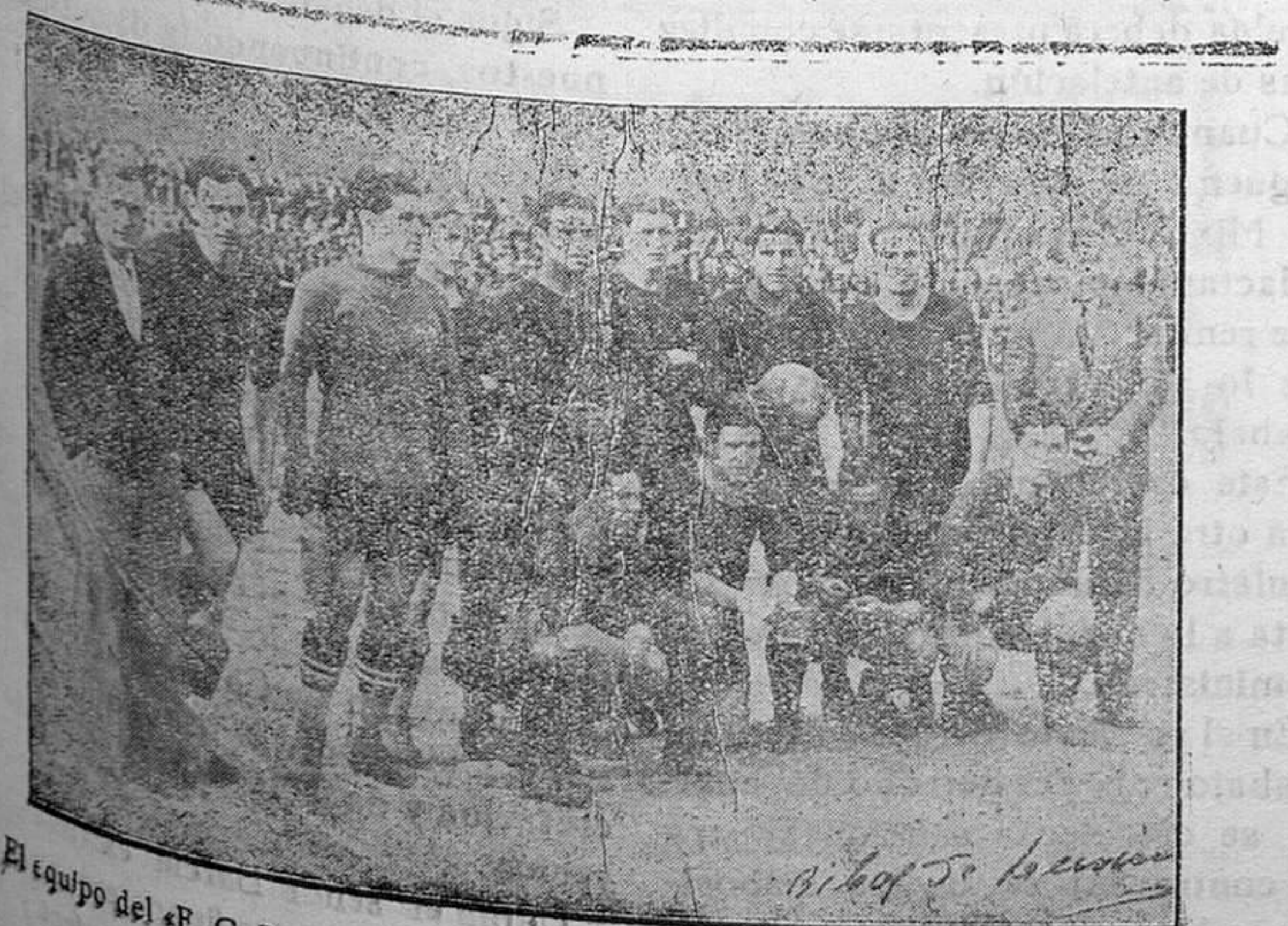
El equipo del «F. C. Barcelona» que actuó en Inca contra el campeón de Baleares

¿Cómo delindaremos, pues, la legítimidad o ilegitimidad de una huelga los que no hemos buceado