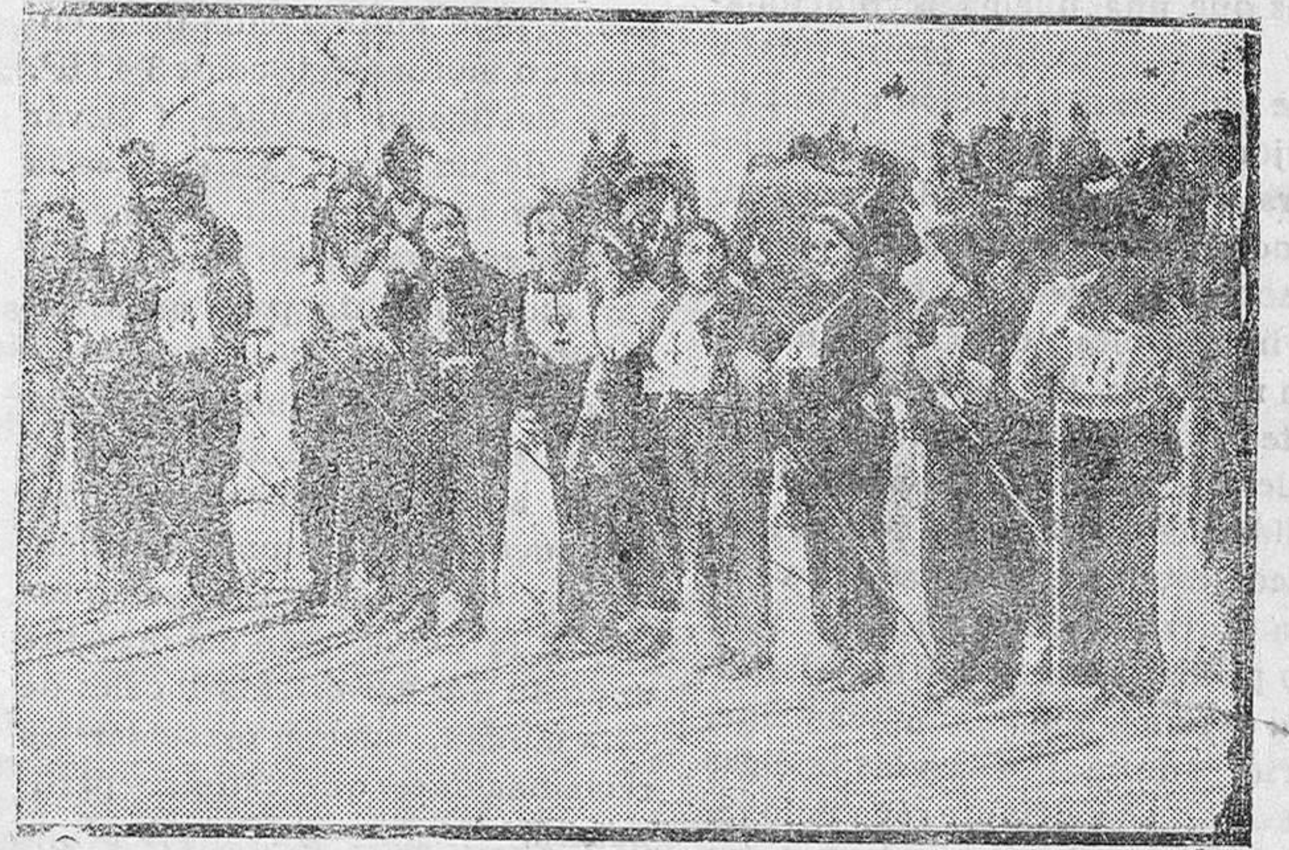
Una brillante representación de la mujer en los deportes de nieve