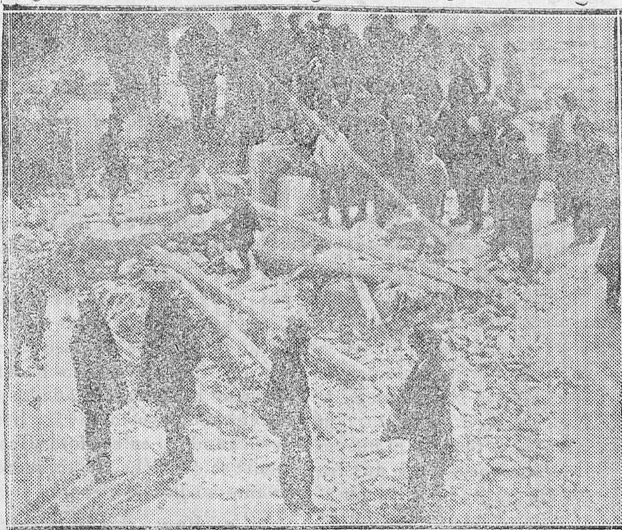
MADRID.—Aspecto que ofrecía el transformador en la calle del Parral (Guinda'era)