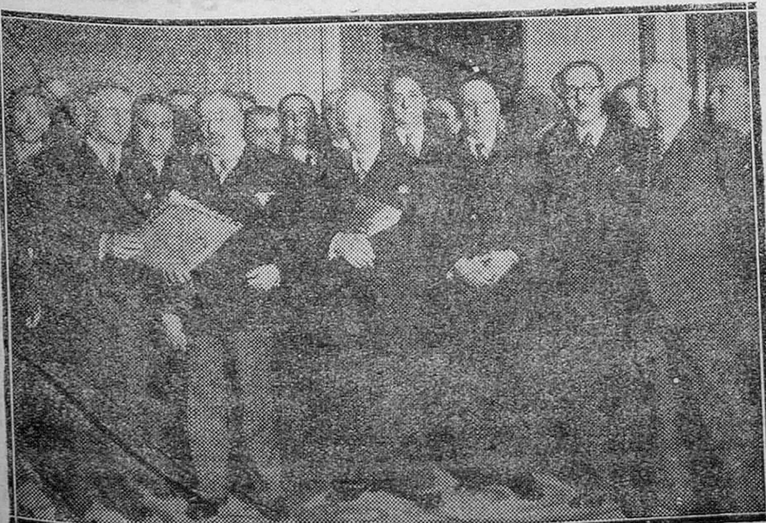
MADRID. — Entrega al Presidente de la Cámara del Estatuto Vasco, en presencia del Presidente del Consejo de Ministros

Los sueldos, haberes, gratificaciones y demás emolumentos que se hubiesen satisfecho sin acreditar dichos extremos, serán de cargo de los Ordenadores, Interventores de pagos, Gerentes o Administradores, según los casos. Los