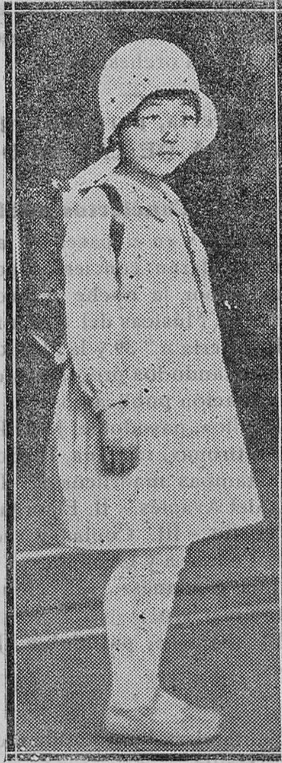
La Princesa Aerako, hija del Mikalo, retratada en el momento de ir por vez primera a la escuela en Tokio, llevando a la espalda la cartera con los libros