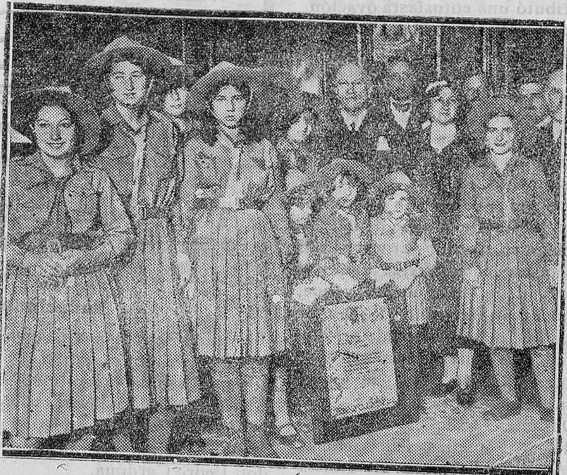
MADRID.—Las Legionarias de la Salud en el momento de entregar a don Alejandro Lerroux un pergamino nombrándole Presidente de Honor de dicha Sociedad