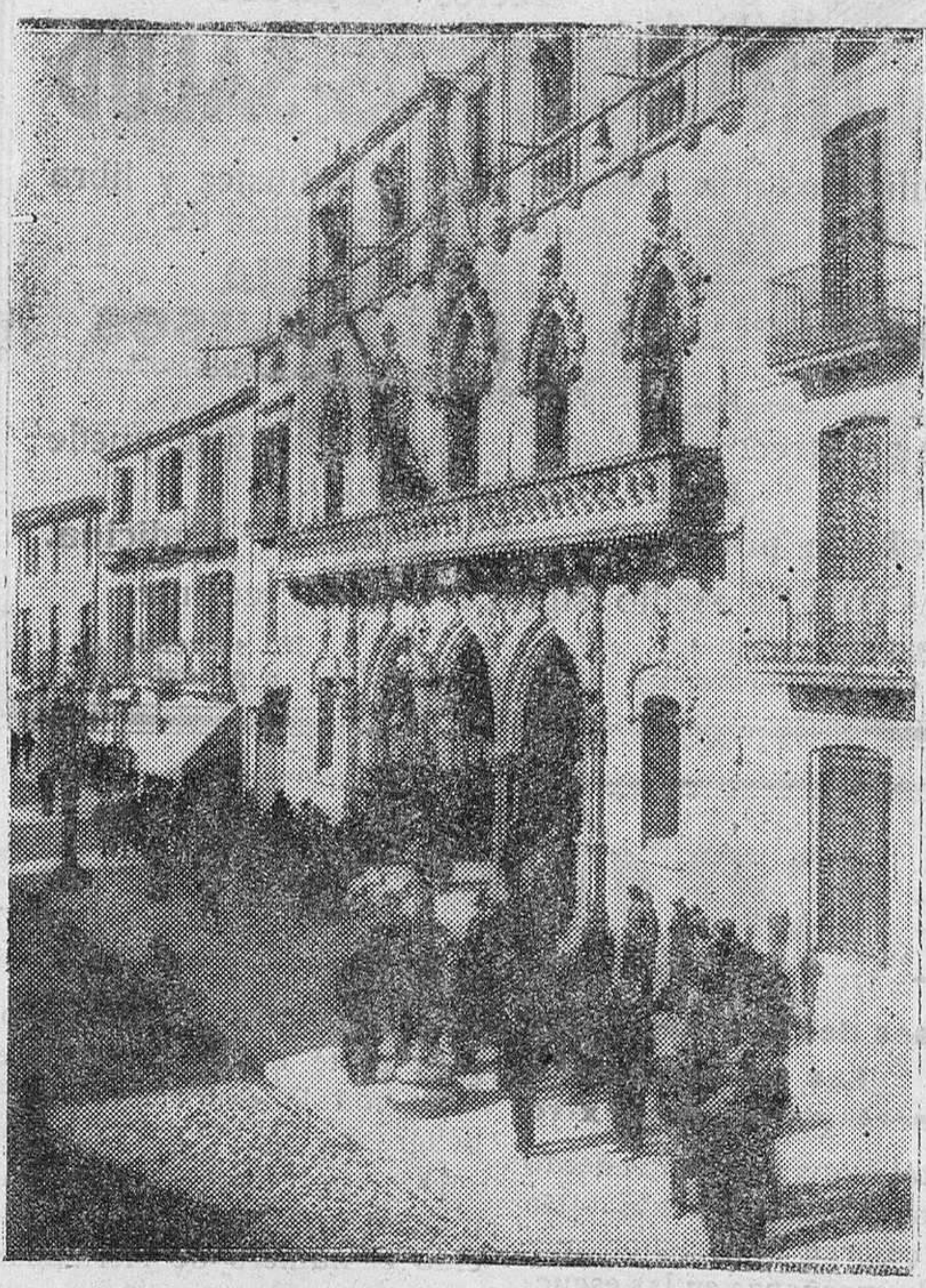
Fachada del Ayuntamiento de Tarrasa, en donde se desarrollaron los sucesos revolucionarios