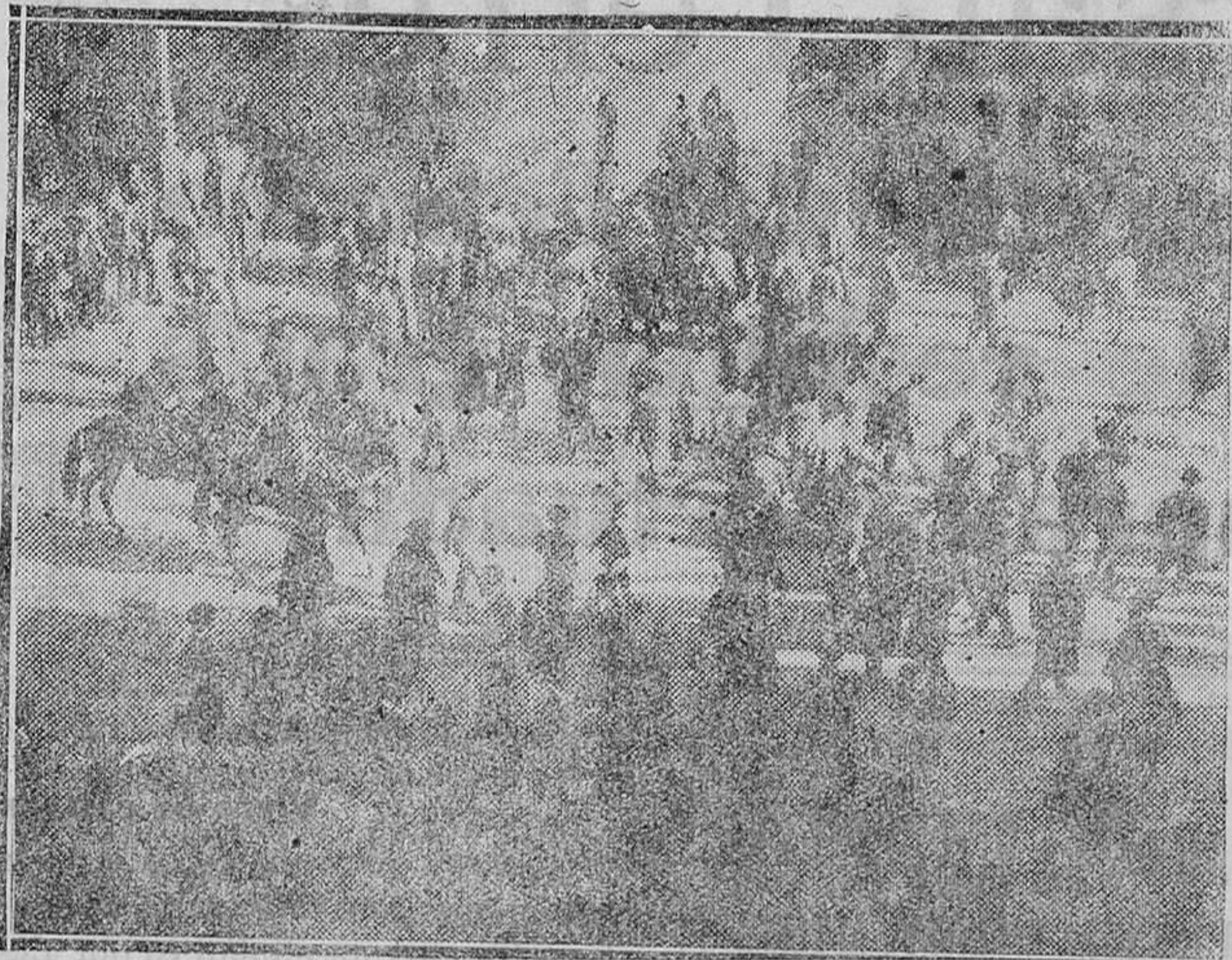
BILBAO.—A la salida de los elementos que tomaron parte en la Asamblea celebrada para tratar de constituir la Universidad Vasca, se produjeron manifestaciones hostiles contra el ministro de Obras Públicas don Indalecio Prieto y los diputados vasconavarros, teniendo que dar varias cargas la fuerza pública

Claro es que también es conveniente y prudentísimo que esta manifestación expresa de ser enteramente católico cristiano se haga en testamento, que todo el que pueda debiera hacer inmediatamente, si ya no lo tuviere hecho.