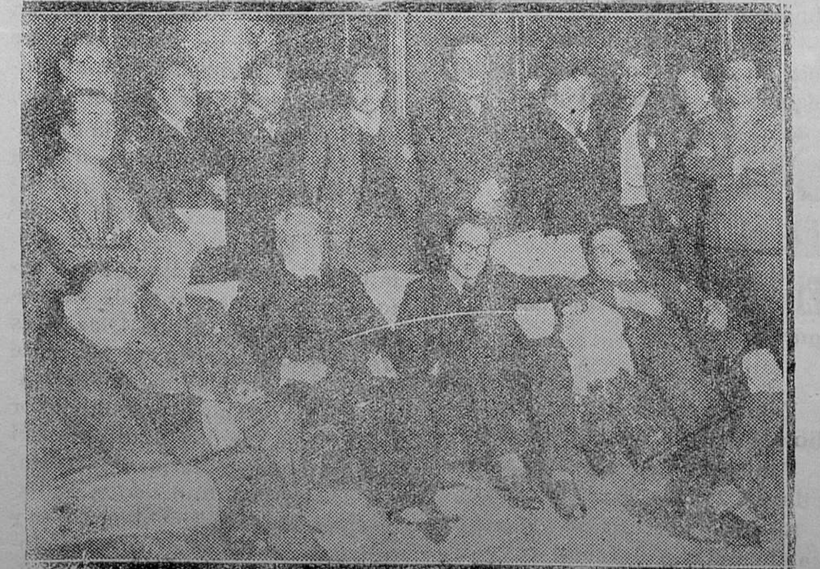
MADRID.—En el Ateneo.—Homenaje a la memoria de Joaquín Costa.—El señor Unamuno con los personajes que tomaron parte en el homenaje

Después de cuatro siglos el nombre de Erasmo representa un valor cultural, pero siempre aprovechado por todos los movimientos de oposición a la Iglesia y a las Ordenes Religiosas de enseñanza. Los judíos de todo el mundo lo consideran suyo y perpetúan su nombre en los centros docentes, como en Nueva York, en donde existe la «Erasmus High School» y de la cual la gran mayoría de alumnos son judíos. En la «Rotherdam High Scholl» aparecen esculpidos en la