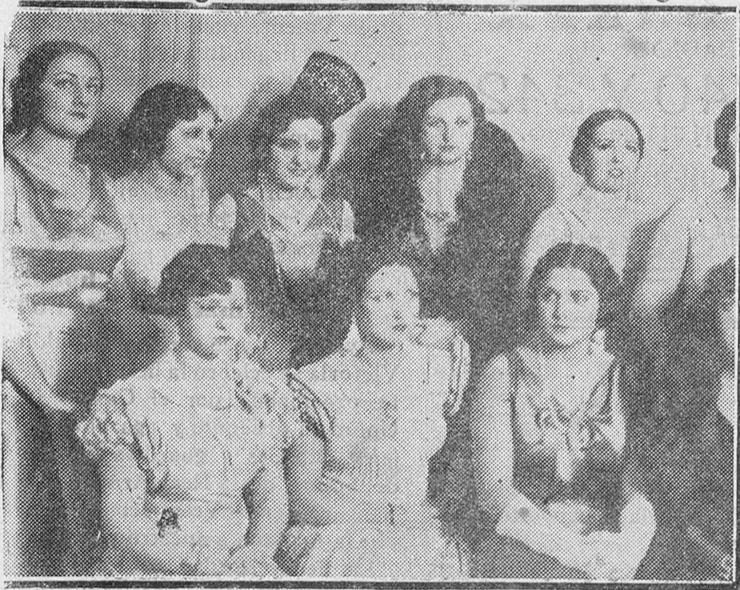
MADRID.—Las bellezas regionales que tomaron parte en la elección de «Señorita España», durante el festival de la Asociación de la Prensa, celebrada en el teatro Metropolitano