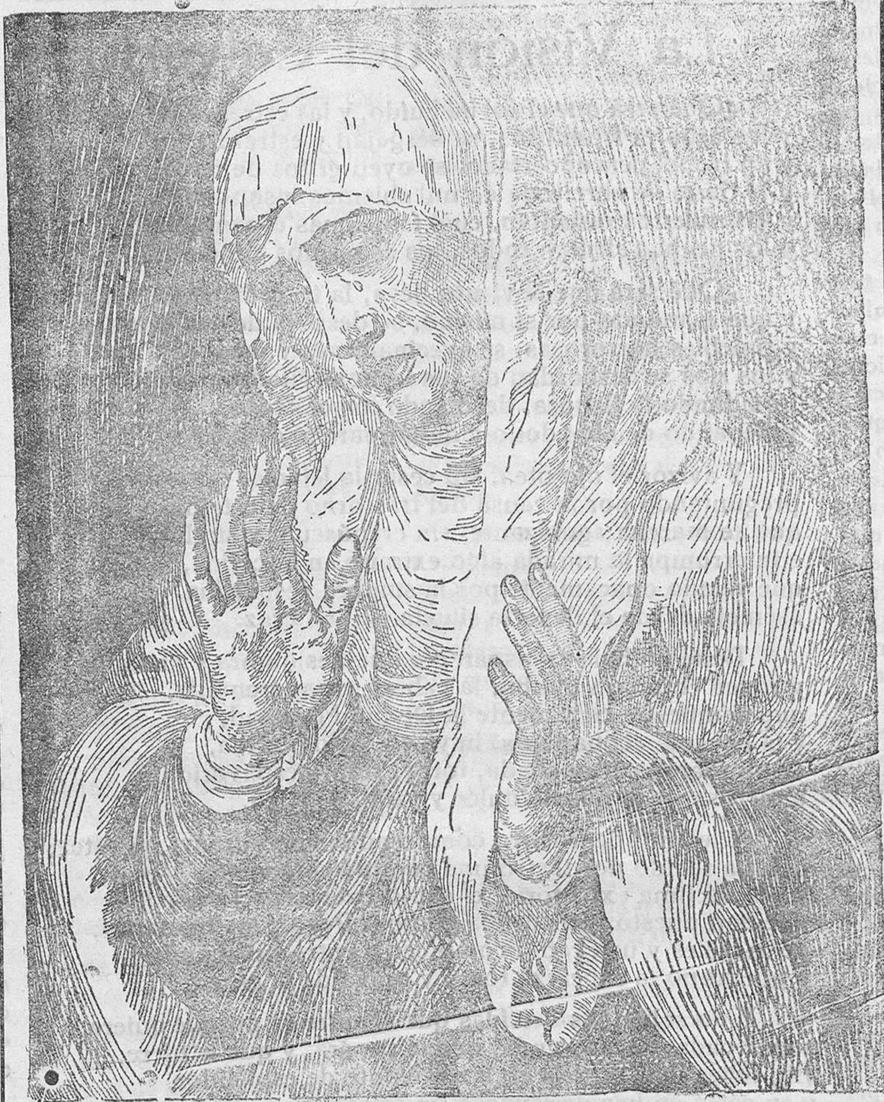
LA DOLOROSA DEL TIZIANO

Y su amor, su gran amor por los humildes, lo expresó Nuestro Señor Jesucristo al decir: «Venid a Mí todos los que estais cansados que yo os aliviaré.» «Tomad mi yugo y aprended de Mí que soy manso y humilde de corazón, porque mi yugo es suave y mi carga es ligera, como dijo a los ricos en severa amonición «¡Ay de vosotros los ricos que habeis ya recibido vuestra recompensa en la tierra! ¡Ay de vosotros los que estais hartos porque pasareis ham-