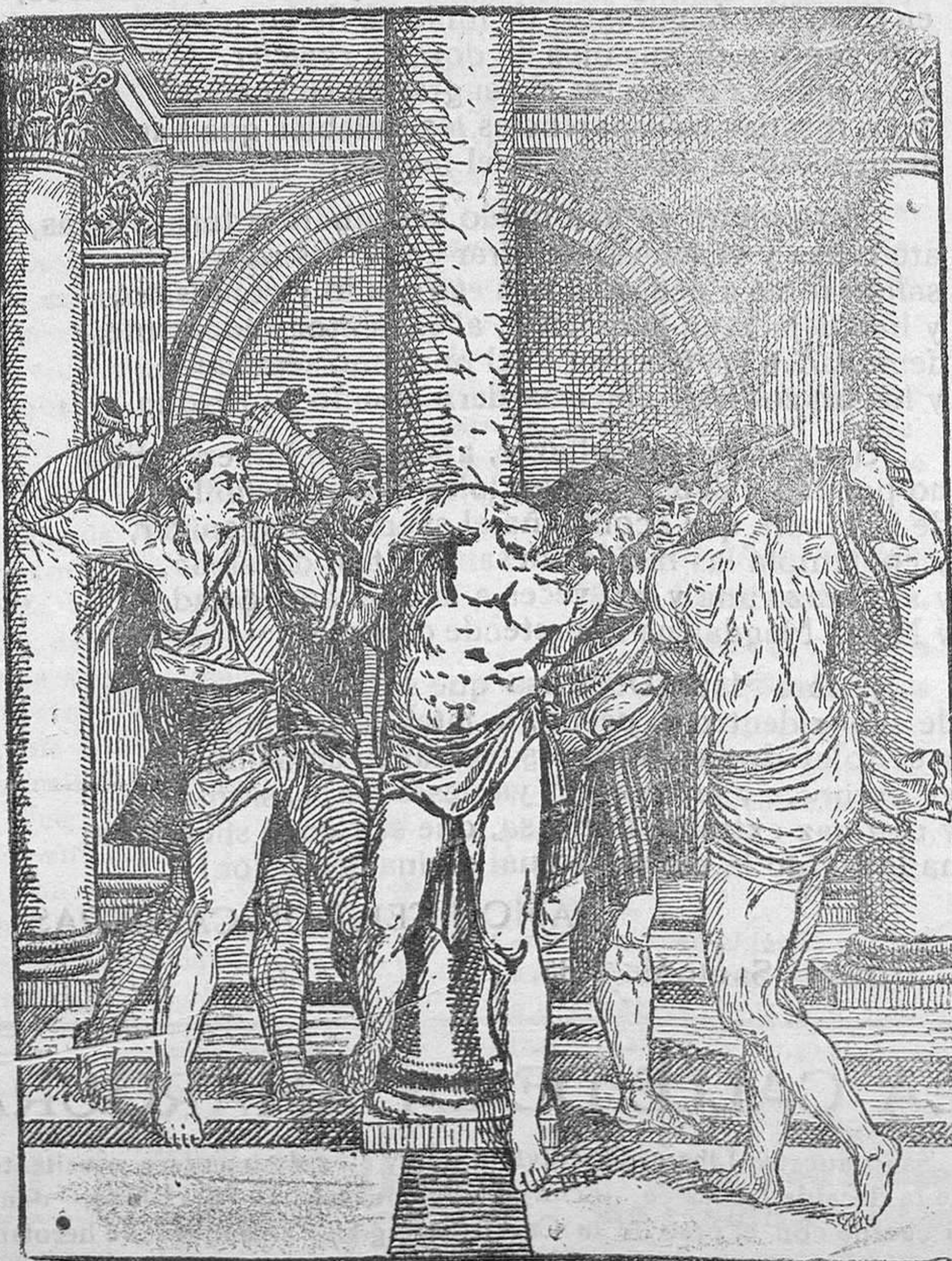
LA FLAGELACION DE JESÚS

(Cuadro de Miguel Ángel existente en las Salas Capitulares del Monasterio de El Escorial)