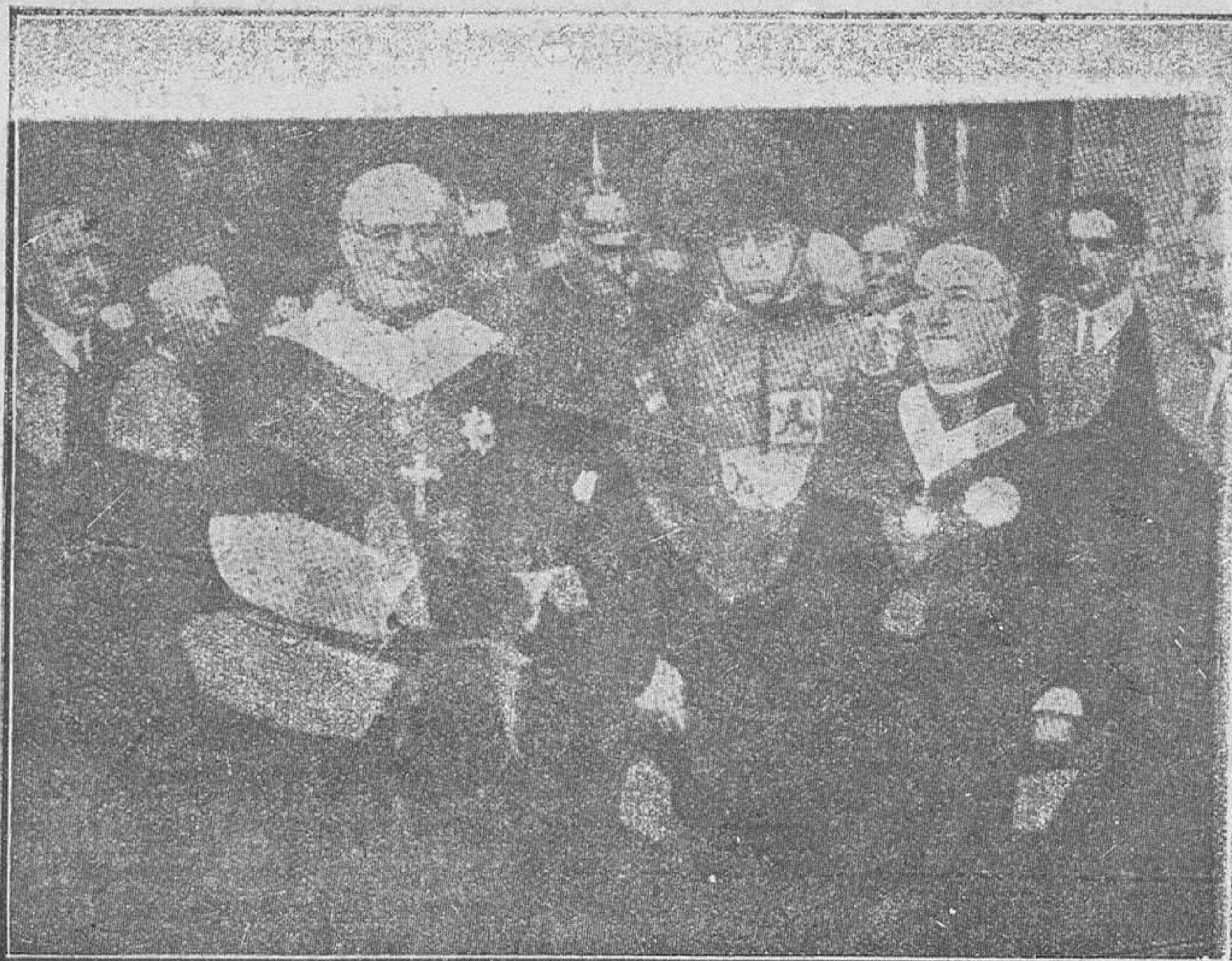
El Arzobispo de Sevilla Dr. Eustaquio Illundain, a su llegada de Roma, donde recibió el capelo cardenalicio de manos de Su Santidad el Papa