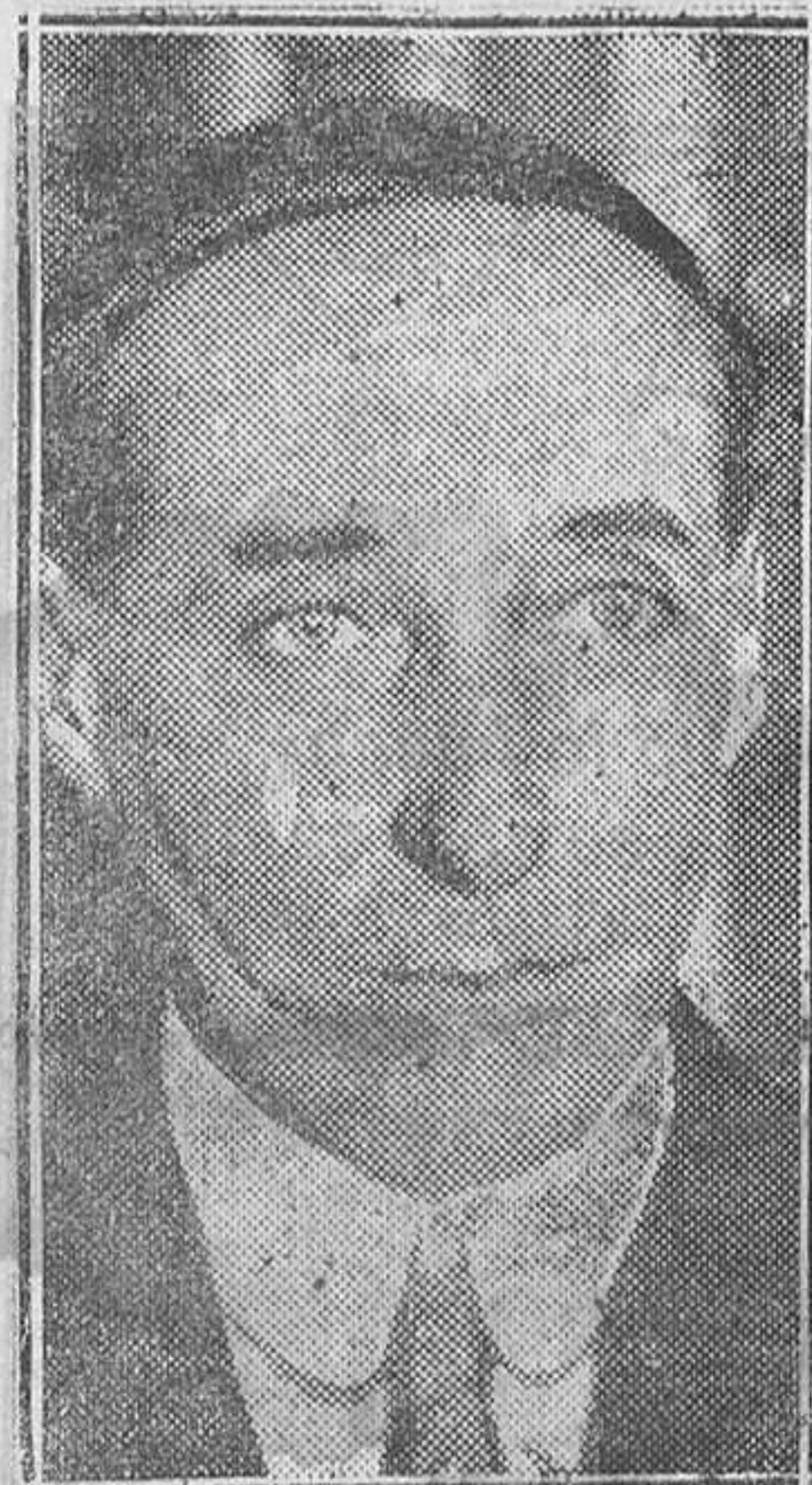
MADRID. — El nuevo ministro de Suiza en Madrid, señor Charles Egger, que presentó sus cartas credenciales al Presidente de la República

Dominica vacante.—La Natividad de Nuestro Señor Jesucristo. Después de cantados los tres noc-