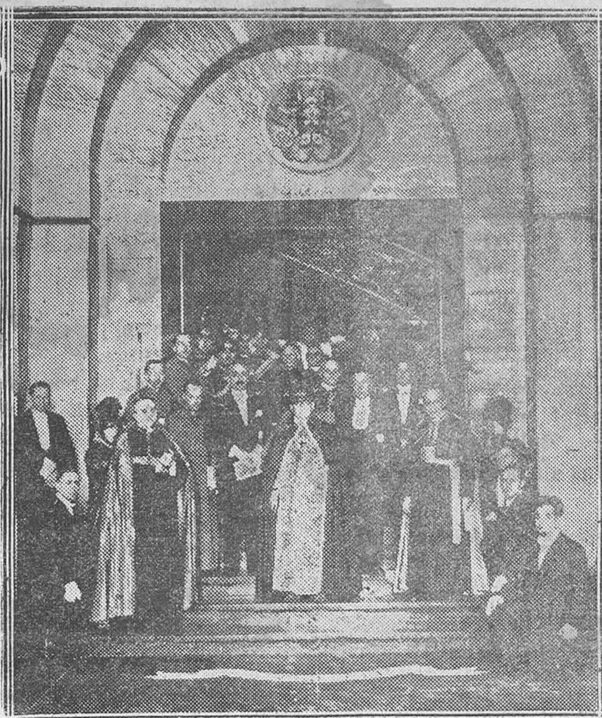
ROMA. — Con imponente solemnidad han sido inaugurados por Su Santidad Pío XI los nuevos Museos del Vaticano. Momento de salir el Papa de dicho edificio