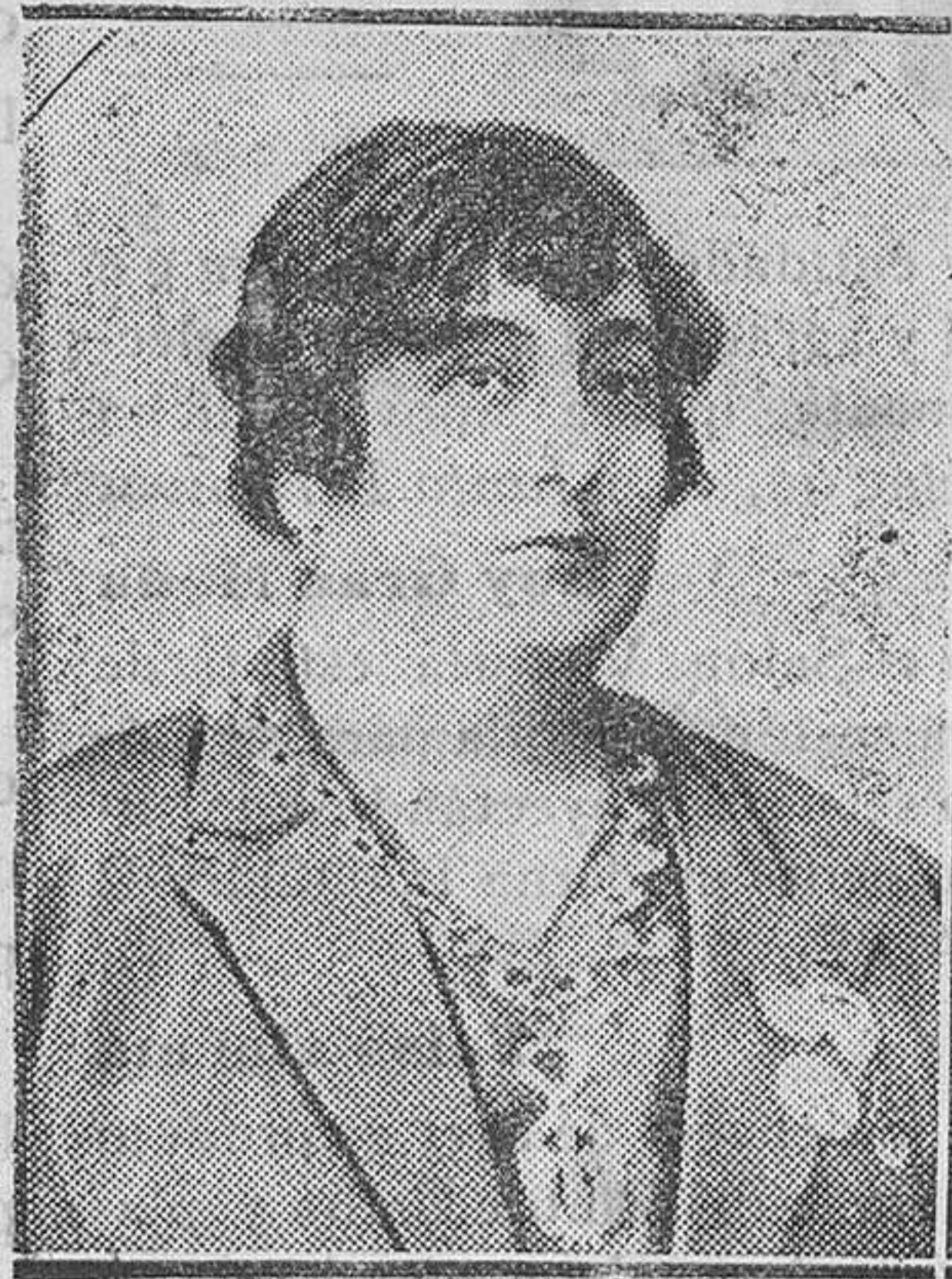
Ha fallecido recientemente en Madrid la ilustre escritora doña Carmen de Burgos

SAN PEDRO DE ALCANTARA. —Nació en Alcántara y estudió derecho canónico en Salamanca; muerto su padre, se retiró al convento de Manlarez: sobrio, penitente, fervoroso, fué el ejemplo de to-