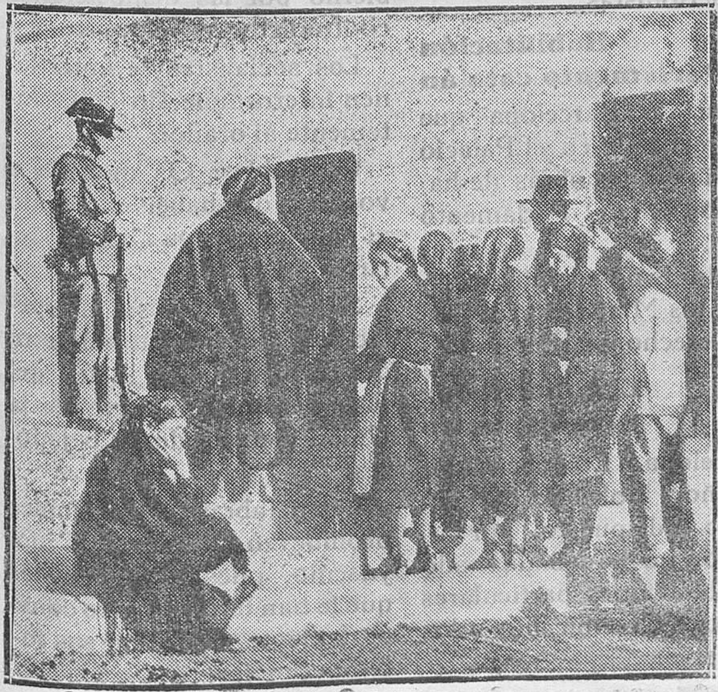
LOS GRAVES SUCESOS DE LOS MOLINOS DE MAHÓN. —Los revolucionarios acorralaron y desarmaron a cuatro guardias civiles, a los que dejaron heridos. En a foto los familiares de los dos detenidos

—Después de breve enfermedad y confortado con la devota recep-