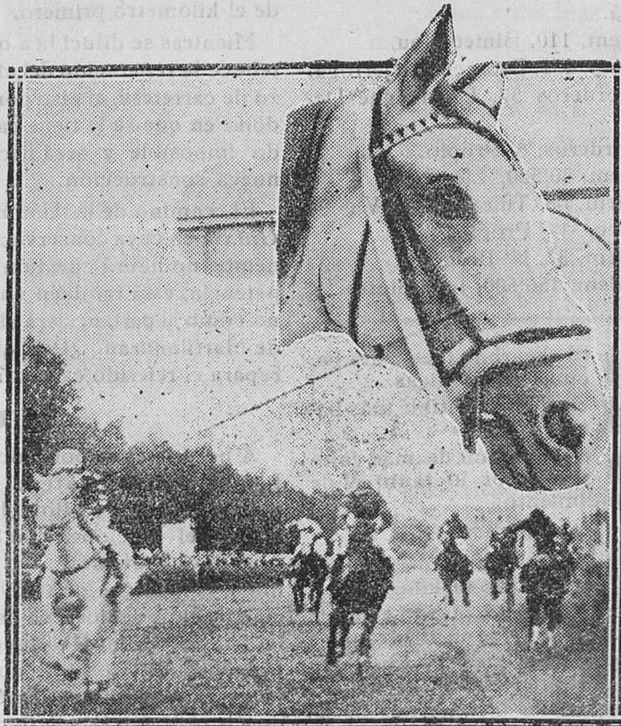
EL GRAN PREMIO MADRID.—«Atlántida», la formidable yegua ganadora de la carrera. Llegada a la meta

Véndese en la Librería de Manuel Sintet Rotger, plaza de Pablos Iglesias 17, Mahón.