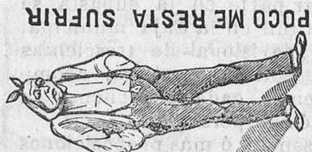
HE MANDADO POR AIBAF