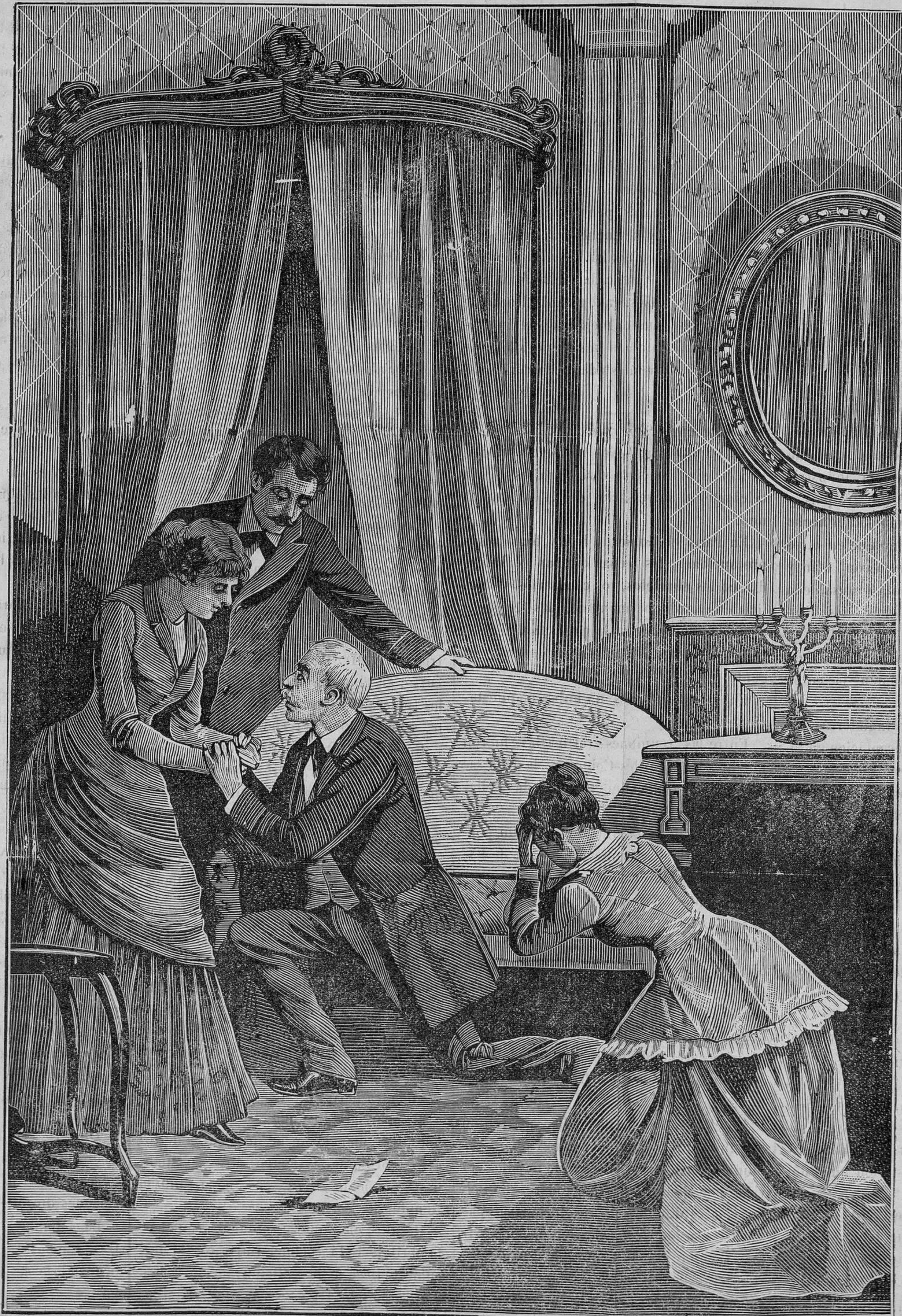
ESCENA FINAL DEL DRAMA «DE MALA RAZA»

Suponed un niño engendrado por un monstruo de perversion y concebido por un monstruo de maldad. Antes que sus sentidos estén en disposicion de transmitir impresiones á su alma, apartadlo de sus padres,