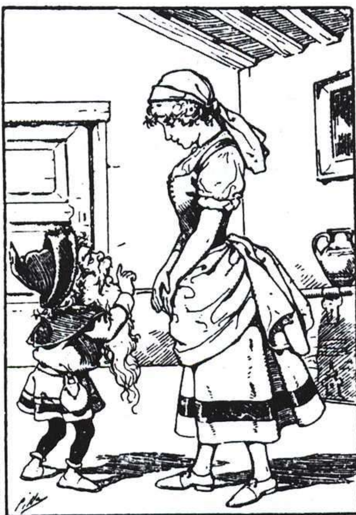
S. CALLEJA, CUENTOS DE SIEMPRE, J. J. DE OLANETA, 1992.

El Grupo de Trabajo Lee.con, del Centro de Profesores de Almería, se propuso seguir el rastro de las mujeres protagonistas de los cuentos populares españoles, y destacar aquellos que muestran una imagen de la mujer que no es la más tradicional, aquellos en los que aparecen como heroínas valerosas y decididas. Fue una investigación compartida en el aula, con los alumnos, que realizaron varias actividades relacionadas con el tema, entre ellas, una exposición de dibujos.