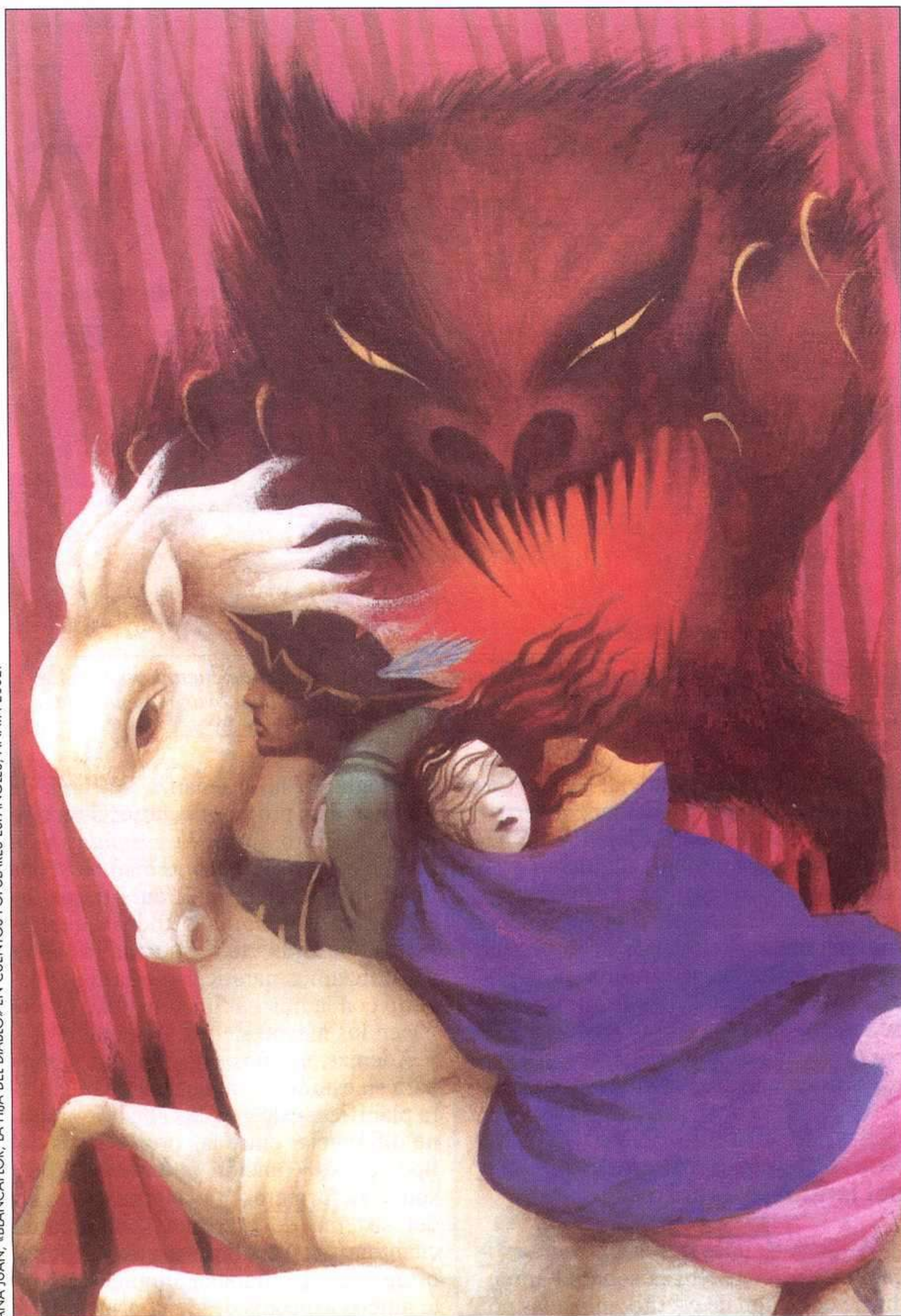
ANA JUAN. «BLANCAFLOR, LA HIJA DEL DIABLO» EN CUENTOS POPULARES ESPAÑOLES, ANAYA 2002.

diferentes versiones de un mismo cuento» o «Cuentos a través de un personaje», también propuestas por Myriam Nemirovsky con las que hemos disfrutado muchísimo.