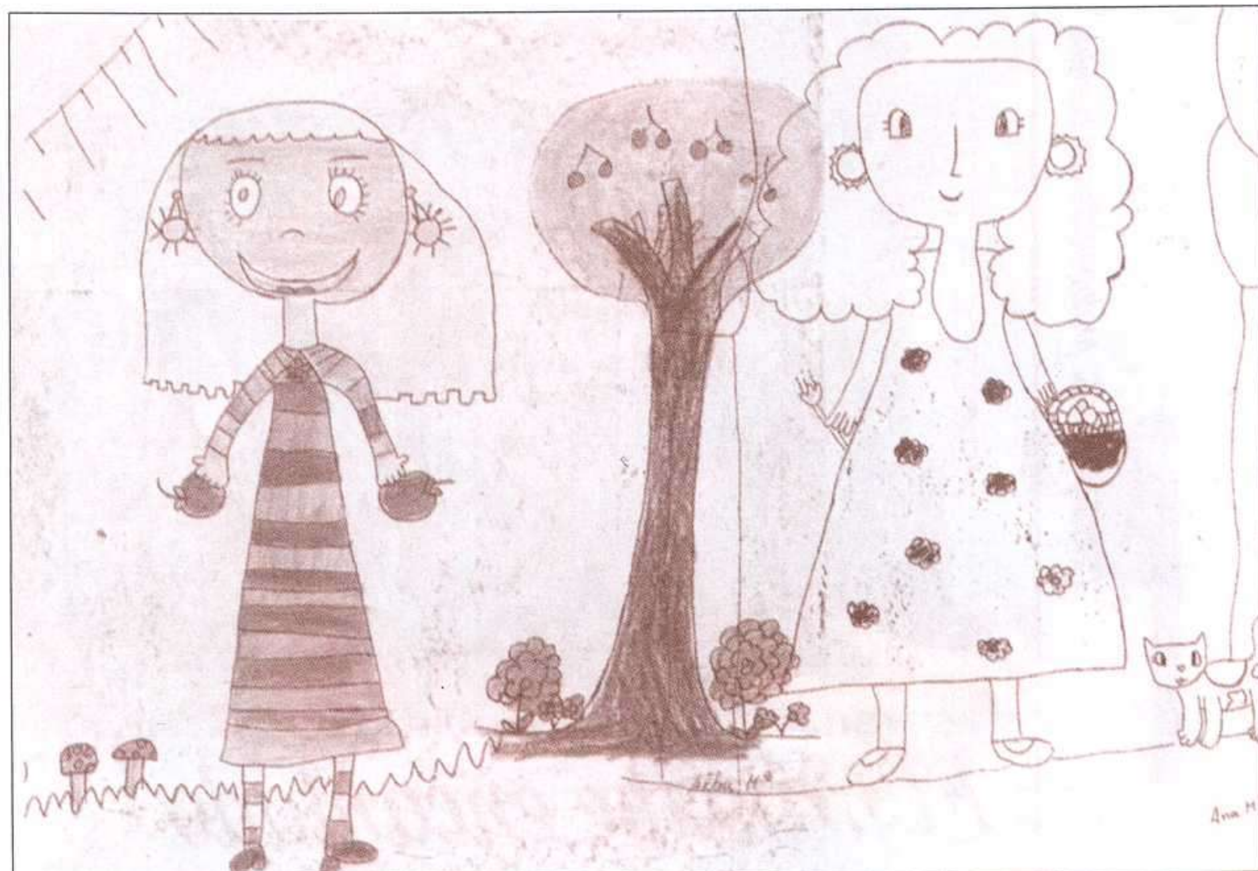
Uno de los dibujos de la exposición «Las mujeres: protagonistas de cuentos» sobre La niña que salió de un huevo, adaptado por Antonio Rodríguez Almodóvar ( Cuentos de la Media Lunita , de Algaida).

Para nuestra labor hemos manejado los cuentos recogidos por Antonio Ro-