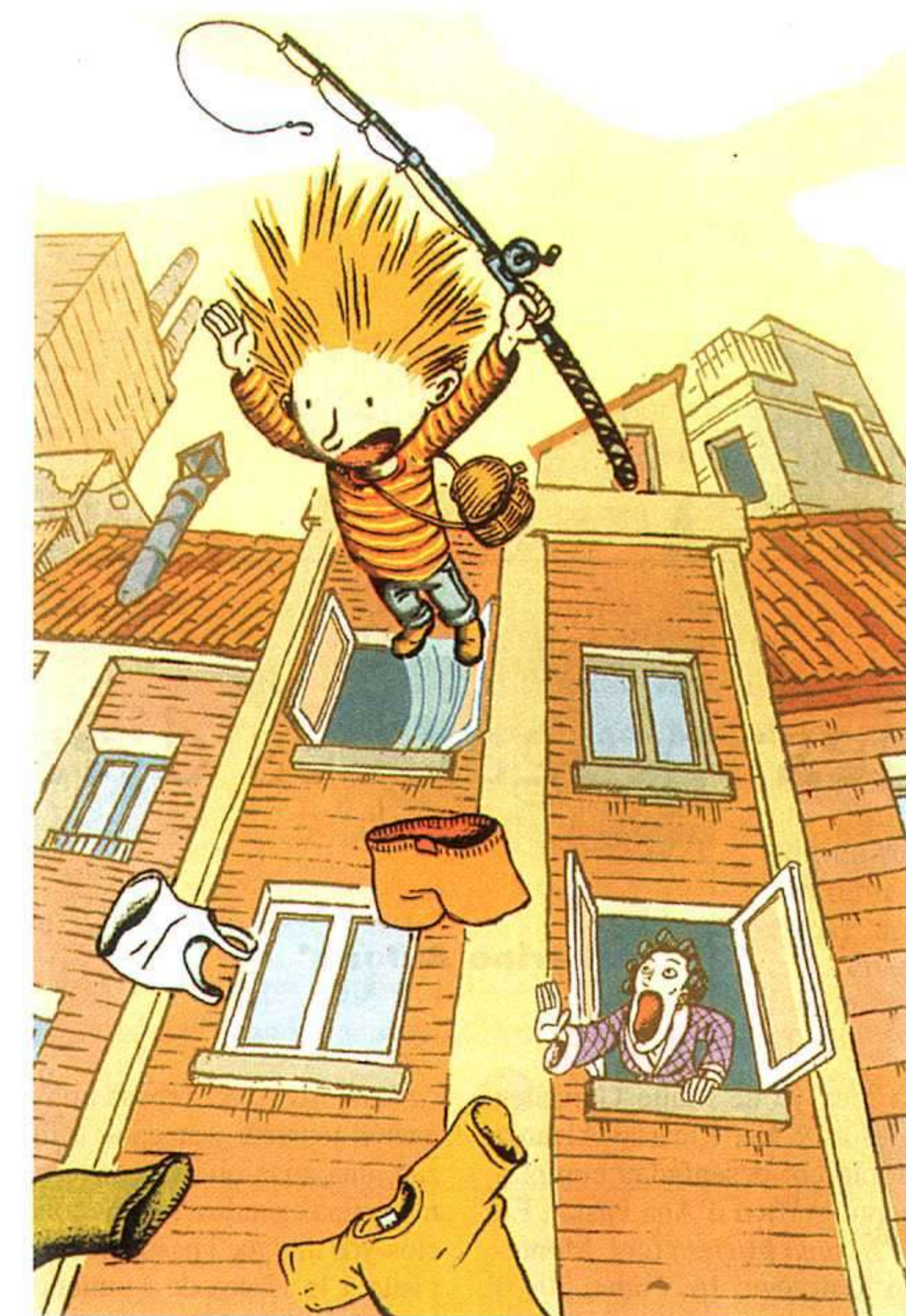
GERMÁN TEJERINA, LES AVENTURES DE XICU Y VENTOLÍN, TRABE, 2002.

La poesía popular ta representada nesta ocasión por una edición bilingüe de les cosadielles