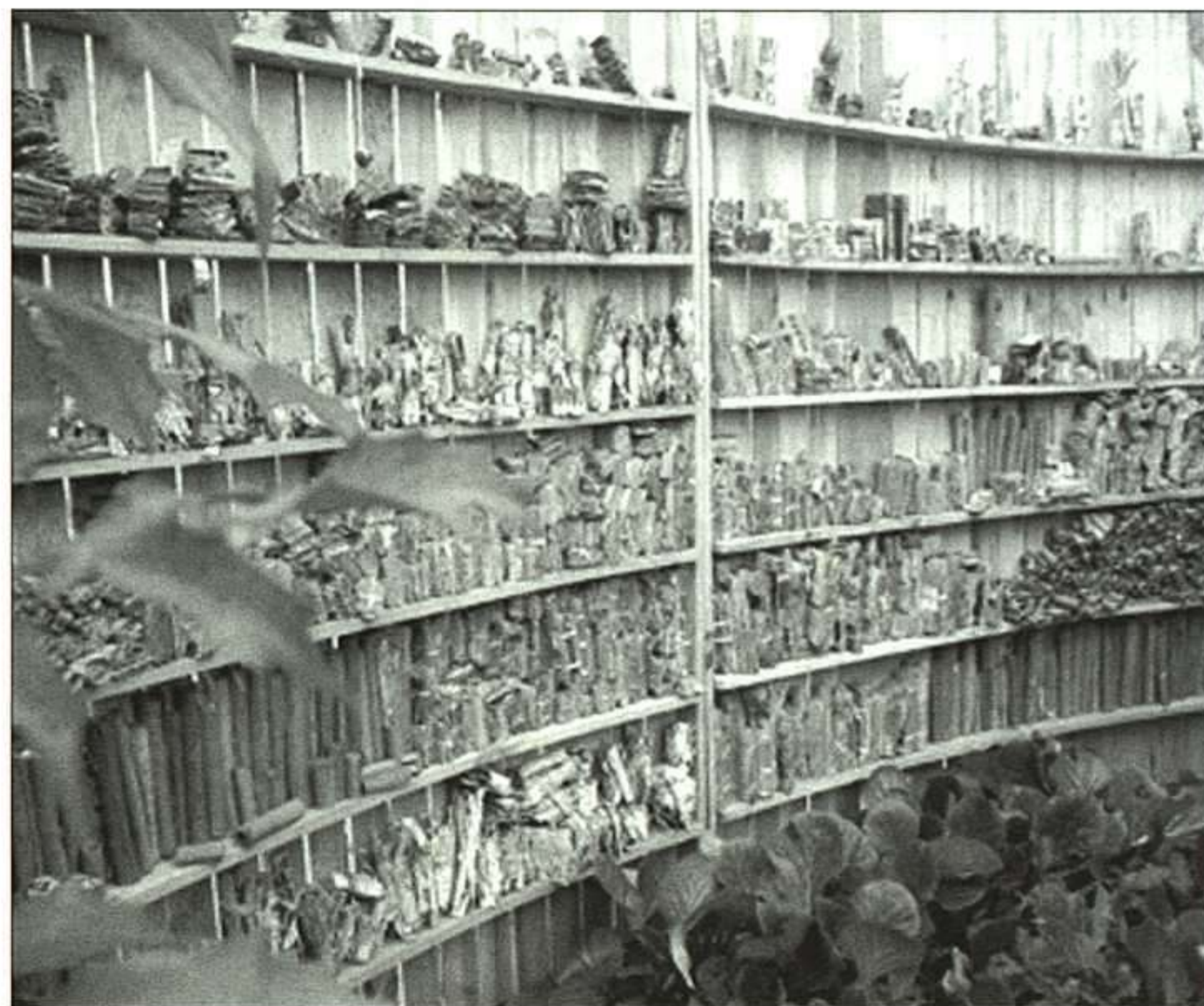
Otra fotografía de la exposición «Biblioteca de cuerdas y nudos».

ciendo para ser, ahora, otra cosa... y que aún permanece.