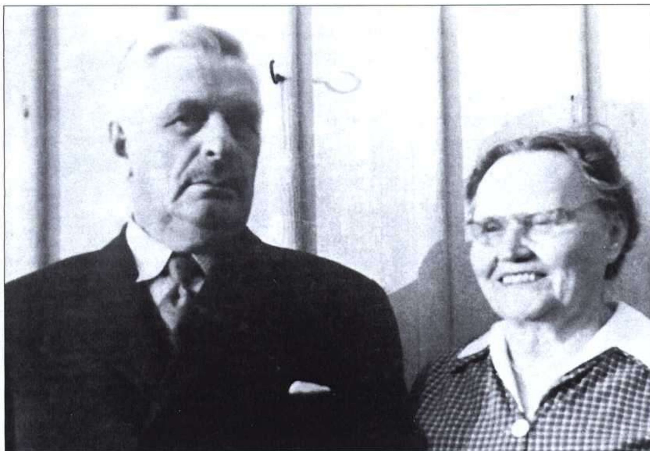
Los padres de la escritora. Al lado, un sello con la imagen de Astrid Lindgren, toda una celebridad en su país.