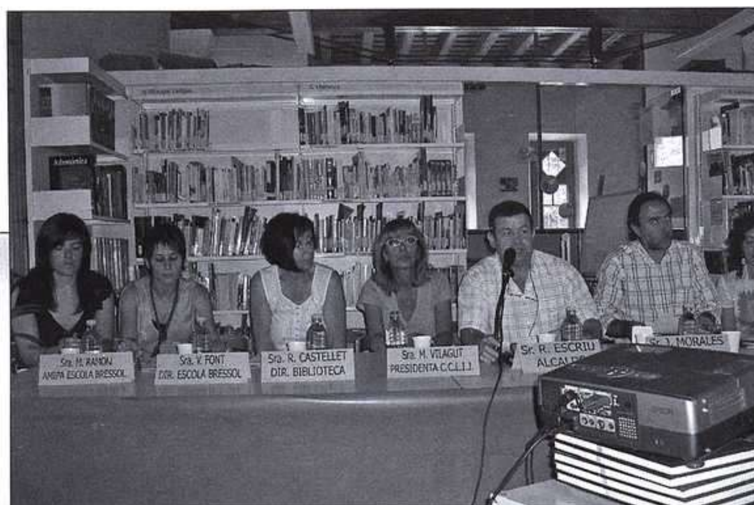
Representantes de los diferentes estamentos implicados en el proyecto Municipi Lector de El Bruc , que integran el Consell de Lectura . Al lado, una imagen del Quadern Lector ; y abajo, una de las actividades organizadas: una gincana familiar .