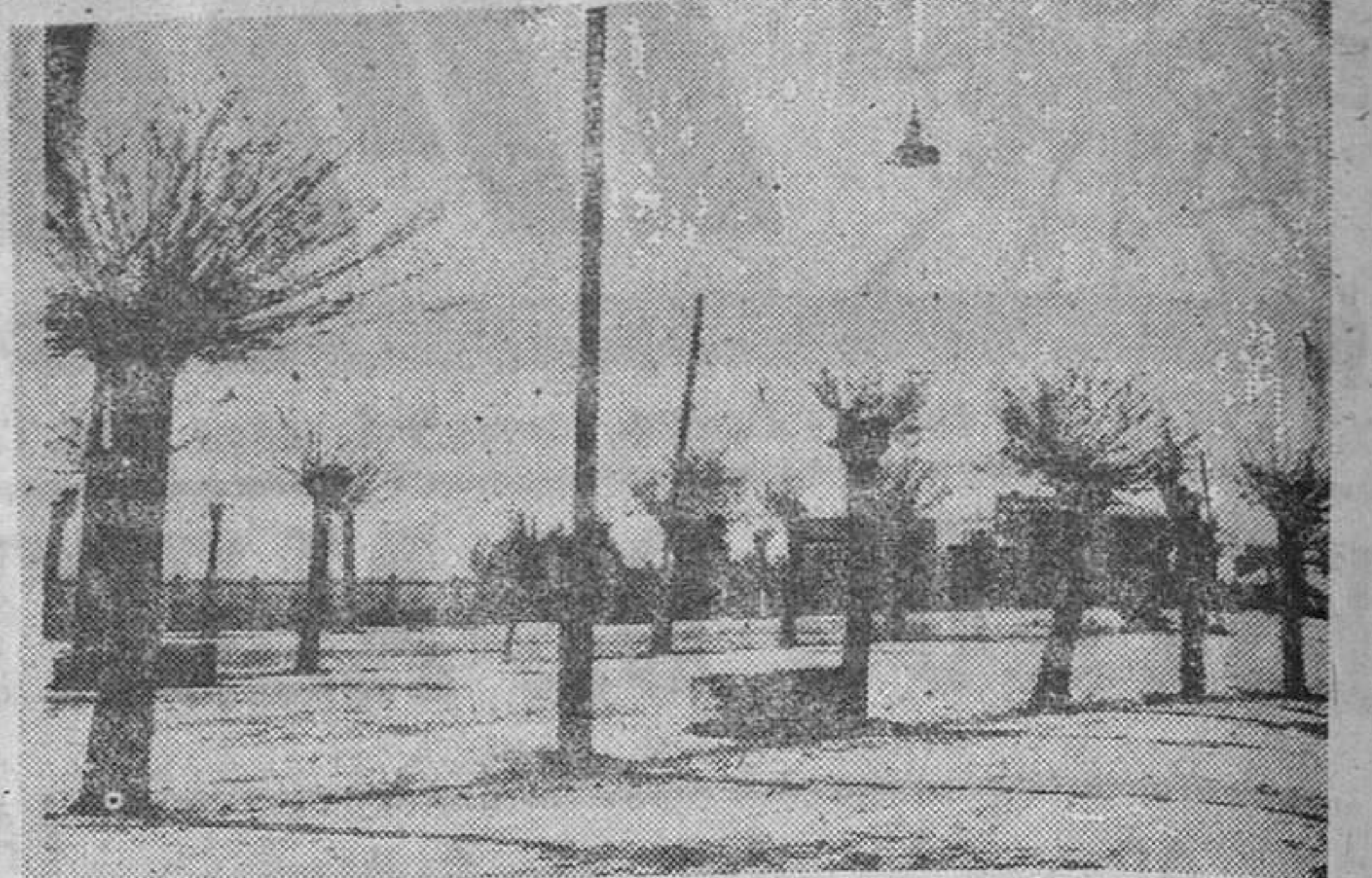
NO HAN EMPEZADO LAS OBRAS. — La Mota Vieja sola y sin empezar las obras... Sin esas obras que iban a convertir un sueño en realidad... "EL PARQUE INFANTIL"... Querían que este sueño, a estas alturas, estuviera terminado... ¿Qué ha pasado?... — J. V. A. B.

IV EPOCA. — Número 1.032 Jueves, 9 de mayo de 1963