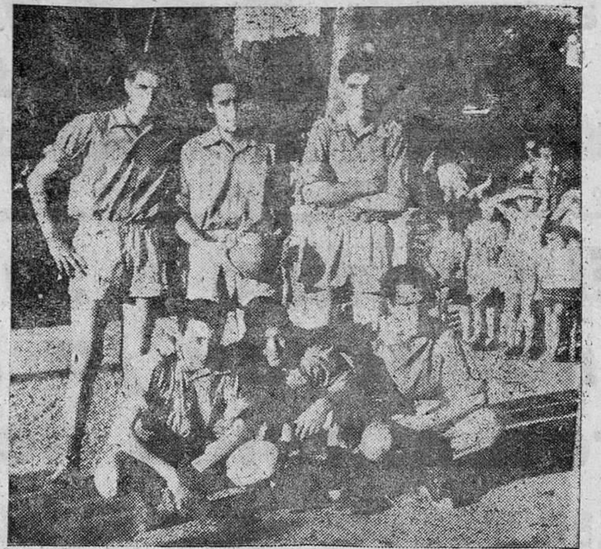
EQUIPO CAMPEON DE BALON-VOLEA.—(Foto Jesús).