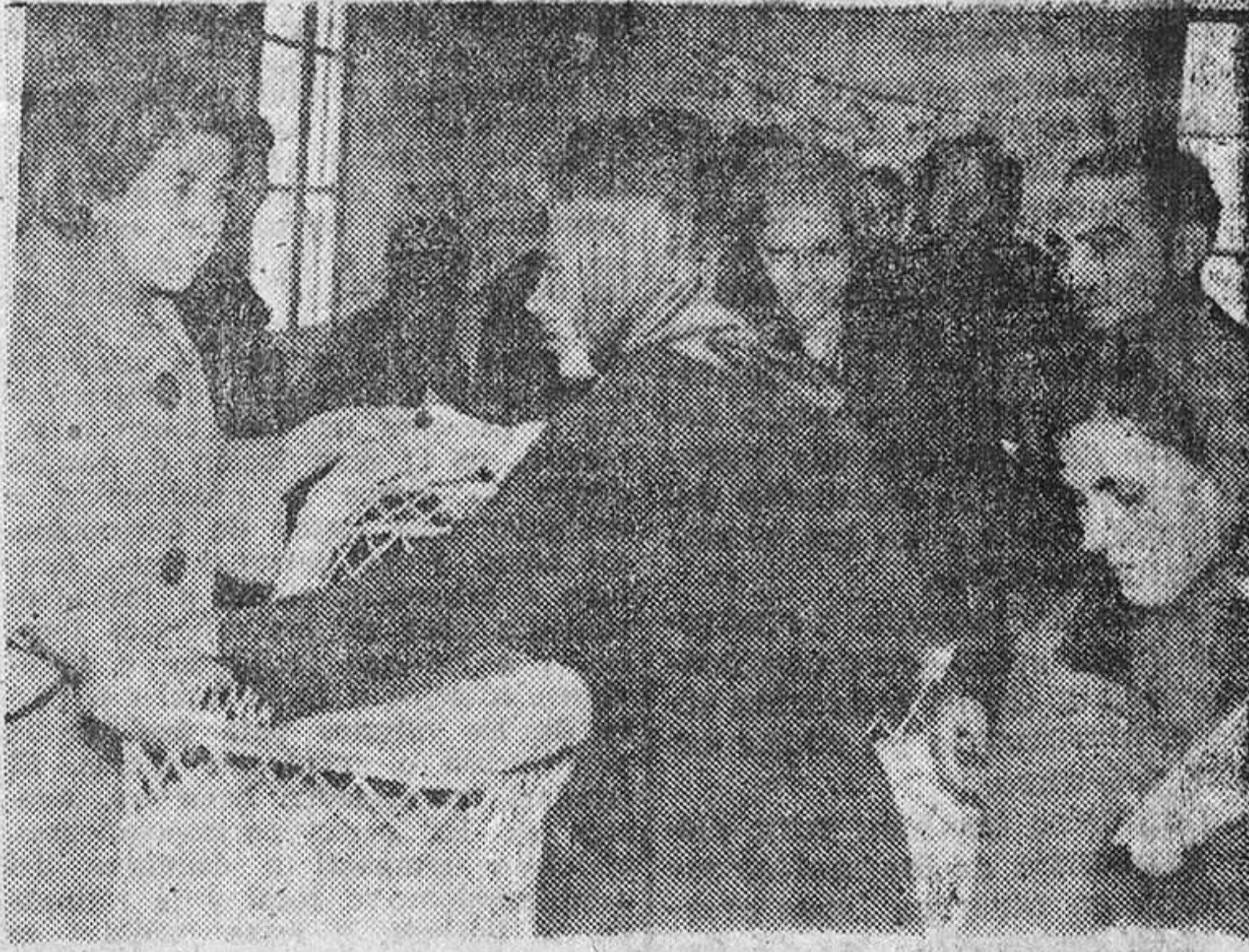
Un momento de la distribución de canastillas.

A las doce de la mañana del pasado domingo se efectuó la distribución de cincuenta cunas y otras tantas canastillas confeccionadas por afiliadas a la Sección Femenina con fondos de la Campaña de Navidad y Reyes.