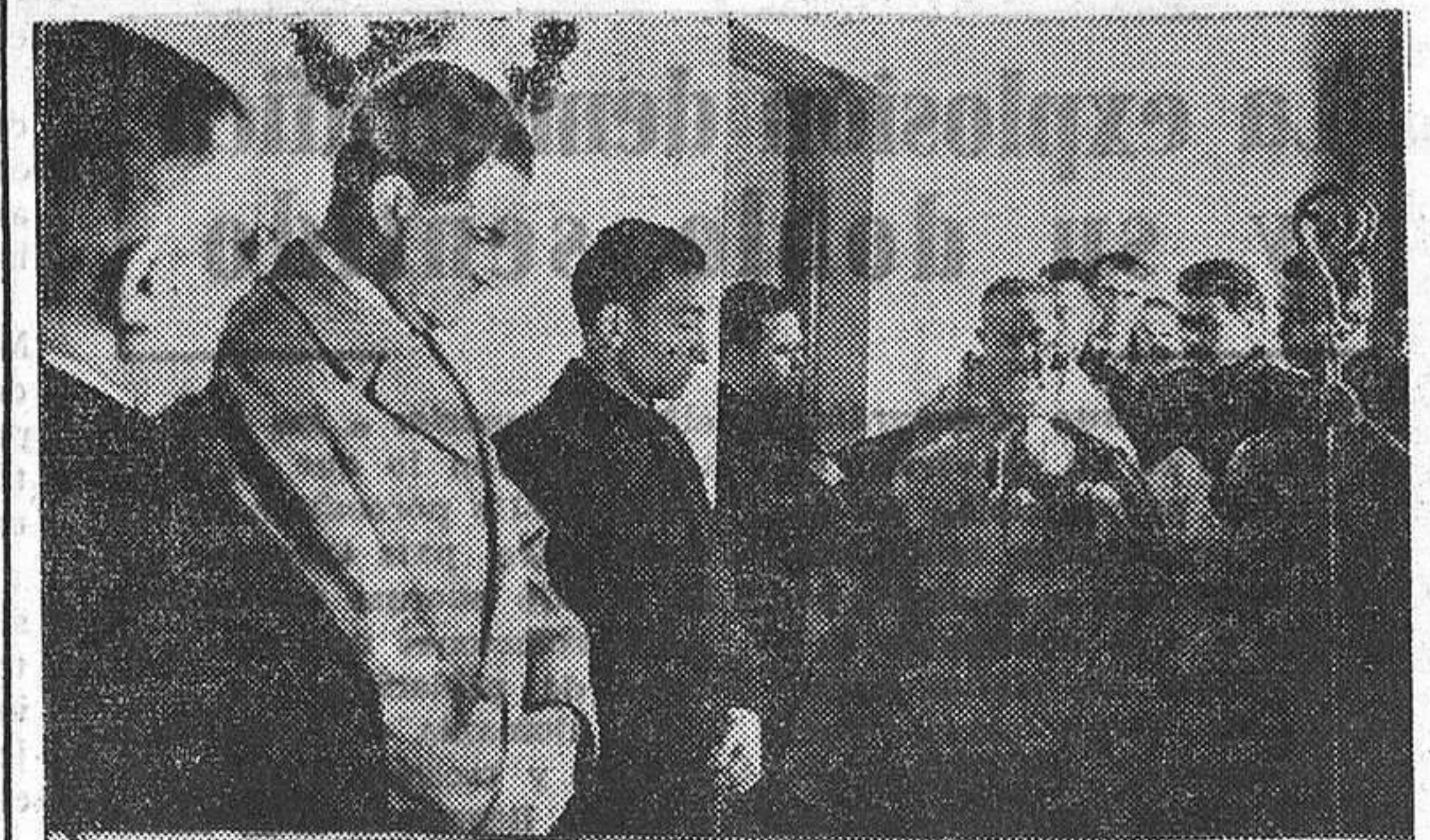
BENDICION DE LAS ESCUELAS.—.