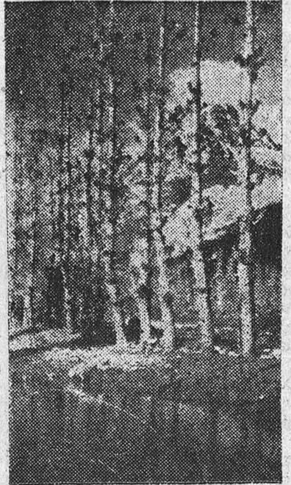
FLORECIERON LOS FRUTALES

Las mediciones registradas últimamente en parte del campo andaluz, han sido, por su excepcional importancia, de las que promueven alguna inquietud, porque uno empieza a pensar en qué pueden producirse encharcamientos en las zonas de depresión. Todo depende de que el temporal amaine, en cuyo caso esas lluvias torrenciales habrían sido como una bendición del cielo en cuanto nos limitemos a considerar el beneficio que reportan a la sementera. En cambio tememos que haya sus más y sus menos, en lo que concierne a la recogida del algodón de regadío que aún continúa en las fincas. Por lo que se refiere a la saca de remolacha, todo se reduce a una interrupción de las faenas, pero sin menoscabo para la raíz. Y ni que decir tiene que en muy extensas zonas peninsulares, el agua por una parte, y la mucha blandura del suelo en otras, han hecho que la colectividad campesina se repliegue y pase por una fase de forzado descanso.