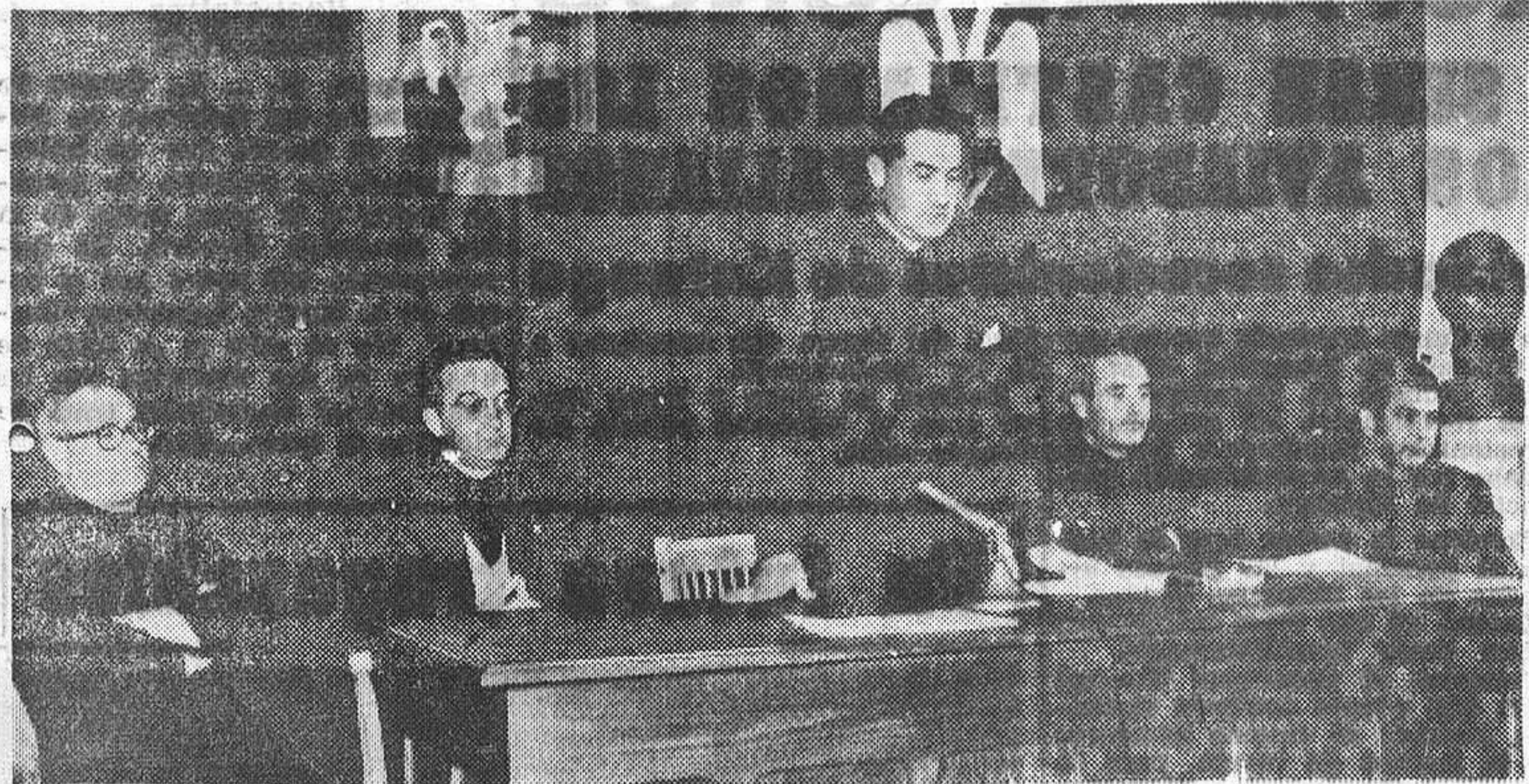
El jefe provincial clausura la reunión de delegados locales de Juventudes.

El señor Hellín Sol pronunció una importante alocución El Delegado Provincial le hizo patente la adhesión de todos los delegados