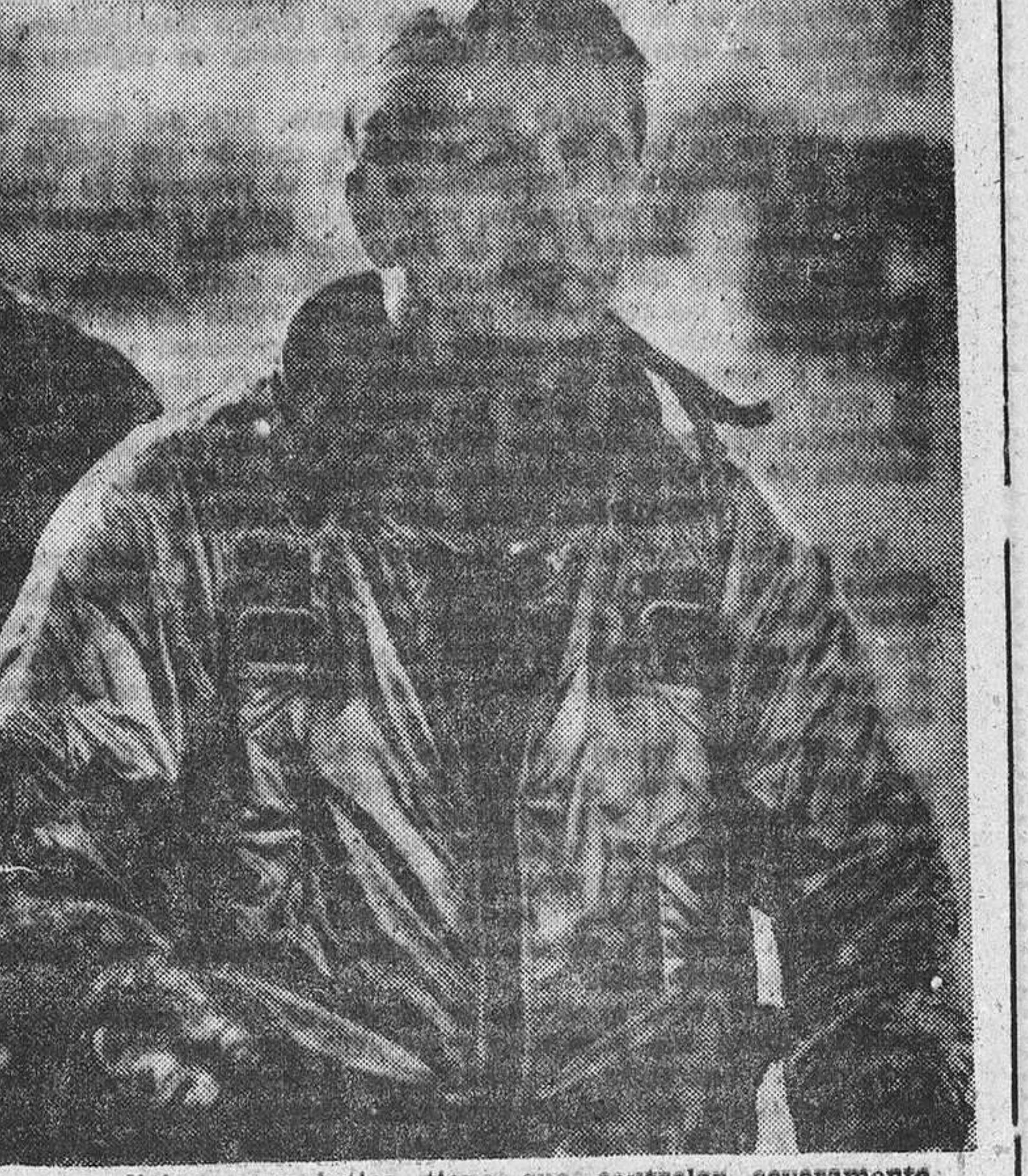
La medicina aeronáutica tiene que controlar severamente al piloto moderno.

Las instalaciones, que requieren la técnica actual en todas las profesiones, el magnífico plantel del personal Técnico Médico del Aire, trabajo incansable por mantenerse al día en las investigaciones médicas de actualidad y sacar el máximo partido al material existente en continua y necesaria renovación por los adelantos técnicos citados. No queríamos que faltasen en el cincuentenario de la Aviación española estas líneas de modesto homenaje a la competencia, capacidad y extraordinarios servicios prestados a la Aviación por los Servicios Médicos del Aire, en su continua y casi silenciosa, pero eficientísima labor. BALTASAR CASTRO Y JAVIER DEL RÍO