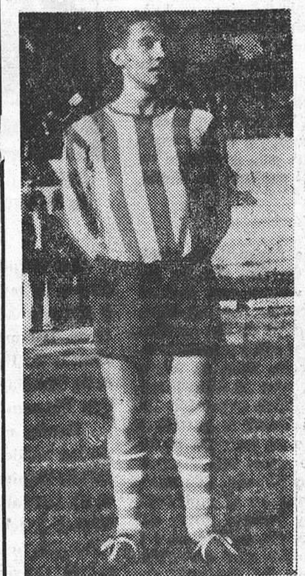
Un nuevo partido a su cuenta.

El medio De la Hoz ha jugado en el Atlético trece encuentros. Es, desde luego, mal número; pero a él no le importa, porque no es superstitioso, como nosotros tampoco lo somos.