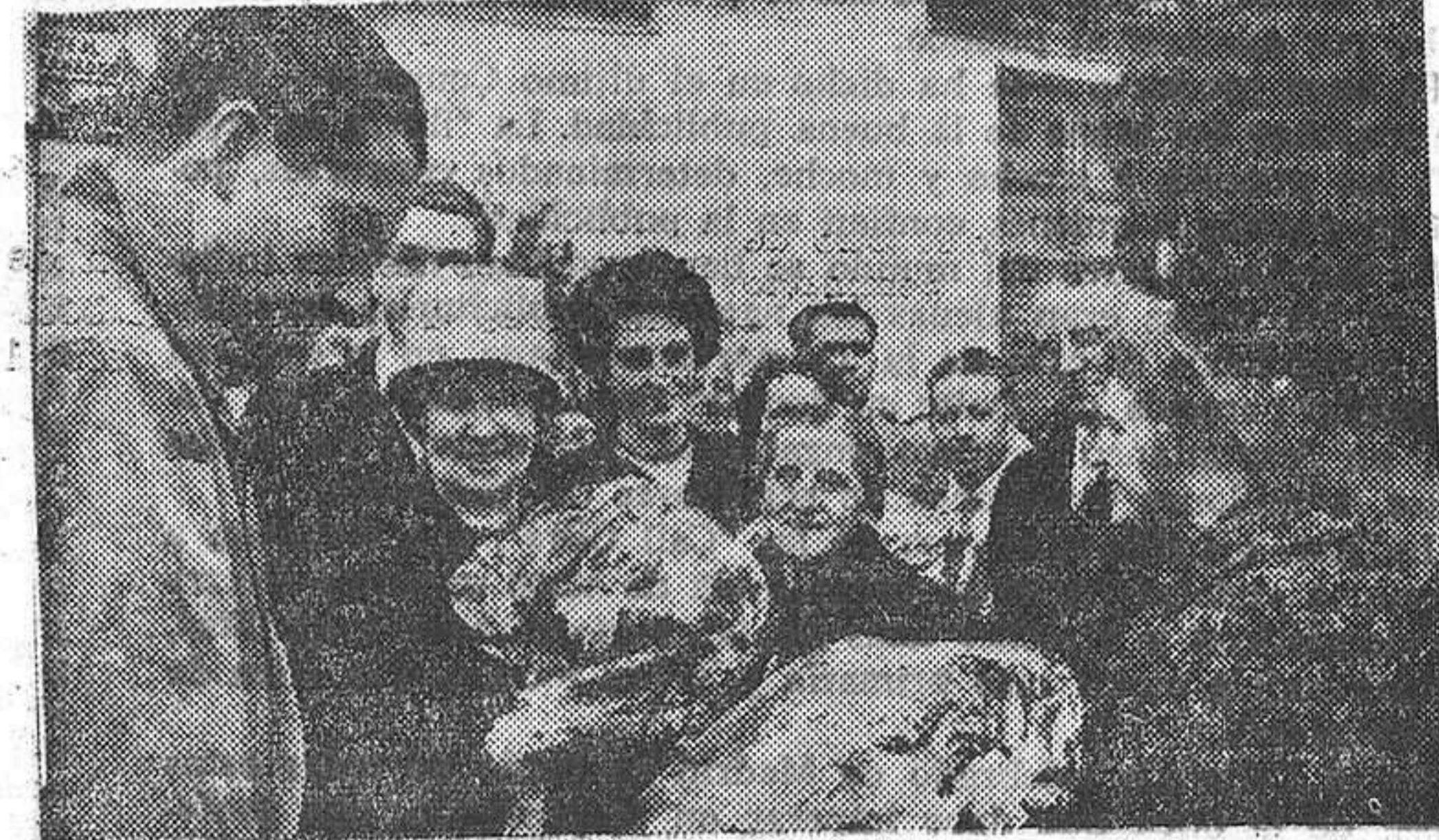
OFRENDA DE RAMOS DE FLORES.—(Foto Trabanca).

El acto concluyó con una comida servida por el restaurante Valderrey, de Zamora, en el casino del pueblo.