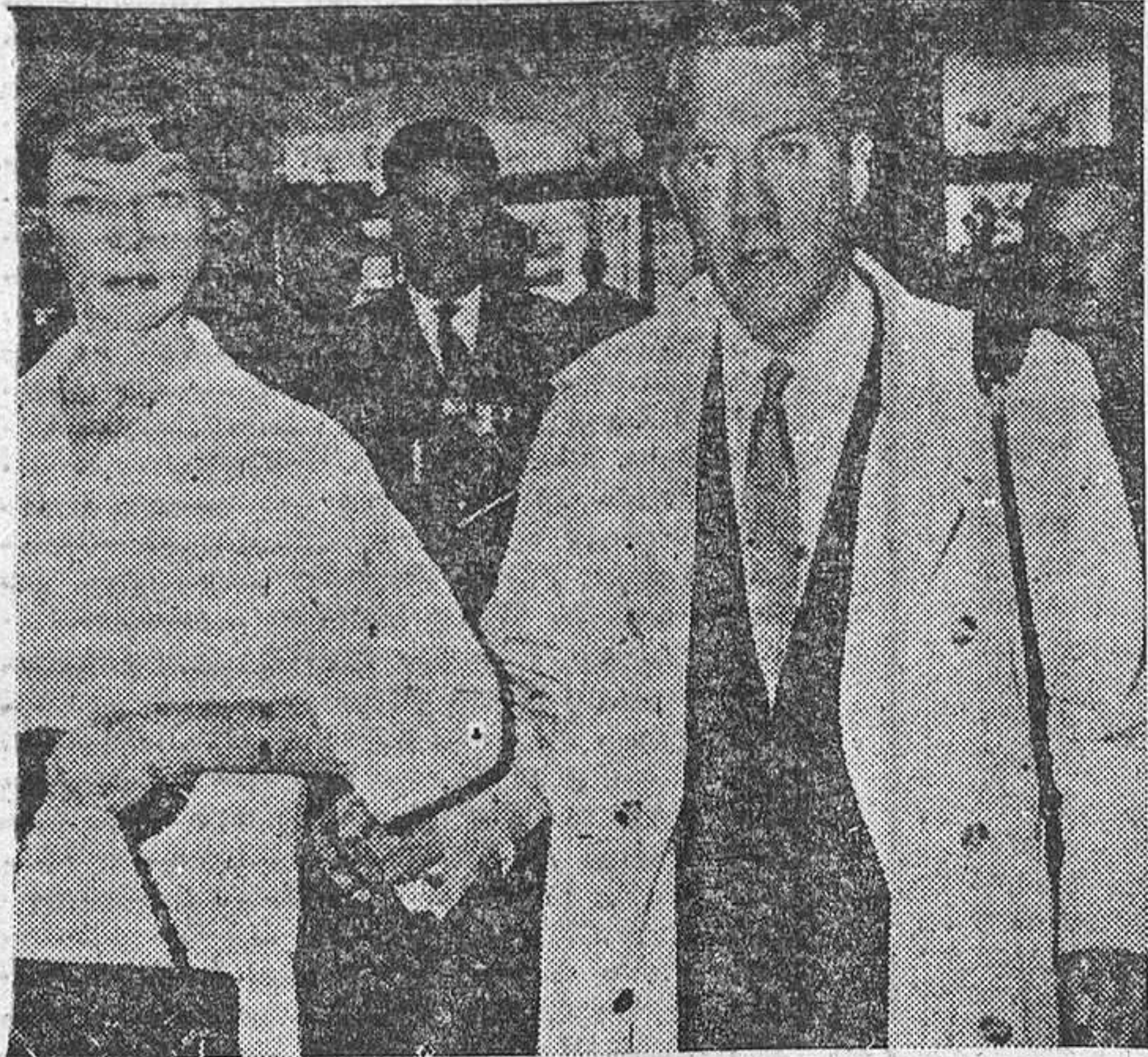
Lauren Bacall (viuda de Humphrey Bogart) con su marido, Jason Robards.

La actriz Lauren Bacall acaba de contraer matrimonio con Jason Robards, también actor, de gran popularidad en Estados Unidos. Desde muy poco después de la muerte de Humphrey Bogart se habló ya de un próximo matrimonio de su viuda. En principio parecía que iba a ser el futuro esposo de Lauren Bacall el discoloro y eterno galanteador Frank Sinatra. Efectivamente, él fue asiduo acompañante de la actriz en los primeros momentos de viudedad. Lo había sido también antes en los momentos críticos de la enfermedad de Humphrey Bogart.