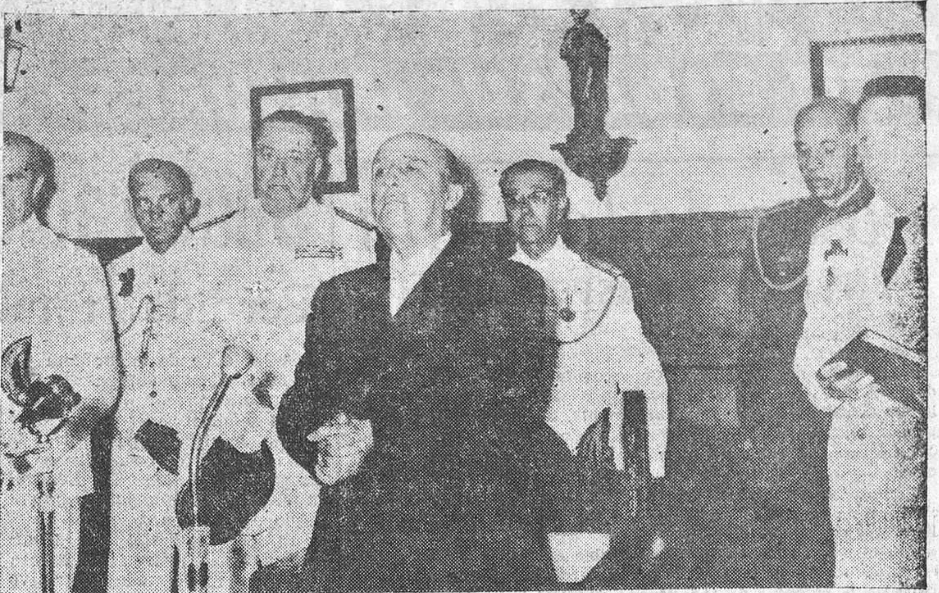
Fuenterrabía.—Su Excelencia el Jefe del Estado agradece el homenaje de todos los marineros de Fuenterrabía, durante el acto conmemorativo del VI centenario de la fundación de la Cofradía de Mareantes.