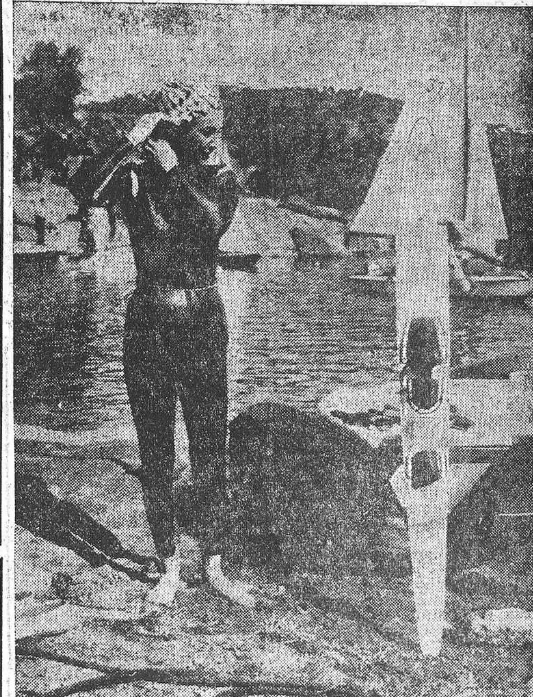
altura de nuestro tiempo: se confunden...

—Quiero realizar un arabesco de números que avance sobre el espectador... —continúa Dalí. Aquella concreta vigilancia alertada de nuestra inicial conversación ha desaparecido, sustituida ahora por una notable obsesión claramente perceptible. Dalí, ante su obra, está entregado, desarmado. ¿Es así el éxtasis necesario al pintor ante