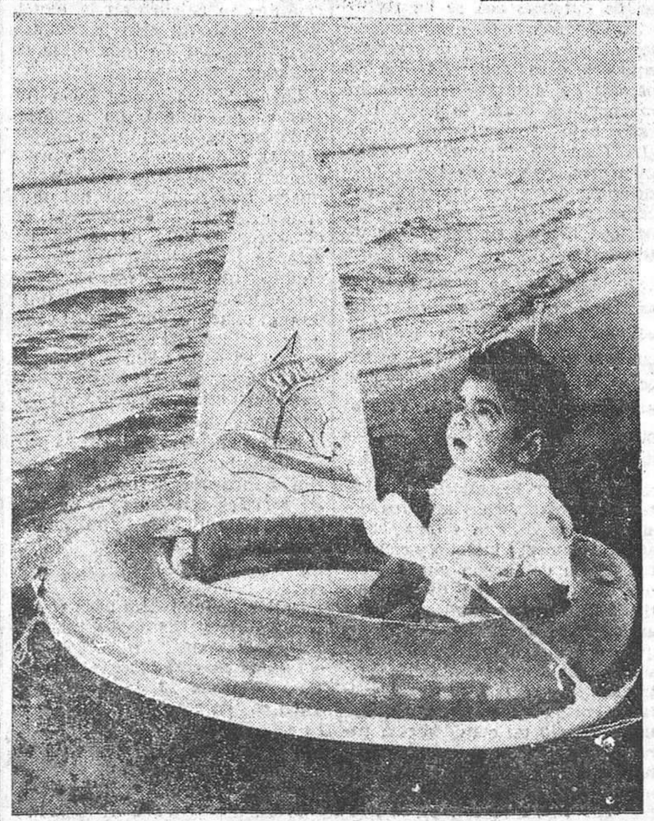
Para el hijo del Sha de Persia ha llegado la hora del primer baño. Acaba de cumplir nueve meses. Aquí lo vemos sobre un bote en la residencia de verano del Emperador, en el Mar Caspio.