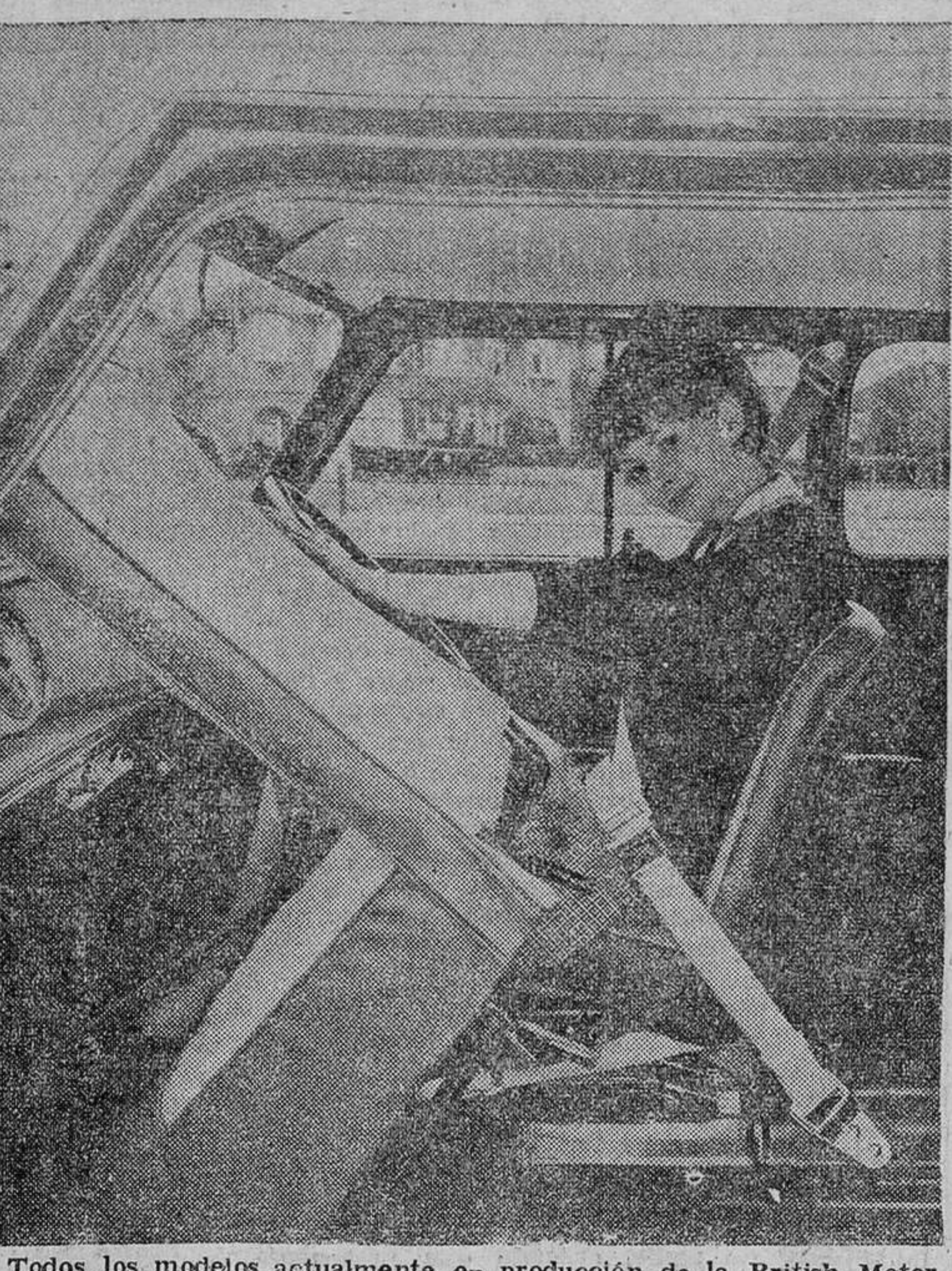
Todos los modelos actualmente en producción de la British Motor Corporation, de Birmingham (Inglaterra), tienen puntos integrales de enganche para correas de seguridad. En este gráfico, una señora prueba un cinturón de seguridad fijado al túnel del árbol, la bisagra de puerta y el estribo.