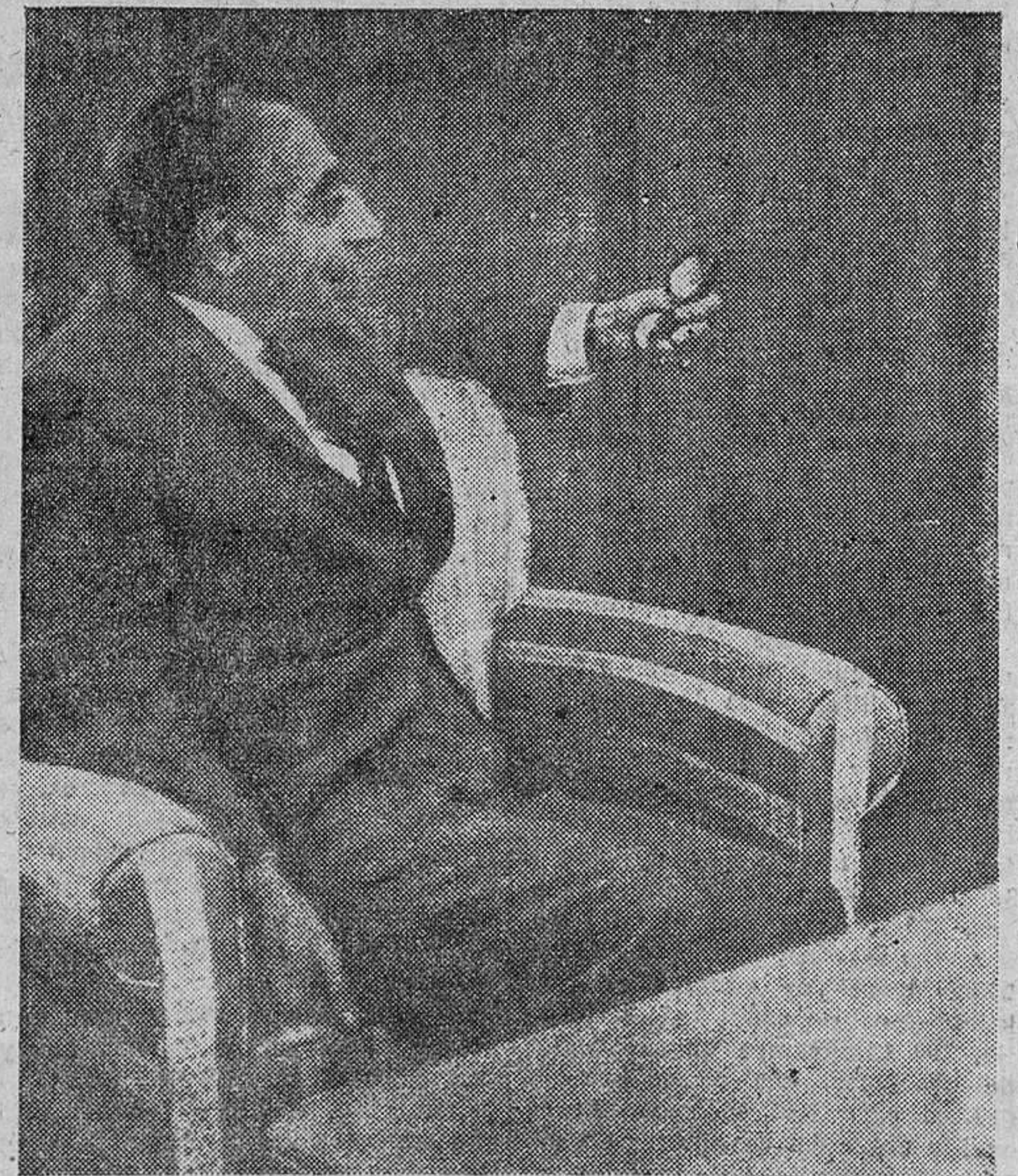
El primer ministro persa, Amiri.