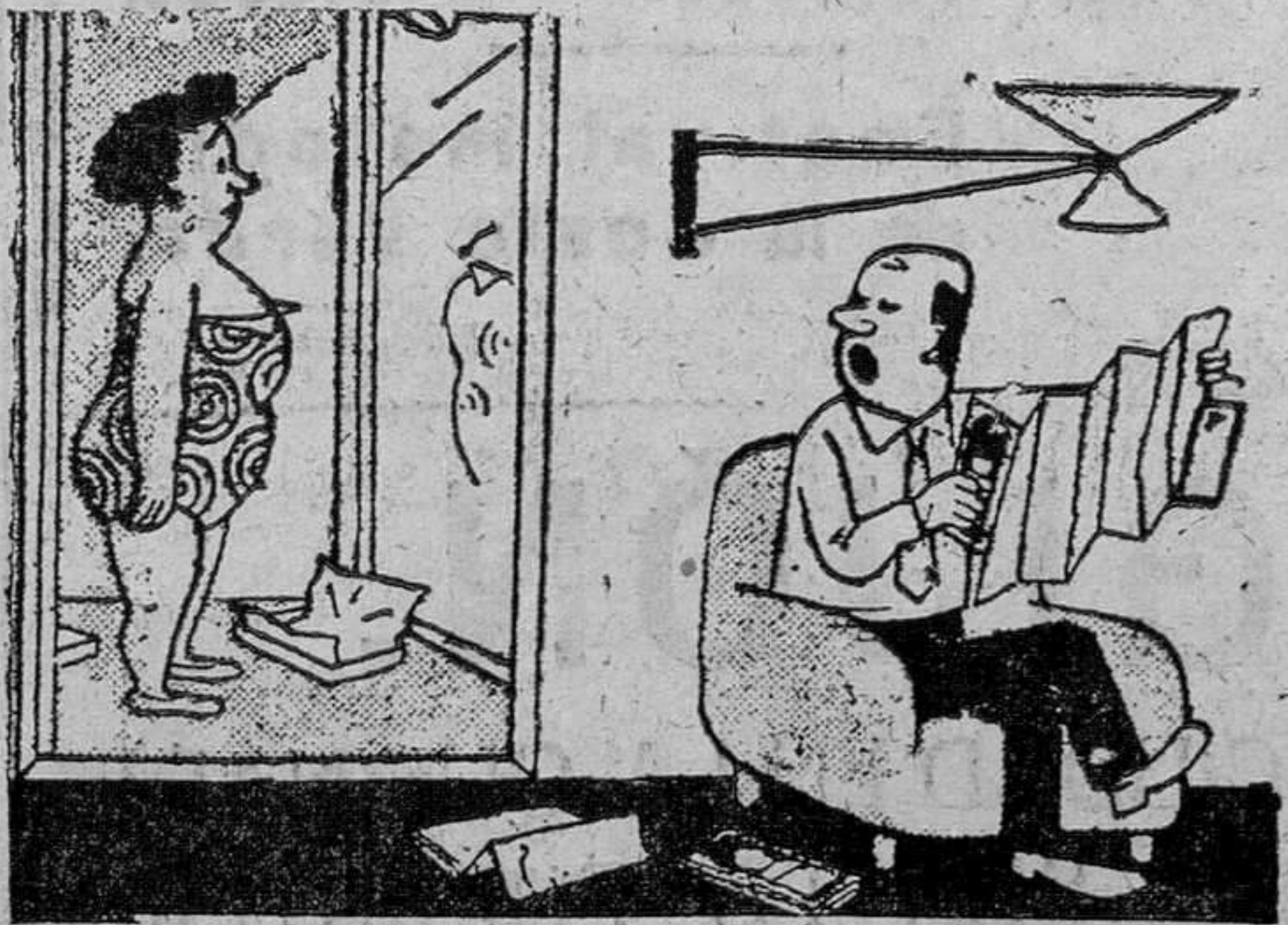
—¿Te has decidido ya a pasar el fin de semana en la montaña?—