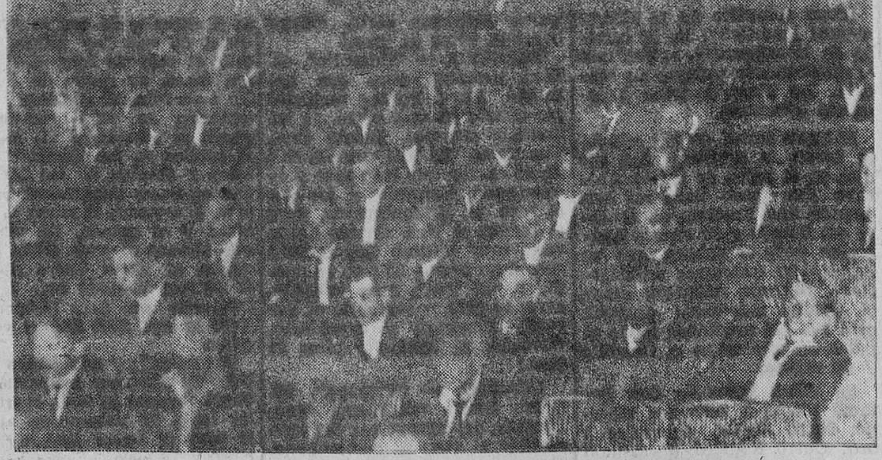
LOS ASAMBLEISTAS.—(Foto Jesús.)

El Delegado Sindical presidió una clamorosa Asamblea