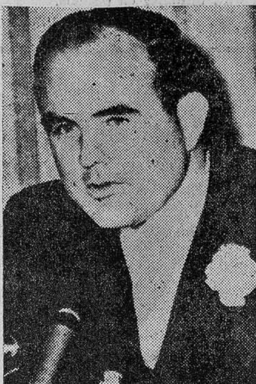
El Gobernador de Alabama, John Patterson, acusó al Presidente y al Fiscal General de ser los responsables de los desórdenes. Es un error la integración racial.

Uno de cada diez norteamericanos es un negro. Pero aún hay más: se está produciendo una enorme mutación migratoria que transforma, casi de raíz, el estrato de las poblaciones. ¿Por qué? Por una simple razón que yo he podido observar personalmente en la propia capital norteamericana, en Washington.