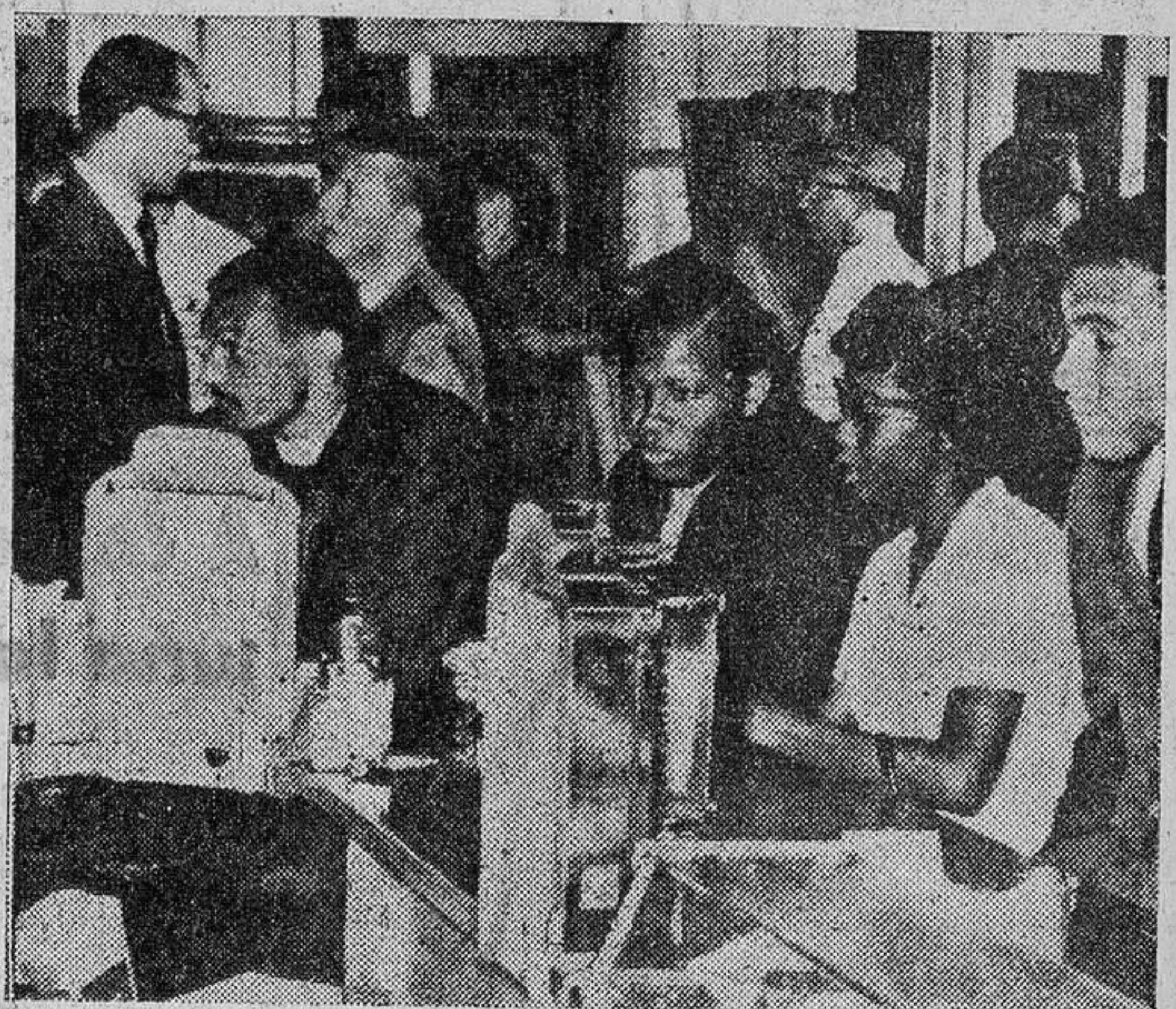
Por primera vez, el bar de una estación de autobuses de Montgomery, bajo la vigilancia de la Policía, fue abierto a los negros que formaban parte del "autobús de la libertad". Pero los viajeros, al partir, oyeron insultos tales como "puercos integracionistas", "traidores a América". Partieron de Montgomery después de haber visto que "ninguno tiene simpatía por la causa de la igualdad entre blancos y negros". "Pero nosotros creemos en esta idea y por ella estamos prontos a morir", han dicho.