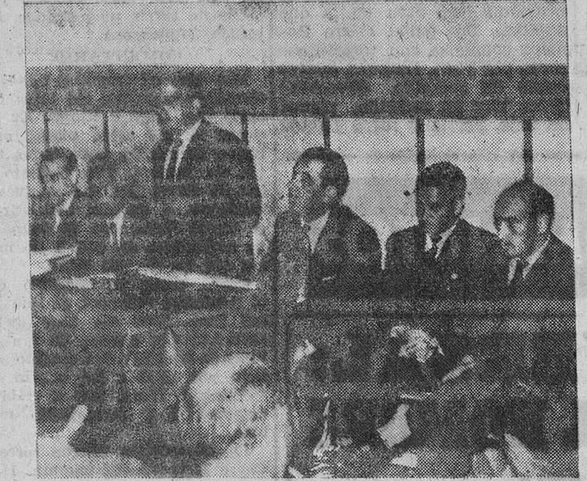
El Delegado Provincial dirige la palabra a los asambleístas.