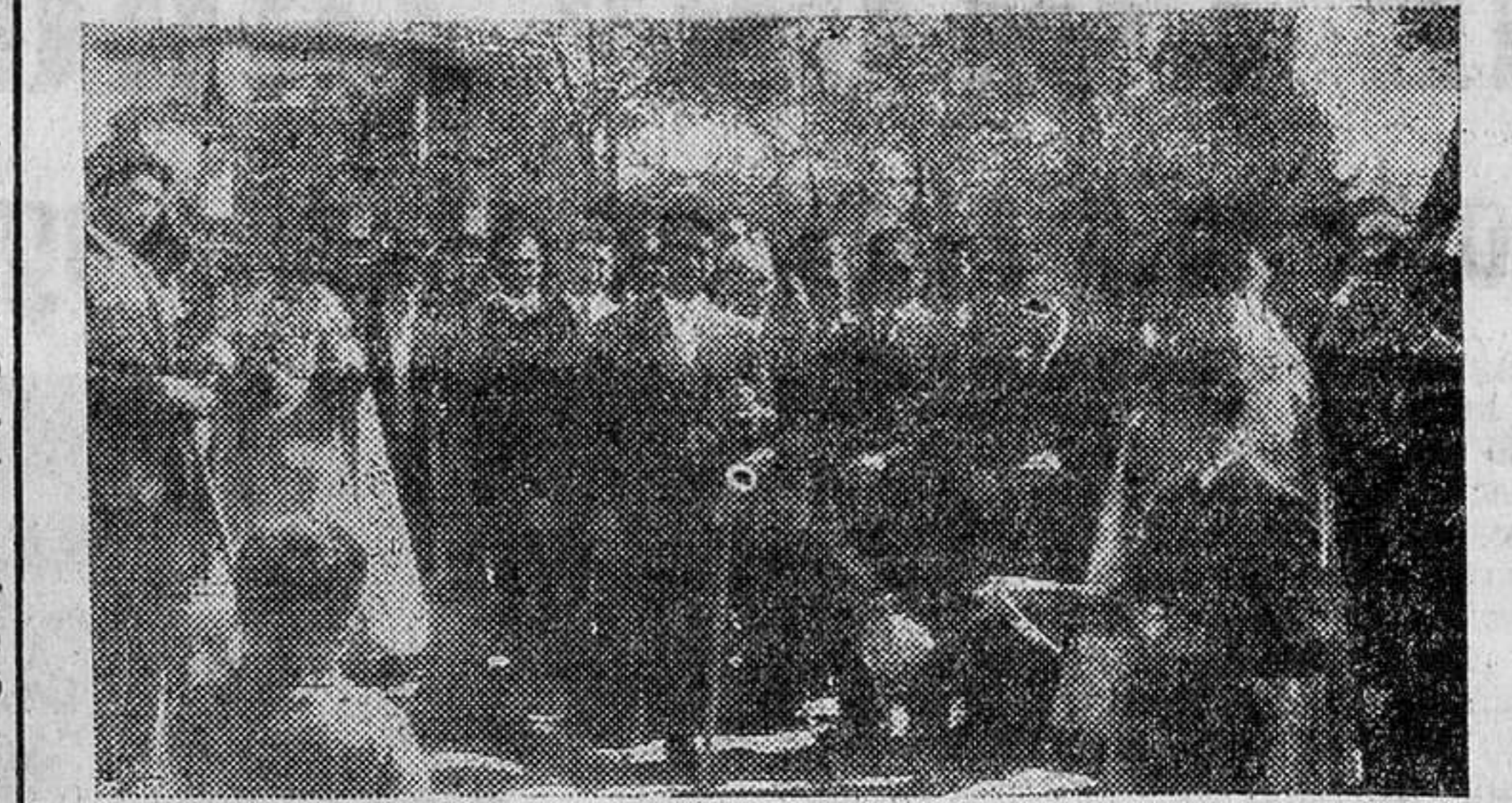
La venerada imagen de la Virgen del Rosario, sacada en procesión, hace estación para la bendición de los sembrados en un descampado.

Como todos los años, pero si cabe con mayor entusiasmo y esplendor, el pasado día 10 se celebraron en esta villa las tradicionales fiestas del "Lunes de Aguas".