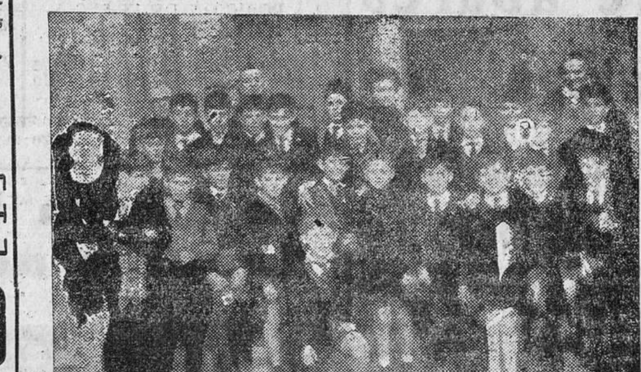
Alumnos de segundo curso del Colegio de Santa María de los Rosales, de Madrid, fotografiados ante el Pórtico de la Gloria de la Colegiata con motivo de su visita a esta ciudad en excursión turística.

Durante estos días nuestra ciudad ha registrado una corriente turística inusitada. Coches de distintas matrículas extranjeras y autocares de los últimos modelos, también con matrículas foráneas, han rodado por nuestras rúas y han depositado numerosos turistas ansiosos de admirar las ricas joyas arquitectónicas que encierra esta bella e histórica ciudad.