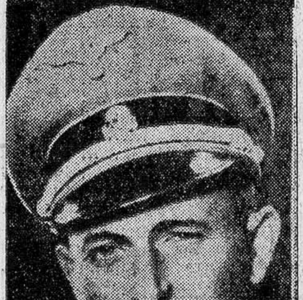
Eichmann viste el uniforme de oficial nazi.

Pronto comenzaron a llamar la atención de los servicios secretos, los manejos de un hermano de Eichmann. Con alarma