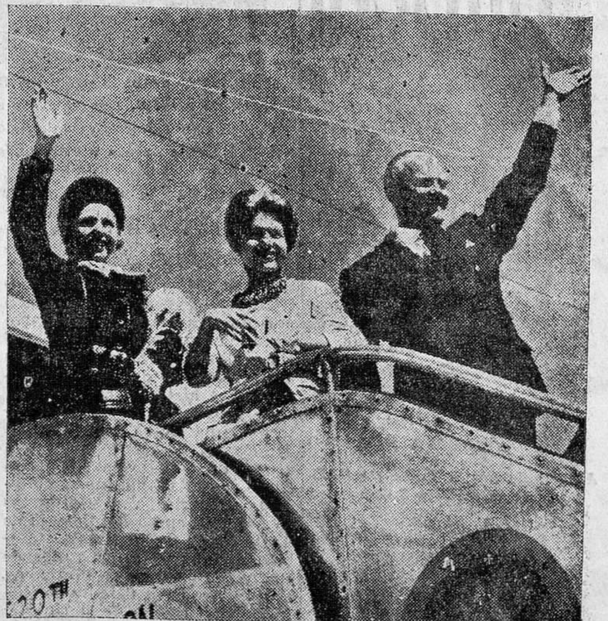
Esta mañana han salido del aeropuerto de Barajas el embajador de los Estados Unidos en España, Mr. Lodge, acompañado de su familia, para su país natal, dando así fin a su cargo en nuestro país. A esta despedida acudieron diversas personalidades, que les testimoniaron, así como un grupo de unos, que les obsequiaron con algunas canciones. En la foto vemos a la familia Lodge despidiéndose del numeroso público que lo despidió.