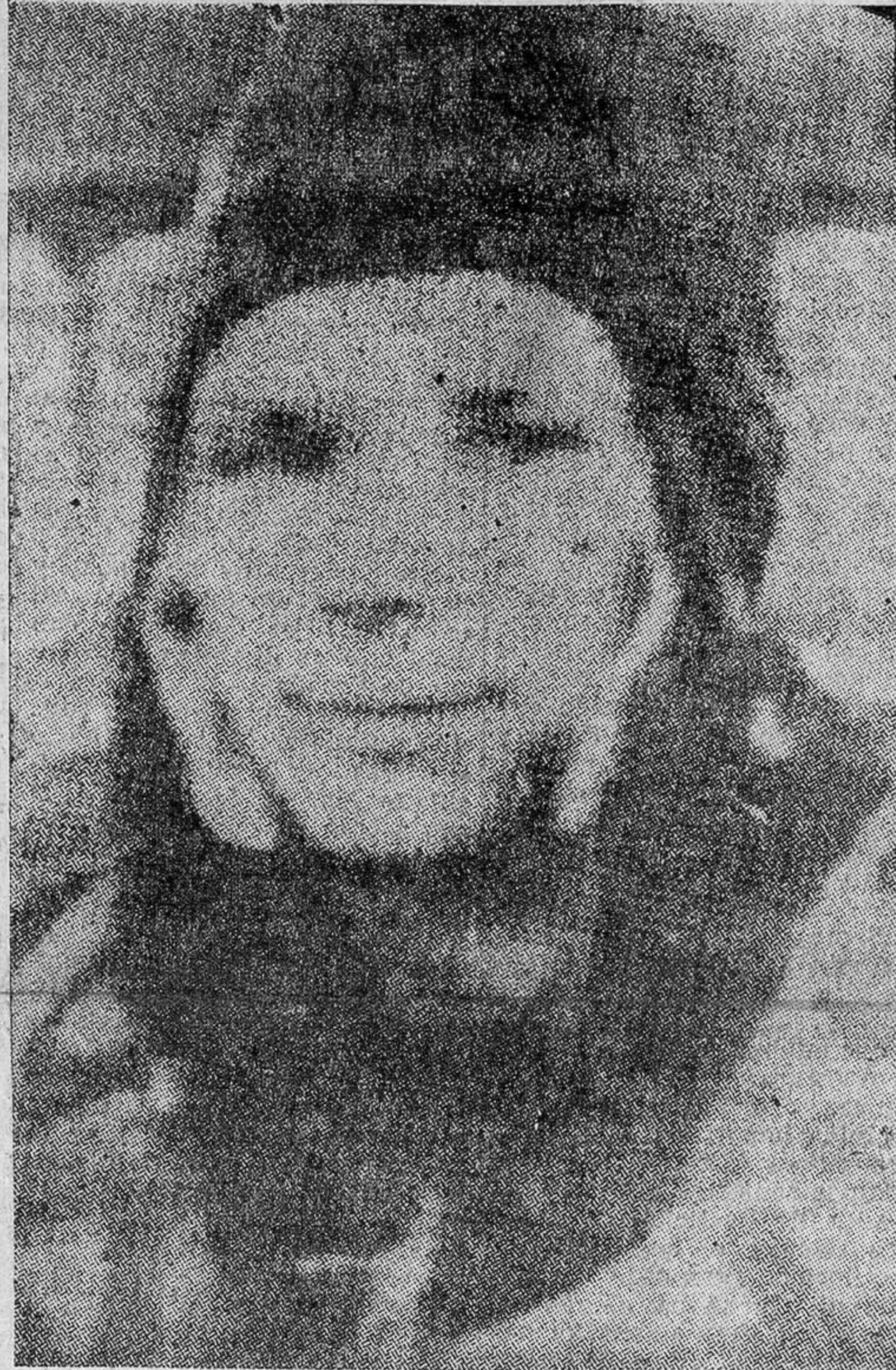
Yuri Gagarin, el primer astronauta del espacio.

Cabo Cañaveral, 13.—Dos de los tres astronautas norteamericanos que aspiran a ser los primeros en tripular un satélite espacial estadounidense, han declarado que se sienten decepcionados por el hecho de que un astronauta ruso se les haya adelantado en la hazaña. Sin embargo, ambos, Alan B. Shepard y Virgil I. Grisson, han declarado que los Estados Unidos desempeñarán su papel, conforme lo previsto, en la conquista del espacio.—Efe.