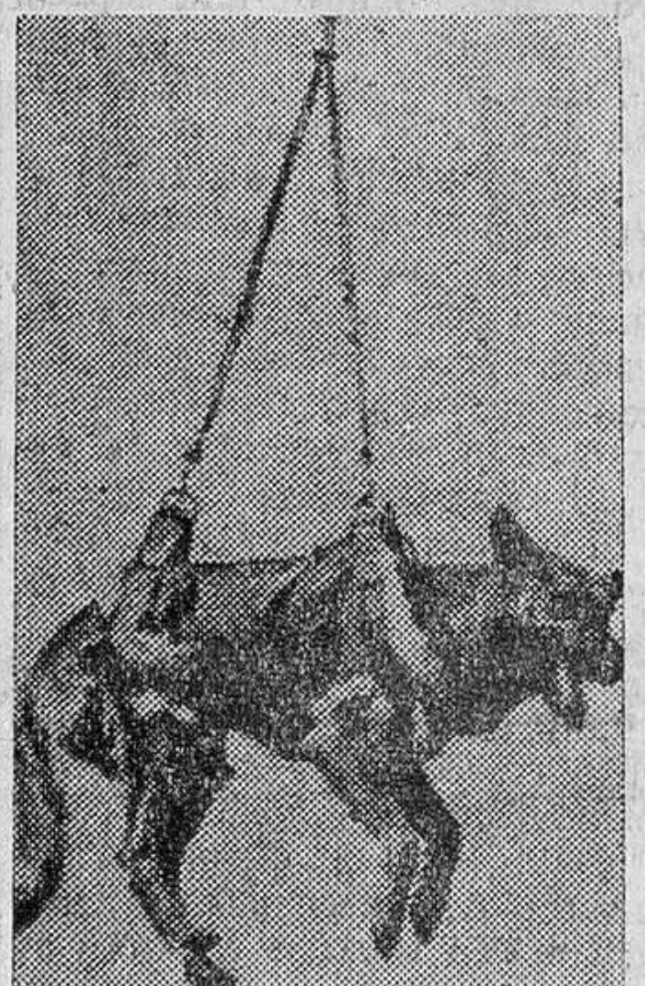
"Liska", la perra que también viajó al espacio.

Otras alteraciones insospechadas se presentan, sobre to-