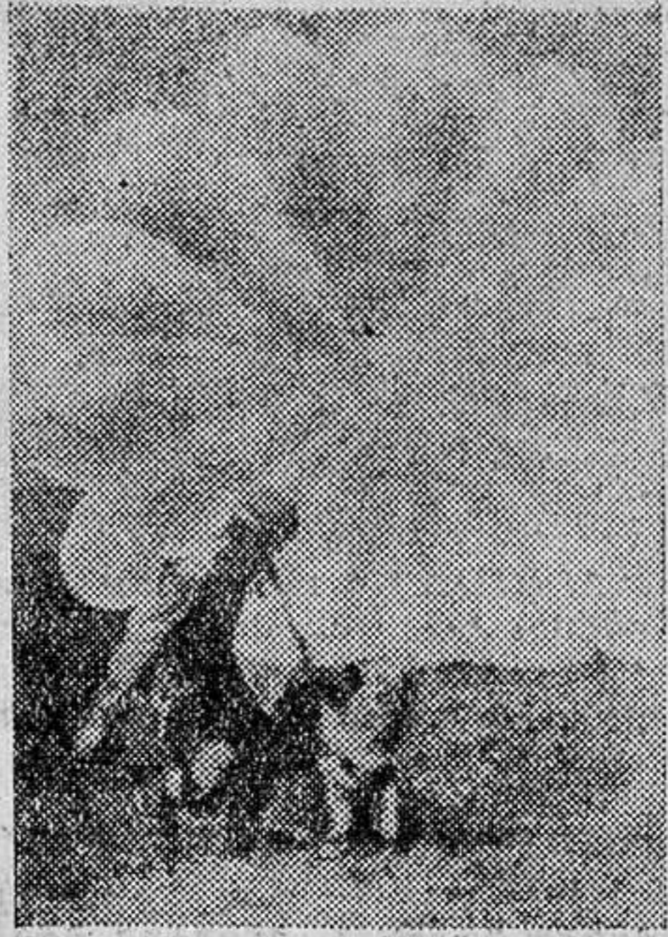
A su llegada a tierra, "Liska" no presentaba alteración alguna.