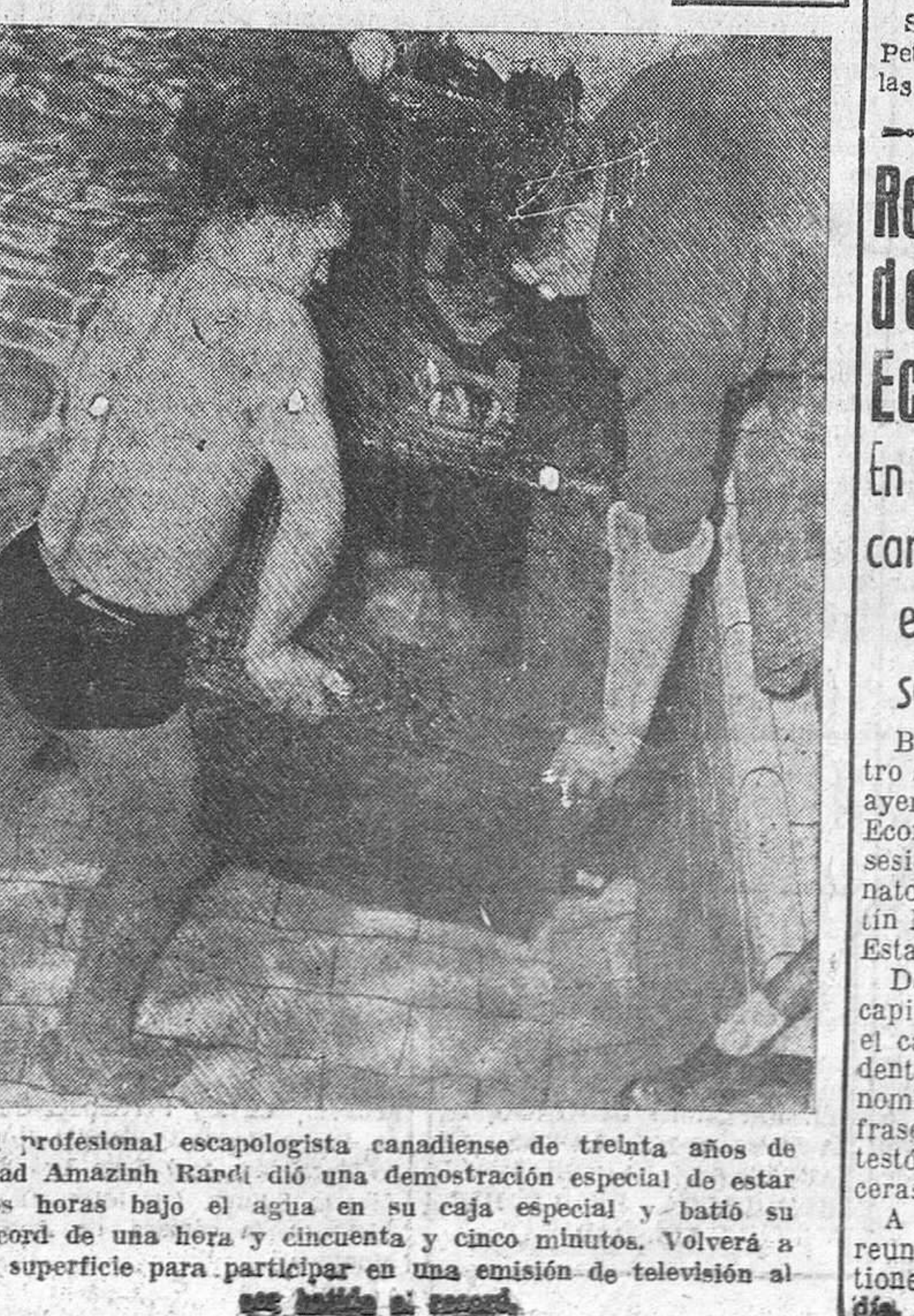
El profesional escapologista canadiense de treinta años de edad Amazinh Randi dio una demostración especial de estar dos horas bajo el agua en su caja especial y batió su record de una hora y cincuenta y cinco minutos. Volverá a la superficie para participar en una emisión de televisión al