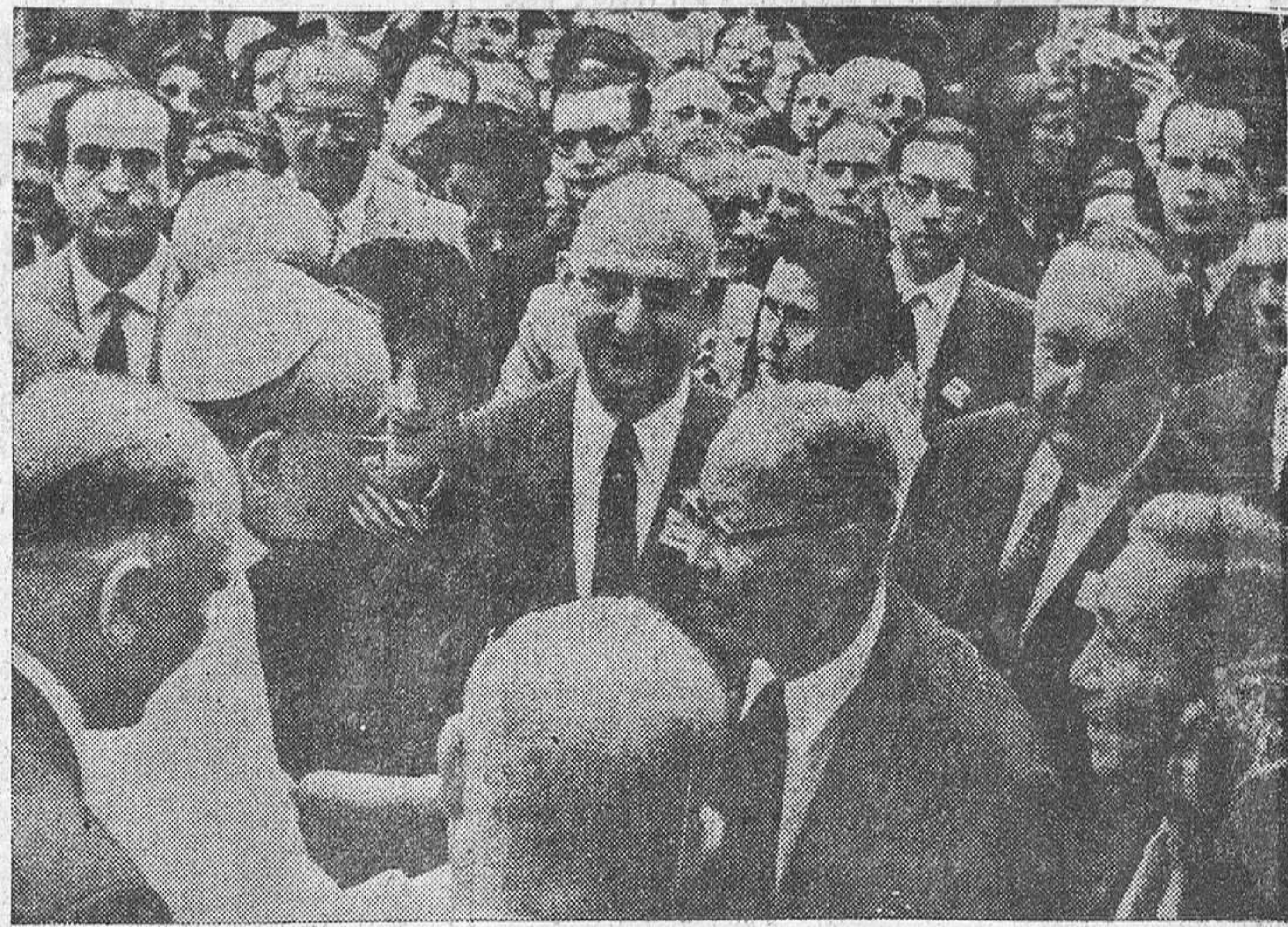
Pío XII recibe a los médicos ante los cuales pronunció su postrera lección sobre la moral familiar.

siempre más a los conyuges una conciencia escogida; la planificación de la familia debe ser resultado de una decisión cristiana, tomada después de reflexión y plegaria. Observará el lector que, a vueltas de circunloquios y palabras solemnes, no faltan expresiones capaces de poner en sospecha a cualquiera. Es cierto que luego la relación asume el tono de una sentida y profunda espiritualidad cuando afirma que los conyuges cristianos no deben vacilar en ofrecer su decisión humildemente a Dios y seguirla con una conciencia cristiana, pero cuando se llega a la conclusión no duda en proclamar rotundamente que los medios adoptados en el proyecto de familia son en gran parte cuestión de elección clínica y de estética admisibles a la conciencia cristiana. Los estudios científicos pueden justamente ayudar y son de ayuda en la valoración de los efectos y utilidad de cualquier medio en particular. Y LOS CRISTIANOS TIENEN DERECHO DE APLICAR LOS Hallazgos de la ciencia para fines BUENOS.