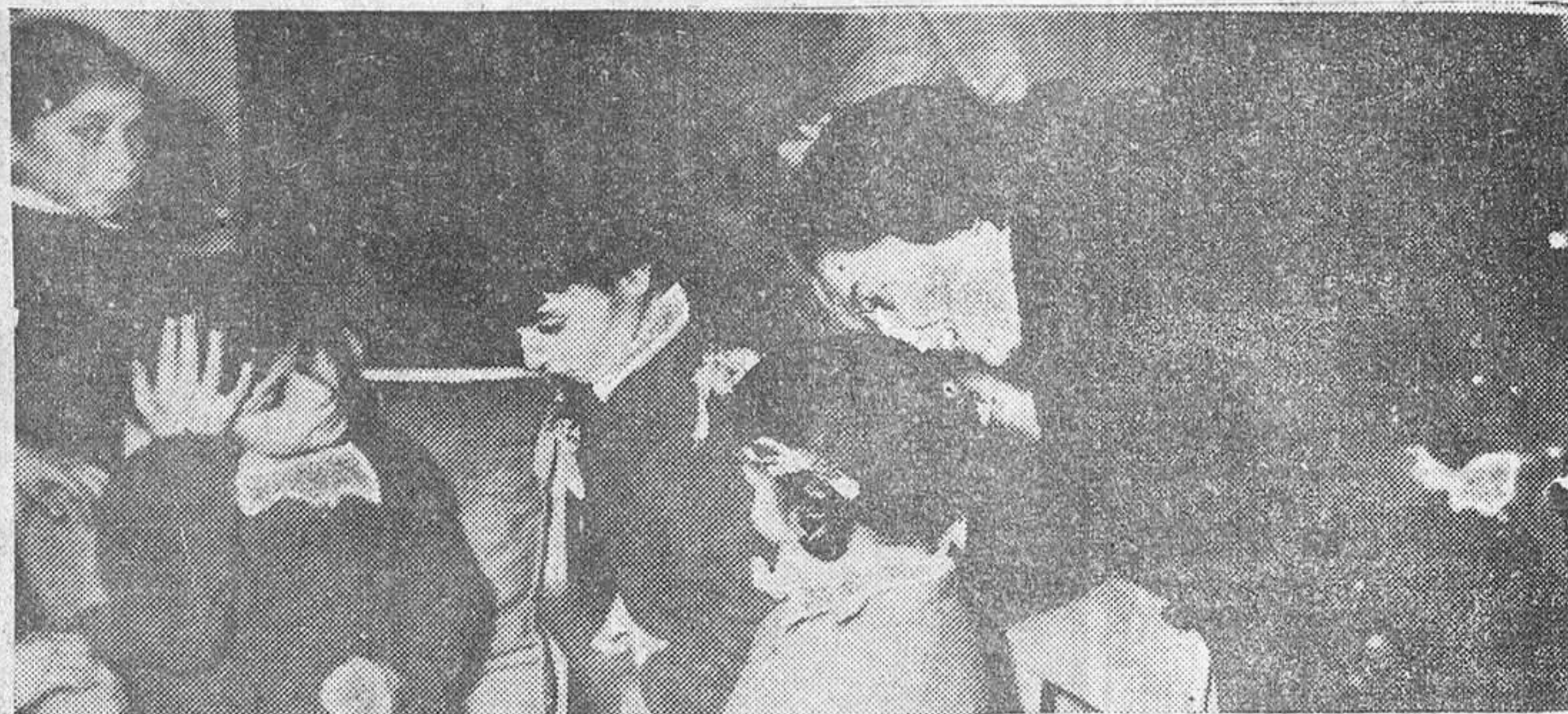
La esposa del Gobernador Civil y las damas que lo acompañaban, con las niñas recogidas en la Granja-Escuela de la Sección Femenina.

En la mañana de domingo, nuestras primeras autoridades y jerarquías visitaron a los niños de Ribadelago recogidos en los distintos centros docentes del Movimiento y de la Beneficencia, a los que obsequiaron con golosinas.