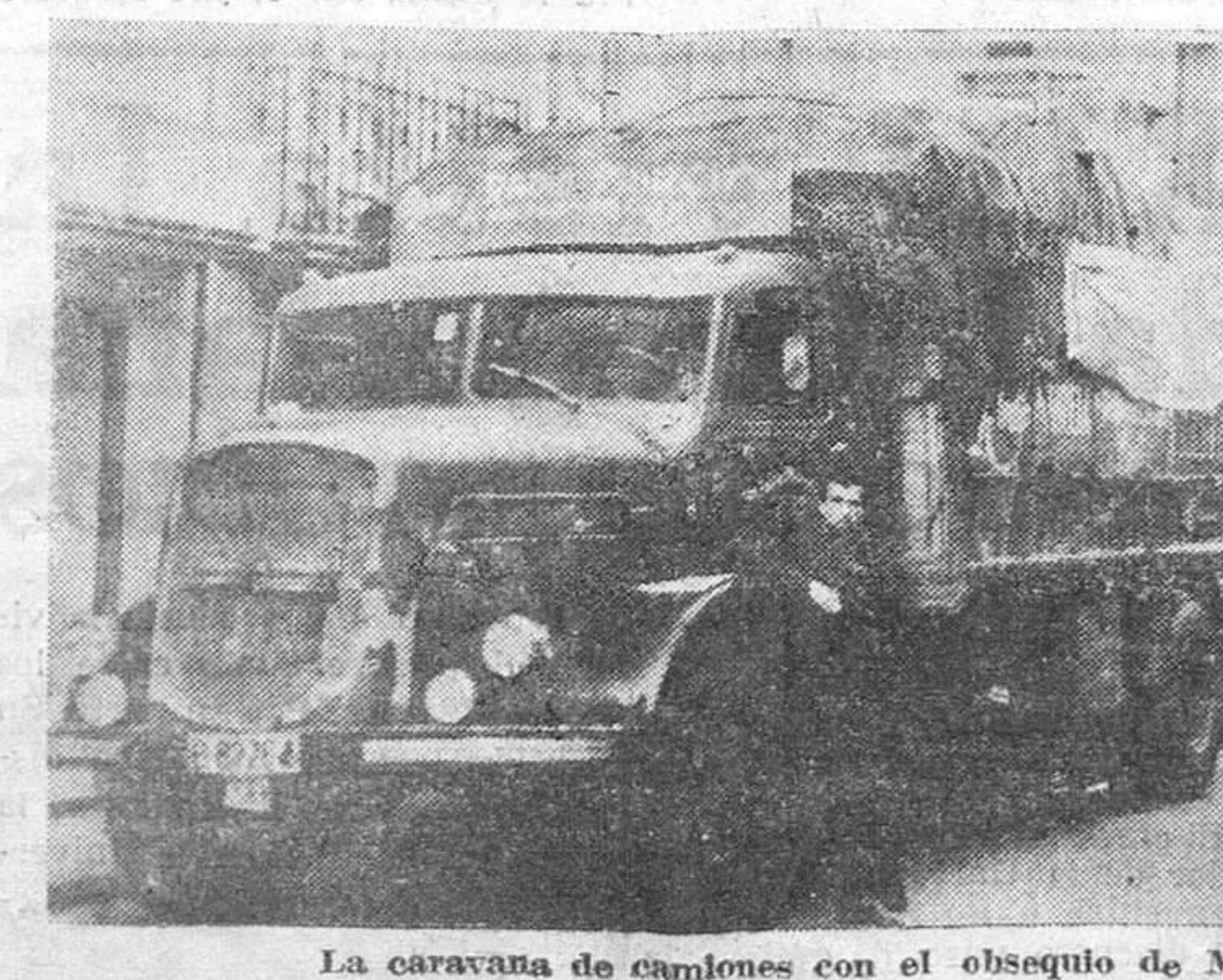
La caravana de camiones con el obsequio de Murcia.

Pueblo bendito de Sanabria pura. ¡Ribadelago!, de tragedia lleno; ¡Ribadelago!, pueblo de leyenda, mecido entre montañas y lucero. Duermes; ¡silencio!, que la noche umbrin le abrazó para siempre; ¡abrazo eterno! No turbar su reposo bajo el azul inmenso. Sonáste con las aguas de tu Lago, muellemente mirándote en su espejo: Narciso coquetón, tu orgullo siempre reflejado quedó; ¡dulce embeleso! Sonabas con tu Lago, ¡sueño puro! en la noche plomiza de un invierno; brisa suave alentaba la montaña, arrullando tu sueño placentero. Sonabas, envidioso de nenúfares, nostálgico, de amor, vuelto tu pecho, mirándote en las aguas cristalinas, do la luna bañaba sus reflejos. ¡Ribadelago!, pueblo de leyenda bajo las aguas de tu Lago inmenso; que otras aguas de celos consumidas, en su furor certero, lanzáronse, inclementes, hundiéndonos en su seno. ¡Silencio!... Está dormido... Descansa en paz en tu silencio eterno. JOAQUIN FERNANDEZ PEREZ Zamora, 12-1-59.