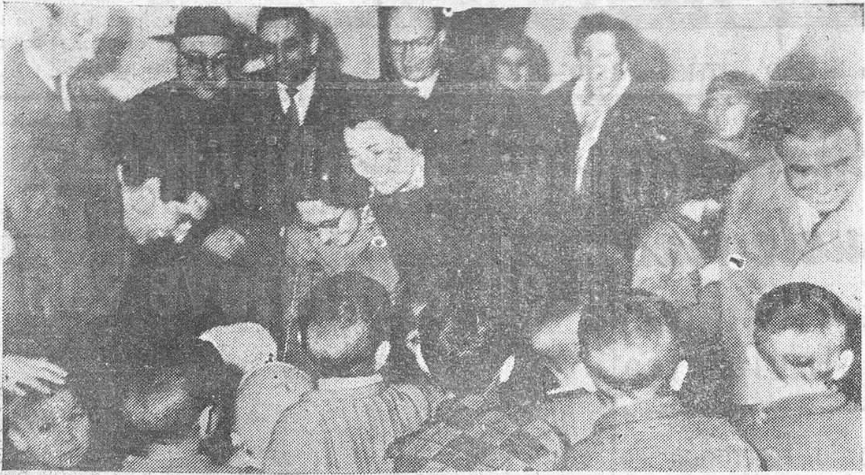
La visita a los niños y niñas recogidos en el Colegio «Nuestra Señora del Tránsito».