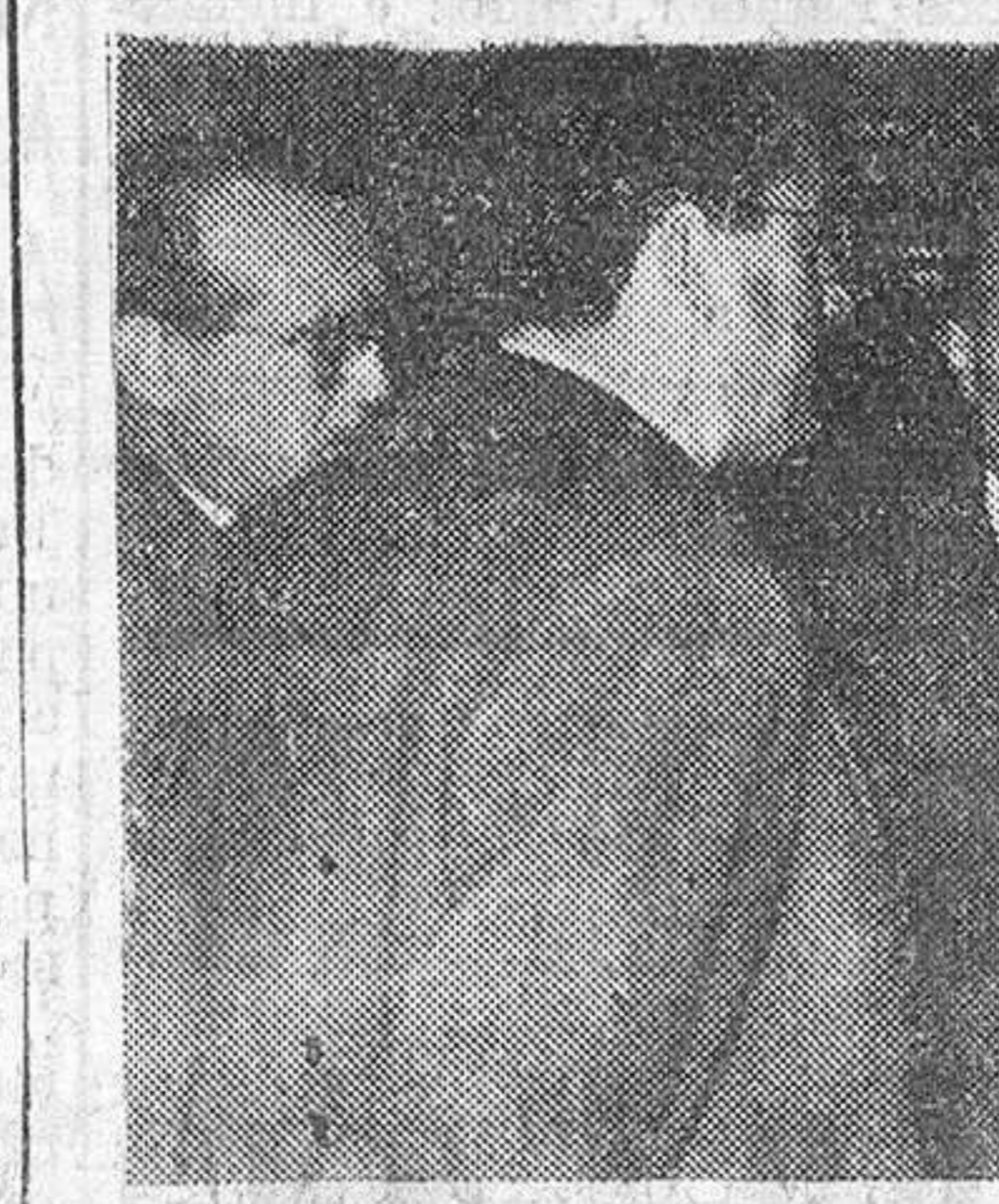
Las personalidades murcianas fueron recibidas en su despacho por el Gobernador Civil y Jefe Provincial del Movimiento, con quien conversó cordialmente.

«LA SAGRADA ESCRITURA puede instruirte en orden a la salvación por la fe en Jesucristo. Pues toda la Escritura es inspirada por Dios y útil para enseñar, reprender, corregir e instruir en la justicia a fin de que el hombre sea perfecto y apto para toda obra buena.» (2 Tim, 3, 15-17).